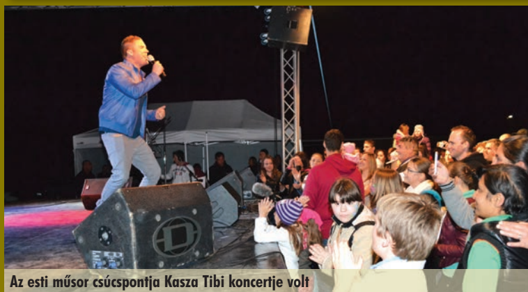
Az esti műsor csúcspontja Kasza Tibi koncertje volt