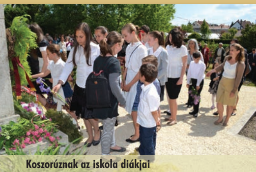
Koszorúznak az iskola diákjai