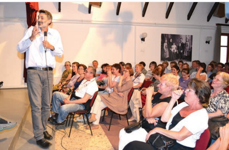
Az országSZerte ismert és közkedvelt előadó Pál Ferenc „A magánytól az összetartozásig” címmel tartotta meg – bizonyára sokunk számára

mára emlékezetes – előadását a Faluházban május 12-én. Sok gyakorlati példával, szemléletesen beszélt a szerelemről, a párkapcsolatokról.