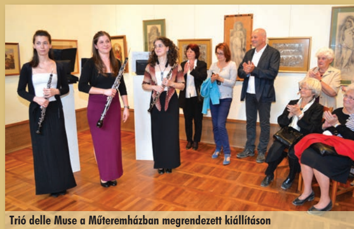
Trió delle Muse a Műteremházban megrendezett kiállításon