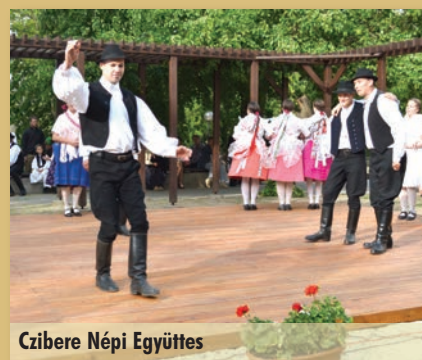
Cibere Népi Együttes