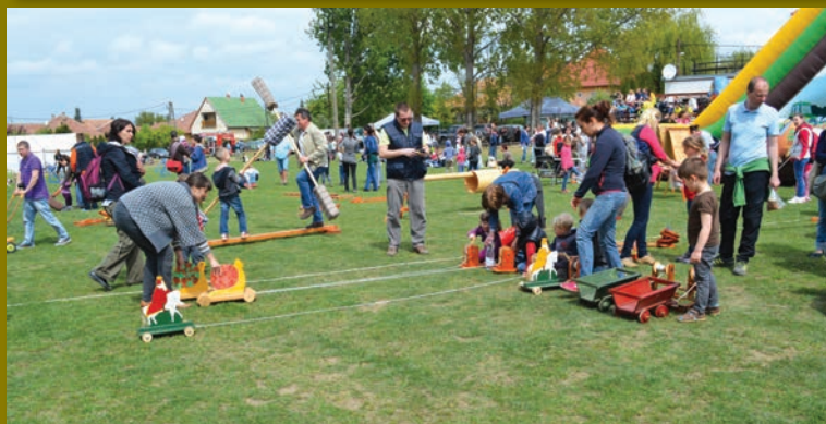
A népi játékok népszerűek voltak a gyerekek körében