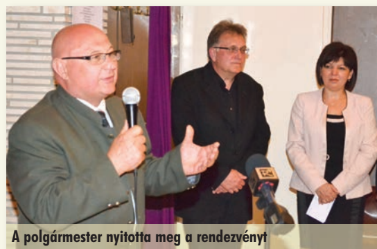
A polgármester nyitotta meg a rendezvényt