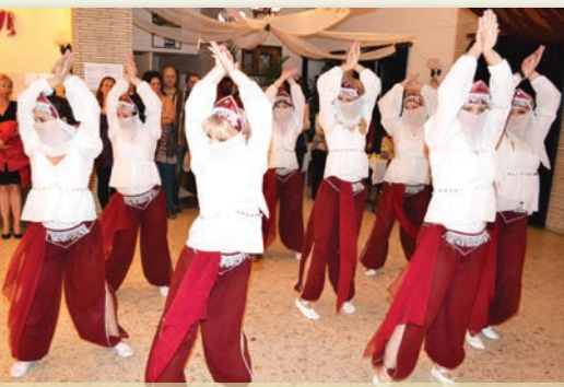
A szülői munkaközösség hastánca

Szadai összefogás, közös öröm és élmény. Olyan értékek, amelyek felbecsülhetetlenek. Értékek, amelyeket pedagógusok és szülők közösen, itt Szadán alapozunk meg.