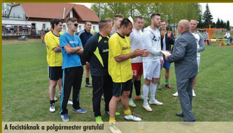
A focistáknak a polgármester gratulál