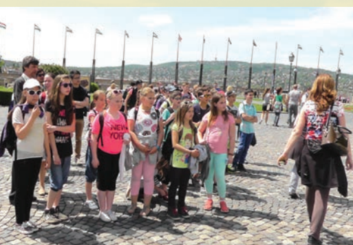
Kirándulás a Budai Várban