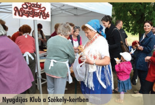
Nyugdíjas Klub a Székely-kertben