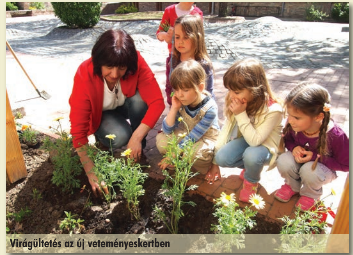
Virágültetés az új veteményeskertben

Május 8-án tettük meg az úgynevezett Székely túránkat. A központi oviból felkerekedett mind az öt csoport, és megemlékezvén Székely Bertalanról, virágot vittünk a sírjához. Ezt követően a Székely kertbe mentünk, ahol a Méhecskék bemutatták az ünnepségre készült műsorukat.