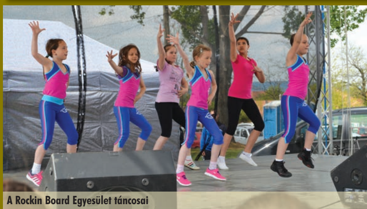
A Rockin Board Egyesület táncosai