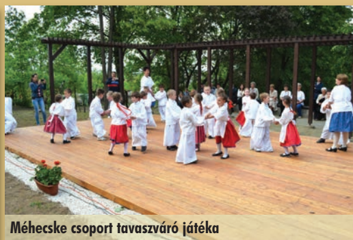
Méhecske csoport tavaszváró játéka