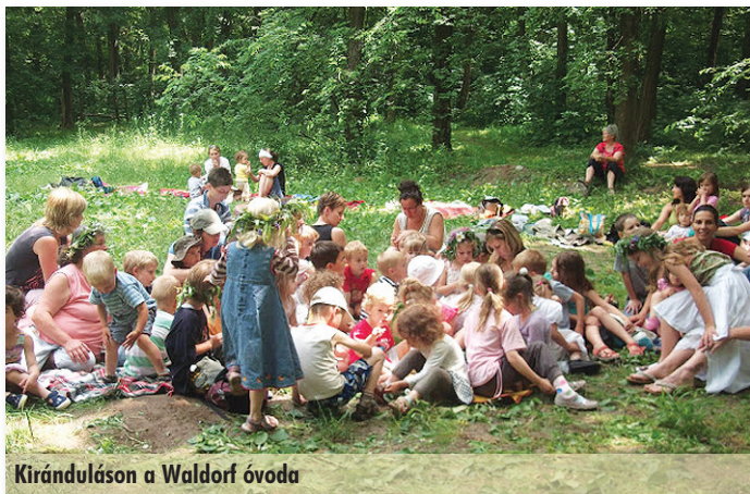
Kiránduláson a Waldorf óvoda

A húsvét utáni ötvenedik nap pünkösöd ünnepe. Ennek szimbóluma az óvodában a fehér gyapjúból készült galamb, melyet az ovisok röptetnek majd. Ez a tevékenység az „együtt” és „külön” erejét egyaránt megmutatja a gyerekeknek. Mindenkinek a maga erejéből, ügyességéből kell boldogulnia a madárka reptetésével, de látva a többieket, megélve a közös cselkvés élményét, a bátortalanabbak is erőt meríthetnek társaik példájából. A közösség ereje, mely a pünkösöd egyik üzenete is egyben, így jelenik meg ebben a tevékenységben. Végül, az összetartozás élményét az ovis családok közös kirándulással erősítik meg az időszak végén.