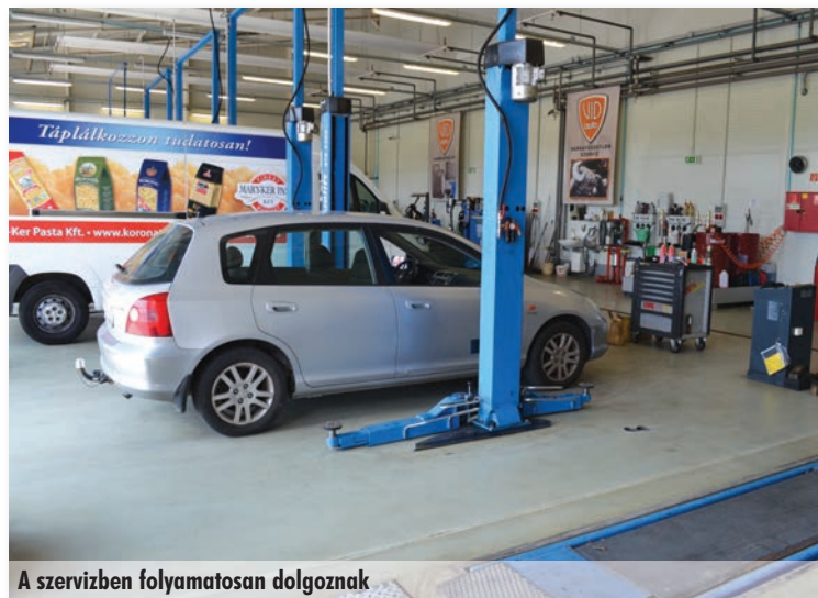
A szervizben folyamatosan dolgoznak

Jártam már olyan szervizben, ahol kortárs hazai művészek műalkotásait állították ki. Itt még nagyobb meglepetés ért. Szinte a szervizzel megegyező alapterületen egy fitness centrumot is üzemeltetnek, egy korszerű sportudvarral együtt. Ez hogyan került a szolgáltatások közé?