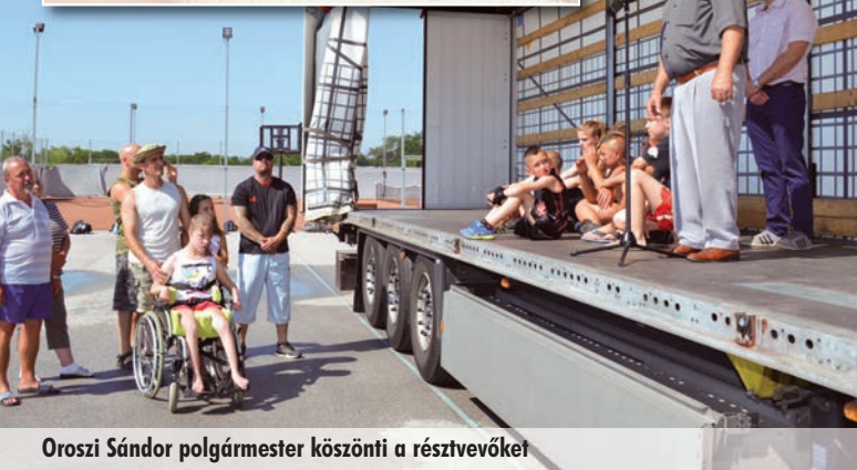
Oroszi Sándor polgármester köszönti a résztvevőket