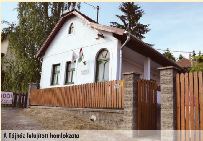
A Tájház felújított homlokzata

Az alapítvány a törvényi előírásoknak megfelelően 2014-ben módosította alapszabályát, ennek hivatalos bejegyzése áthúzódott 2015-re. A módosítás a működést, a tevékenységet nem érinti, így az a korábbiak szerint szolgálja településünk művelődését.