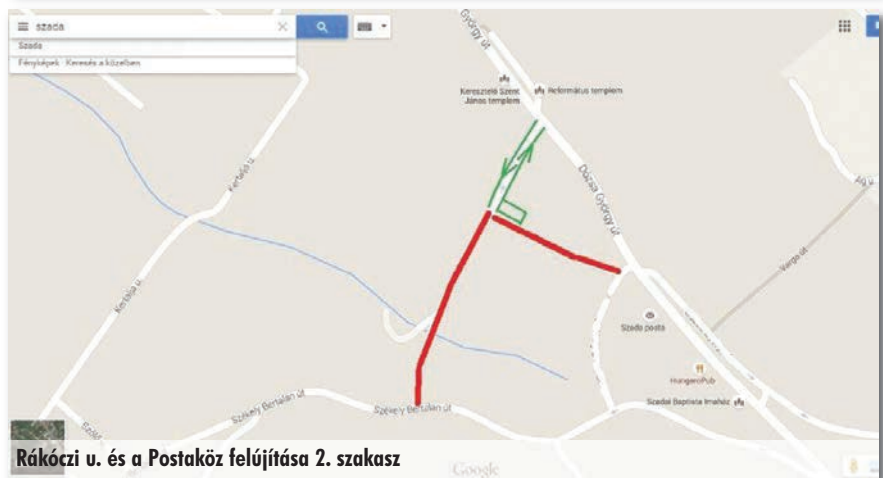
Rákóczi u. és a Postaköz felújítása 2. szakasz