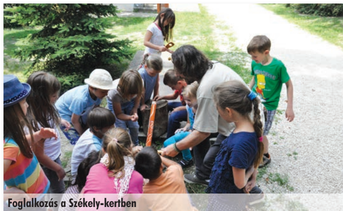
Foglalkozás a Székely-kertben

A „Mesterek táborát” június 22-től 26-ig rendezték meg 7-11 éves gyerekeknek. A napi programok összeállításánál a népi és iparművészeti kézművesség játszotta a főszerepet. Képzett szakemberek vezetésével meg lehetett tanulni a tűzzománc és a nemez készítés fortélyait, de volt ezen kívül szövés-fonás, varrás, kovácsolás, kosárfonás is. A gyerekek a foglalkozásokon kívül voltak strandon, kirándultak, a hét programjába belefért egy erdei akadályverseny is és sok játékos mozgás is.