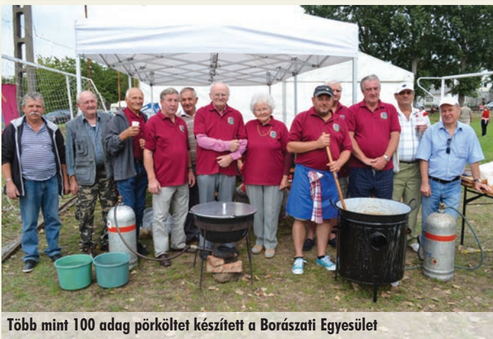
Több mint 100 adag pörköltet készített a Borászati Egyesület