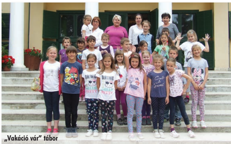
„Vakáció vár” tábor

Idén is két tábort szerveztek, az elsőt június 15-től 19-ig az 5-9 éves korosztálynak „Vakáció vár” címen. Egy hétig változatos program várta a kicsiket, volt erdei gyalogtúra, úszás - strandolás, kézművesség, számháború, akadályverseny játékos feladatokkal, mese-mozi, szerepjáték, íjászat, népi ügyességi játékok a szabadban és sárkánykészítés.