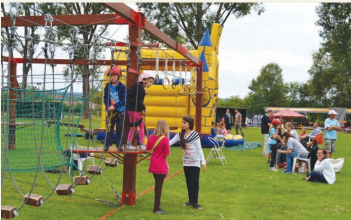
Az akadálypálya és az ugrálóvár ingyen volt