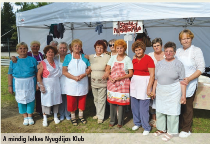
A mindig lelkes Nyugdíjas Klub