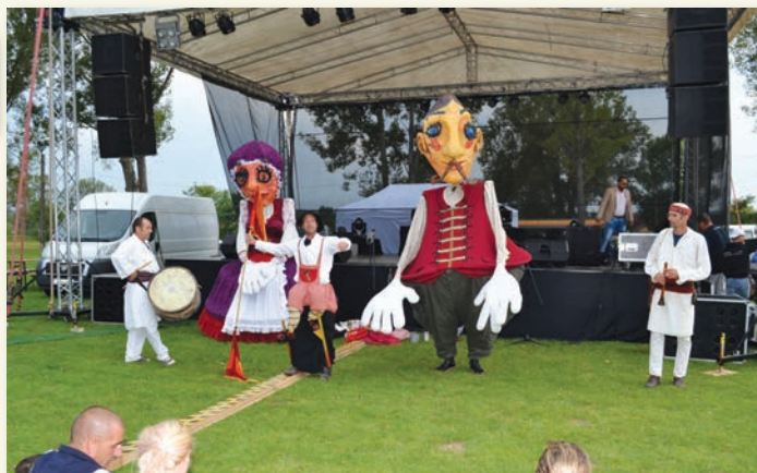
Bab Társulat óriásbábja