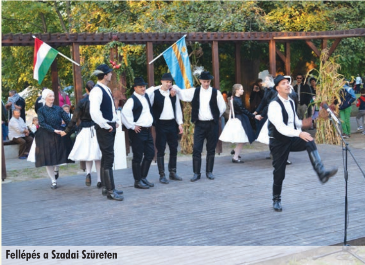
Fellépés a Szadai Szüreten