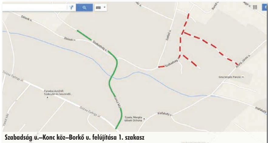
Szabadság u.–Koncz köz–Borkó u. felújítása 1. szakasz