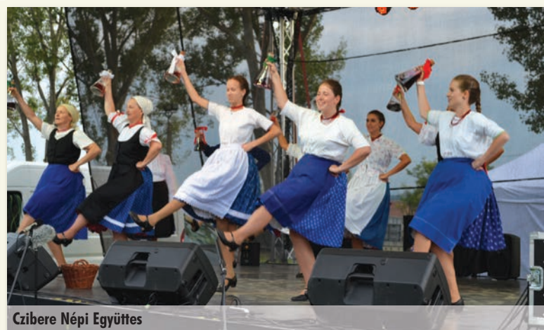
Czibere Népi Együttes