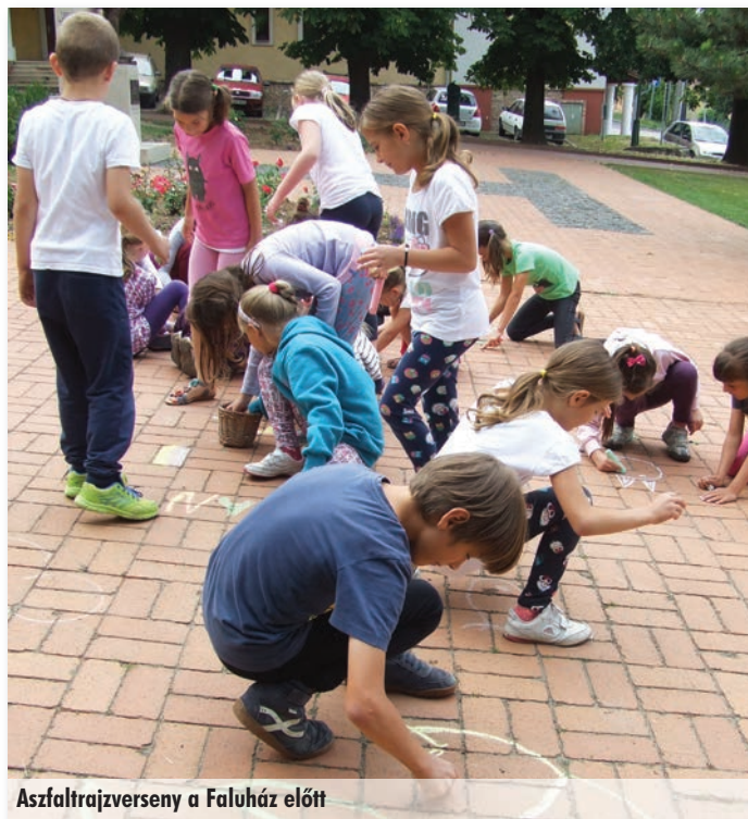
Aszfaltrajzverseny a Faluház előtt

A „Mesterek táborát” június 22-től 26-ig rendezték meg 7-11 éves gyerekeknek. A napi programok összeállításánál a népi és iparművészeti kézművesség játszotta a főszerepet. Képzett szakemberek vezetésével meg lehetett tanulni a tűzzománc és a nemez készítés fortélyait, de volt ezen kívül szövés-fonás, varrás, kovácsolás, kosárfonás is. A gyerekek a foglalkozásokon kívül voltak strandon, kirándultak, a hét programjába belefért egy erdei akadályverseny is és sok játékos mozgás is.