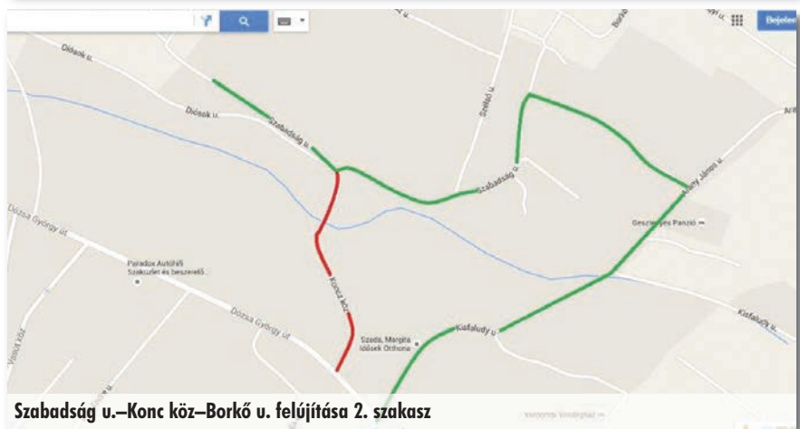
Szabadság u.–Koncz köz–Borkó u. felújítása 2. szakasz