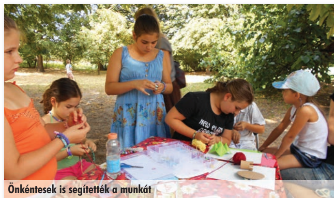
Önkéntesek is segítették a munkát

Célzottan törekszünk arra, hogy minél kisebb legyen a szülők tábori díj hozzájárulása. Ezt idén is úgy oldottuk meg, hogy költséges tízórai és uzsonna vásárlását nem terveztük. Köszönjük a lakossági adományokat! Soha nem fogyasztottuk magában a margarinos és házi zsíros barna kenyeret: zöldáru, gyümölcs, olajos mag és házi lekvár bőven volt minden tábori napon. Köszönjük a Szadán működő HUNGAROPUB pizzeria és fagyizó adományát is. A tábor három hetén minden táborozót és önkéntest megvendégeltünk egy-egy tölcsér fagyival, mintegy 140 adaggal.