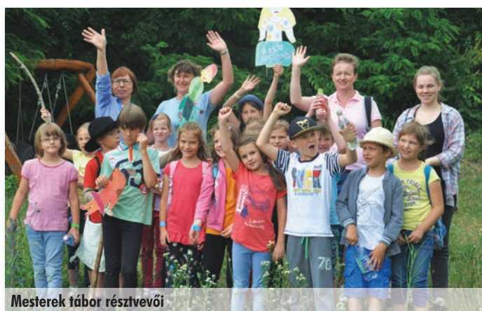
Mesterek tábor résztvevői

Mihály Dénes Szakképző Iskola Kistarcsán kedvező feltételekkel az alábbi iskolarendszeren kívüli képzéseket hirdeti meg szeptember 1-jétől