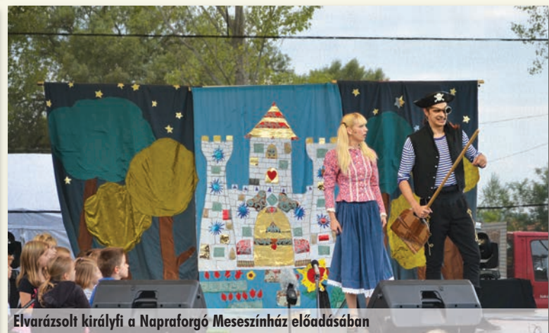
Elvarázsolt királyfi a Napraforgó Mesesínház előadásában