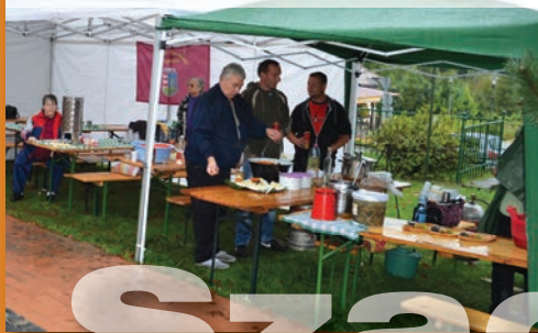
Az eső miatt csak 3 csapat nevezett a főzőversenyre