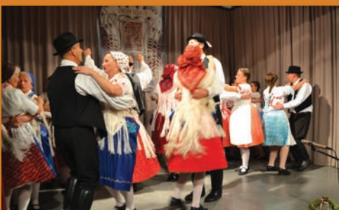
Galgamenti tánc a Szadai Népi Együttes előadásában