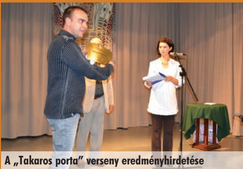
A „Takaros porta” verseny eredményhirdetése