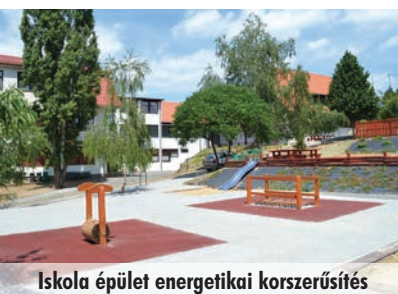
Iskola épület energetikai korszerűsítés