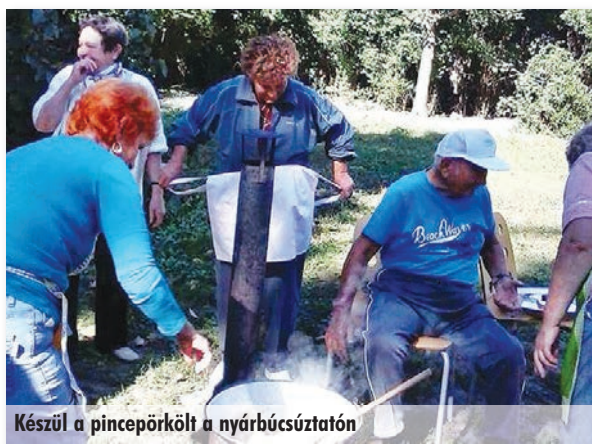
Készül a pincepörkölt a nyárbúcsúztatón