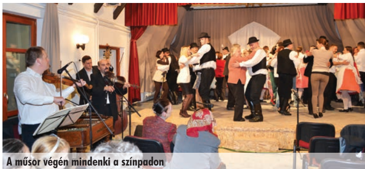
A műsor végén mindenki a színpadon