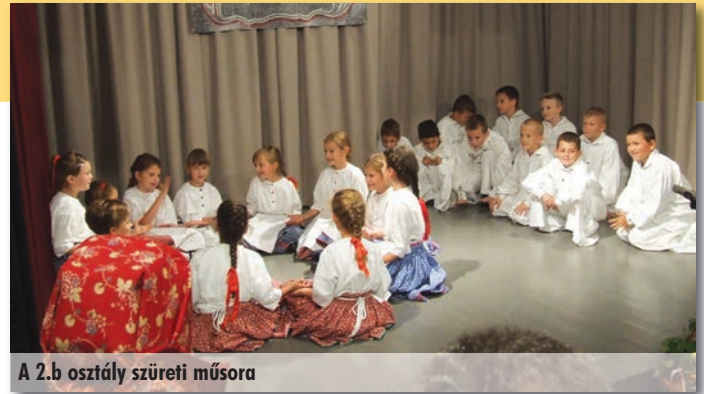
A 2.b osztály szüreti műsora