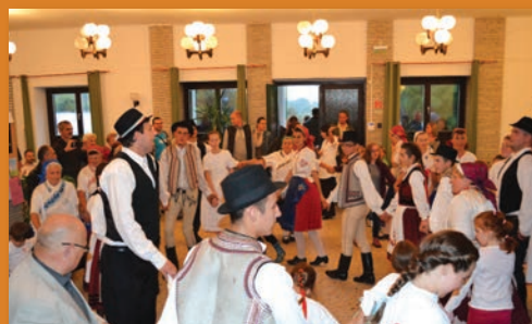
Tánczással zárult a műsor