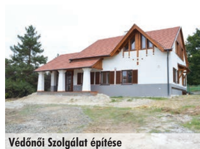
Védőnői Szolgálat építése