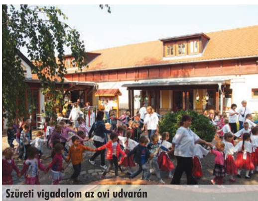
Szüreti vigadalom az ovi udvarán