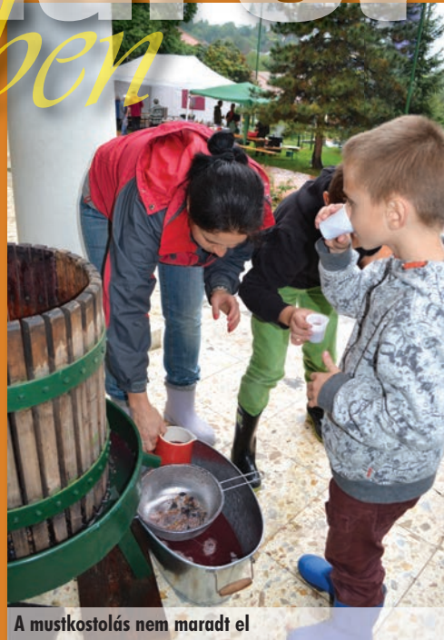
A mustkóstolás nem maradt el