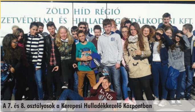
A 7. és 8. osztályosok a Kerepesi Hulladékkezelő Központban