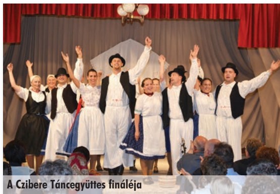
A Czibere Táncgyűttes fináléja