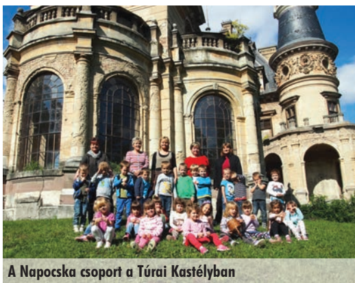
A Napocska csoport a Túrui Kastélyban