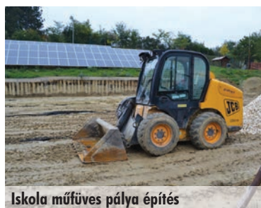
Iskola műfüves pálya építés