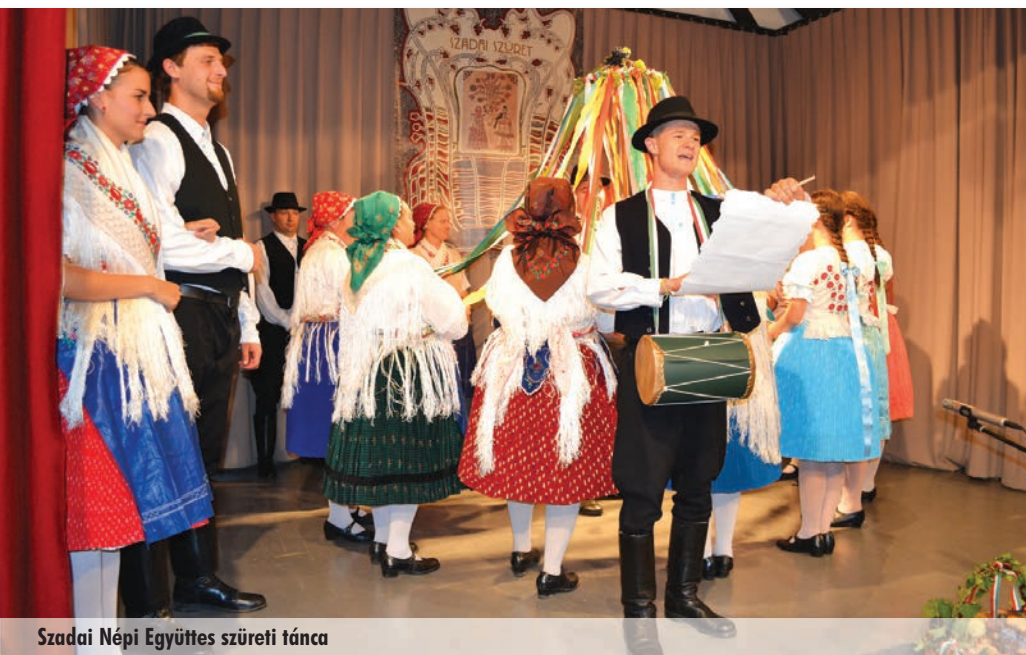
Szadai Népi Együttes szüreti tánca

A hét közepétől kitartóan szakadt az eső, ezért már szeptember 24-én csütörtökön a „B” terv lépett életbe, vagyis a Székely-kertbe meghirdetett programok nagy részét lemondták a szervezők, a szabadtéri színpadra tervezett műsort pedig bevitték a Faluházba. Természetesen a szüreti felvonulást is lefűjták.