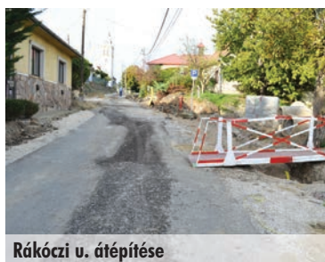
Rákóczi u. átépítése