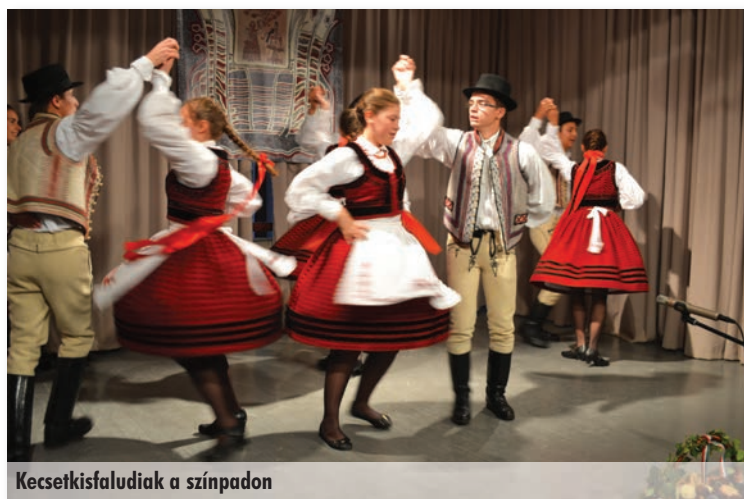
Kecsetkisfaludiak a színpadon