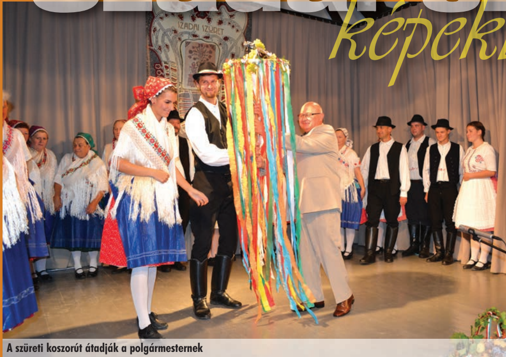
A szüreti koszorút átadják a polgármesternek