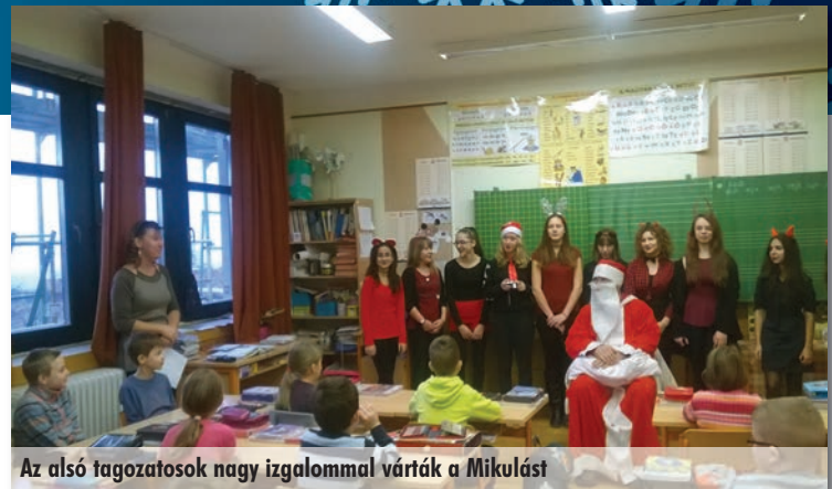
Az alsó tagozatosok nagy izgalommal várták a Mikulást

Télapó szeretettel hallgatott. Búcsúzáskor megígérte, ha jók lesznek a gyermekek, akkor ismét eljön iskolánkba.