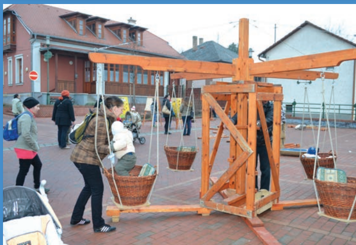
A gyerekeket népi játszótér várta