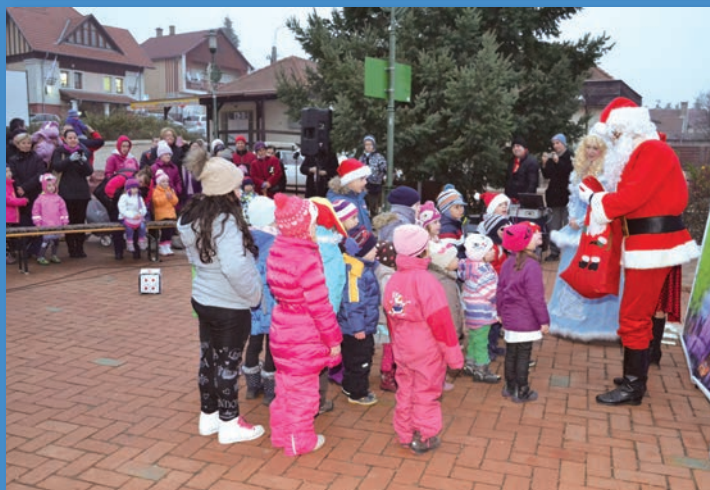
A bátrabbak előbb kaptak ajándékot