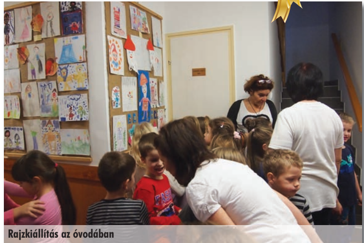
Rajzkiállítás az óvodában

A bál után, helyrehozván a széttáncolt cipellőket, megkezdődött a Fakopáncs játékvásár. Egy hétig az új óvodában, majd egy hétig a központi óviban válogathattak kedvükre az óvó nénik, és a szülők. A rengeteg fejlesztő játék közül nem volt könnyű kiválasztani, hogy melyiket is rendeljük meg a gyerekeknek. Köszönjük az anyukáknak, akik segítettek a rendelések összeállításában.