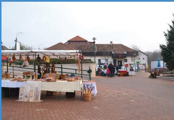
Kirakodóvásár a téren