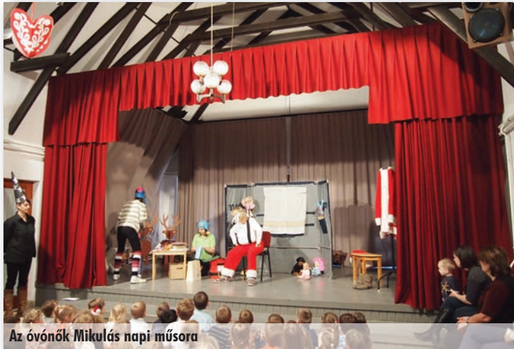
Az óvónők Mikulás napi műsora