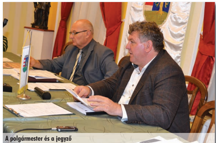
A polgármester és a jegyző