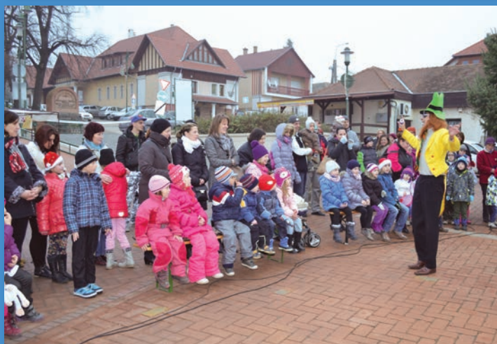
Napraforgó Színház előadása