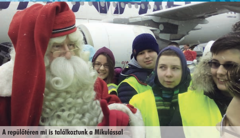
A repülőtéren mi is találkoztunk a Mikulással