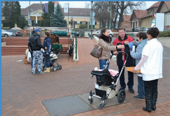
A COOP bolt dolgozói pogácsát és kakaót kínáltak