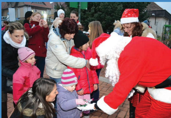
Én is, én is ... kérek Mikulás bácsi!