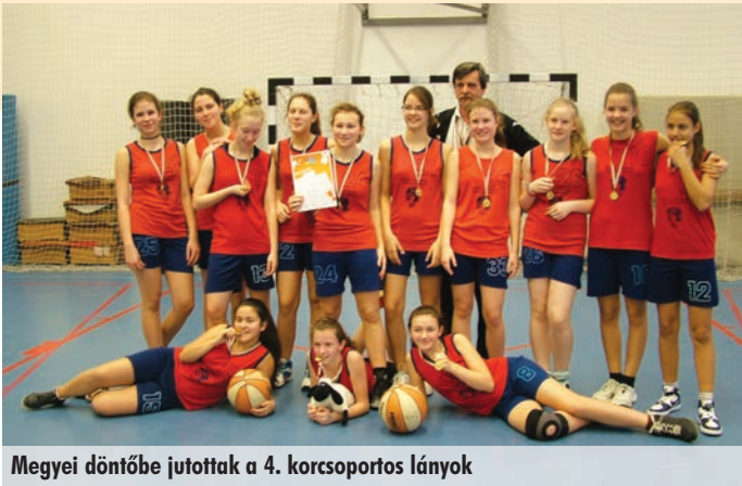
Megyei döntőbe jutottak a 4. korcsoportos lányok