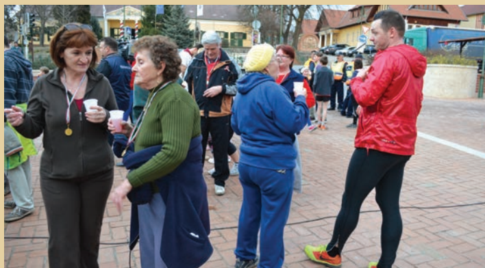
Az Idősek Nappali Klubja is indult