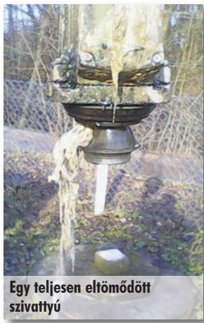
Egy teljesen eltömődött szivattyú

Oroszi Sándor polgármester közleményben kéri azokat a lakosokat, akik átemelő szivattyújuk közelében lagnak, hogy sokkal nagyobb gondot és figyelmet fordítsanak a környezetükre. Az utóbbi időben sok probléma fordult elő az Ady utcai és a Fenyvesligeti átemelőknél. Vízügyi szakemberek tájékoztatása szerint az ott élő lakosság olyan tárgyakat és eszközöket enged a csatornába, amik az átemelő szivattyúkat teljesen tönkreteszik. A kár mértéke egyes esetekben több millió forintra tehető. A kérdéses területen – az egyre gyakoribb dugulások miatt – a polgármesteri hivatal fontolóra vette szanckciók bevezetését, ugyanis az önkormányzat hosszútávon nem tudja