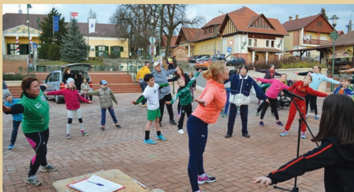
Bemelegítés nélkül nincs futás