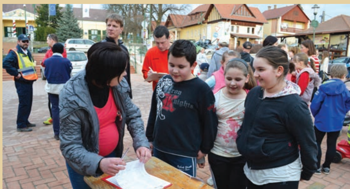
Neveznek az általános iskolások