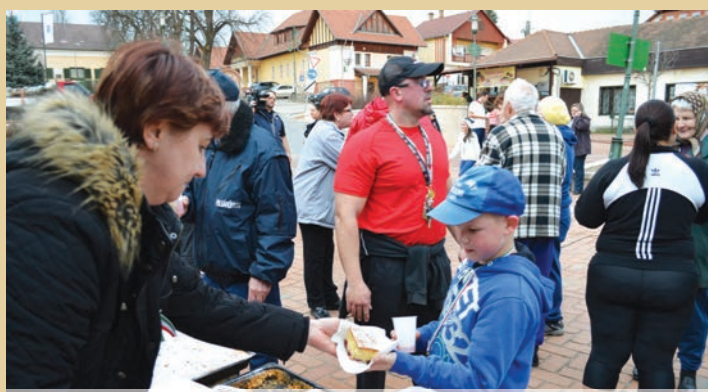
A célban étel, ital várta a futókat