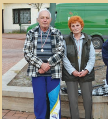
A legidősebb résztvevők