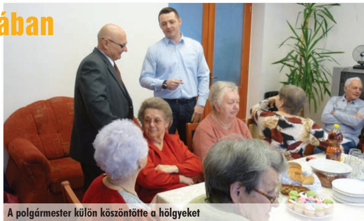
A polgármester külön köszöntötte a hölgyeket