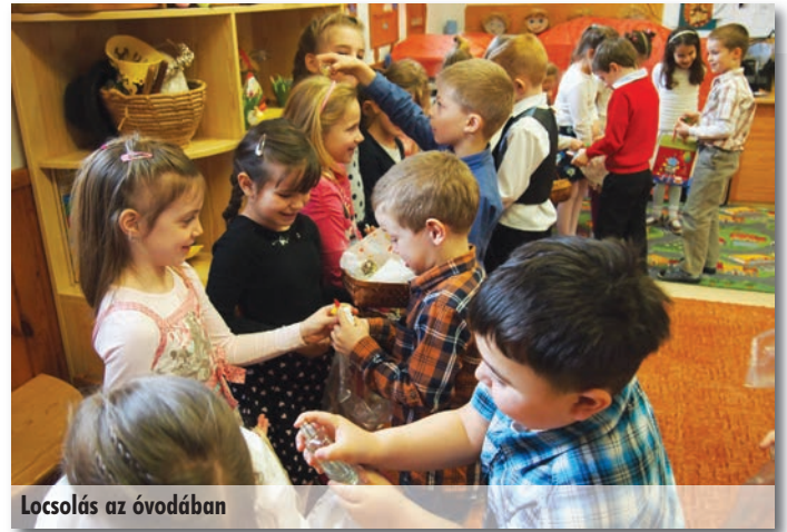
Locsolás az óvodában

Április 2-án megkezdődött a leendő ovisoknak szervezett óvodahívogató. Az első a tagóvodánkban, a második április 11-én a központi óvodánkban volt. Szép számmal érkeztek az érdeklődők, a picuruk betekintheztek egy kicsit az óvodai életbe, ismerkedhettek az óvónénikkel. Ebben a hónapban terveztük be a tavaszi udvarrendezést is, gen mondtuk, a társadalmi munkát. Szülői összefogással rendbe szedtük a csoportok játszótereit, közvetlen környezetünket. Fűvet nyírtunk, összegereblyéztük az elmúlt évszakok oda nem illő maradványait, leveleket, gallyakat. Úgyes, izmos apukák ástak, talicskázta, s mindent megmozgattak, amit mi gyenge óvónénik már nem tudtunk. Voltak akik családotól érkeztek, s dolgoztak. Mindez szom-