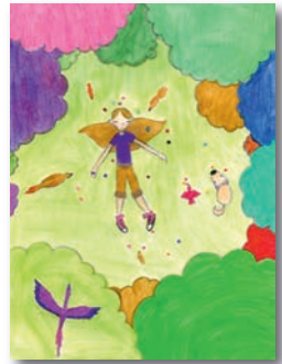
Illusztráció a meséhez

A következő hétvégén, amikor kirándulni mentem a szüleimmel elültettem a magokat. És nem sokkal ezután újabb üzenet várt. Ez állt benne: – Kedves Gréta! Mostantól büszkén viselheted a Smaragd tündér nevet. Tiszteletbeli levéltündérré fogadtunk. Azért meséltem el ezt nektek, hogy megbizonyítsam, nincsen lehetetlen!