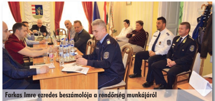
Farkas Imre ezredes beszámolója a rendőrség munkájáról

Az érvényes helyi építési szabályzat és szabályozási terv szerint ezt a beruházást most lehetne megvalósítani, mert az útba eső üres telket a tulajdonosa felajánlotta megvételre. A tervezett útnyitás a nagyközség belső közlekedési útvonalát bővítené és közmű összeköttetést tenne lehetővé. A képviselő-testület felhatalmazta a polgármestert az adásvételi szerződés elkészíttetésére.