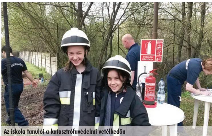
Az iskola tanulói a katasztrófavédelmi vetélkedőn