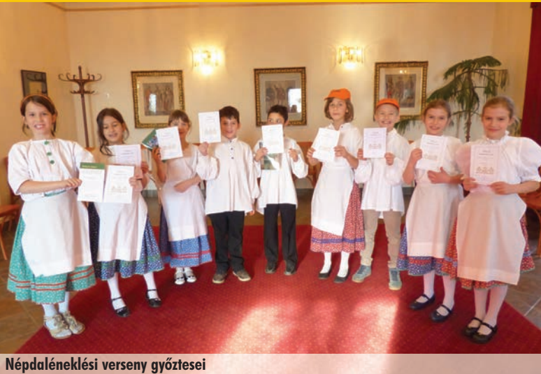
Népdaléneklési verseny győztesei