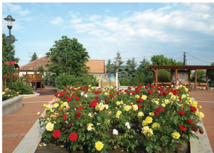
Az iskolások is helyi értéknek tartják a Főteret

„Az egész Szada nekem otthonos, itt mindenki kedves mindenkivel.”