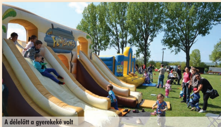
A délelőtt a gyerekeké volt