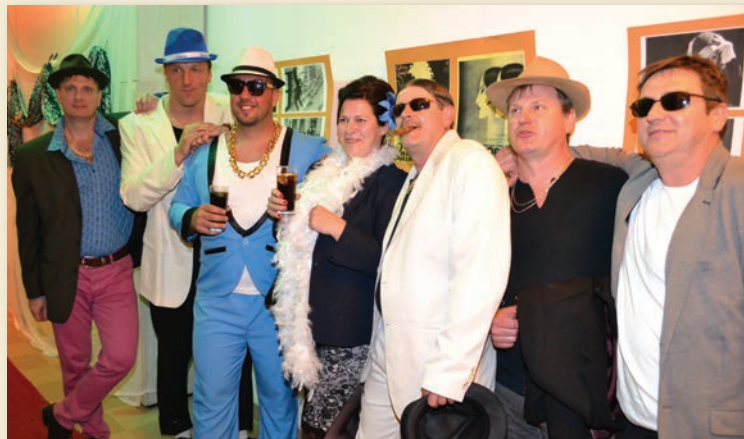
Az apukák fellépés előtt