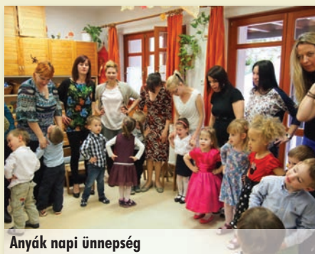
Anyák napi ünnepség