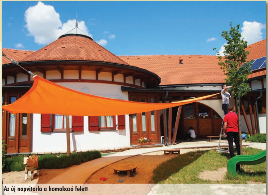
Az új napvitorla a homokozó felett

A nyugdíjas klub is felkért minket, hogy anyák napján köszöntsük őket. Ide a Mókusok vittek néhány köszöntőt. Mindeközben persze a csoportokban sem maradt el az anyukák szoros ölelése, a könnybe lábadt szemek törölgetése, az ajándékozás. Emellett néhány helyen az apukák is meg lettek tisztelve. A macik sportos mozgásra, a méhecskék egy közös játékba invitálták őket. A Katica csoportban rendhagyó módon ünnepeltük az édesanyákat és az édesapákat – mondta Kriszti néni. Az apukákkal kezdtük április 27-én. Őket szó szerint bevittük az erdőbe a Barkóca Erdészeti Társaság segítségével. A gödöllői Arborétumban állhattak az apukák csemetéikkel együtt különböző próbatételek elé. Érdekes, néha vicces feladatokat kellett együtt megol-