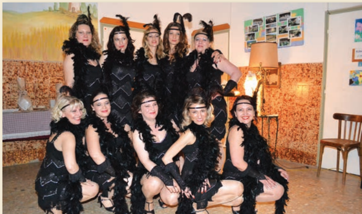
Az anyukák alkalmi táncsoportja