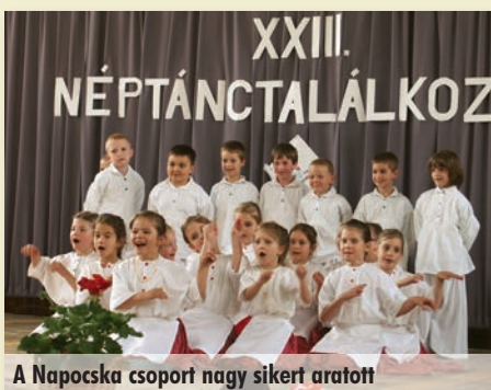
A Napocska csoport nagy sikert aratott