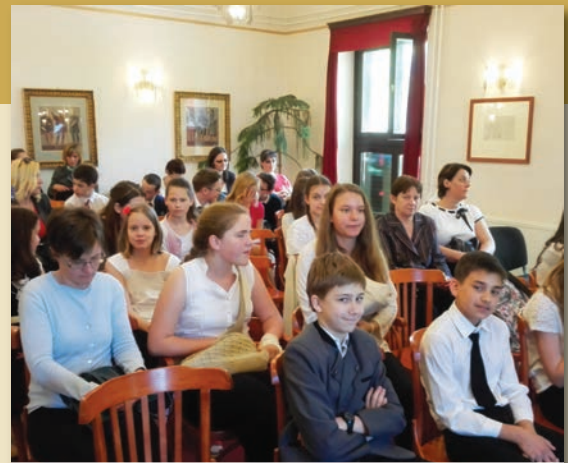
Vers és prózámódo verseny a Faluházban