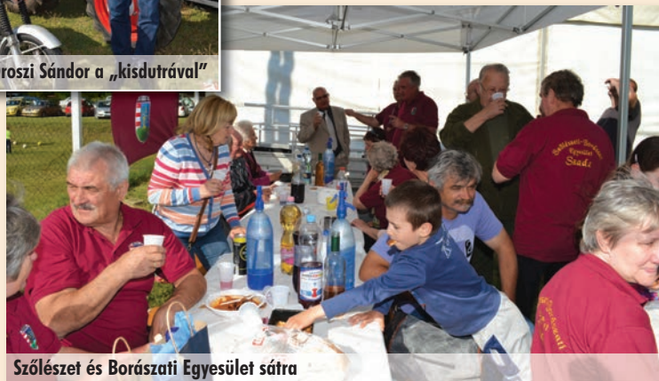
Szólészet és Borászati Egyesület sátra