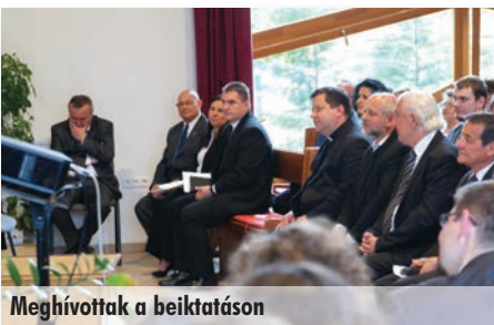
Meghívottak a beiktatáson

Műsorunk címe: Jogvita és egyezség A premier adás megtekinthető az ECHO TV-ben 2016. február 15-től kéthetenként hétfőn, 22 óra 30 perckor a Híradó után, továbbá a délelőtti ismétlés ugyanazon a héten szombaton 11 óra 30 perckor és a következő héten csütörtökön 11 órakor látható.