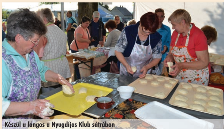
Készül a lángos a Nyugdíjas Klub sátrában