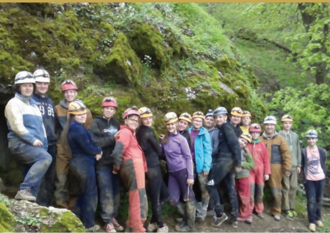
A túraszakkörösök a Solymári-ördöglyuk barlangnál