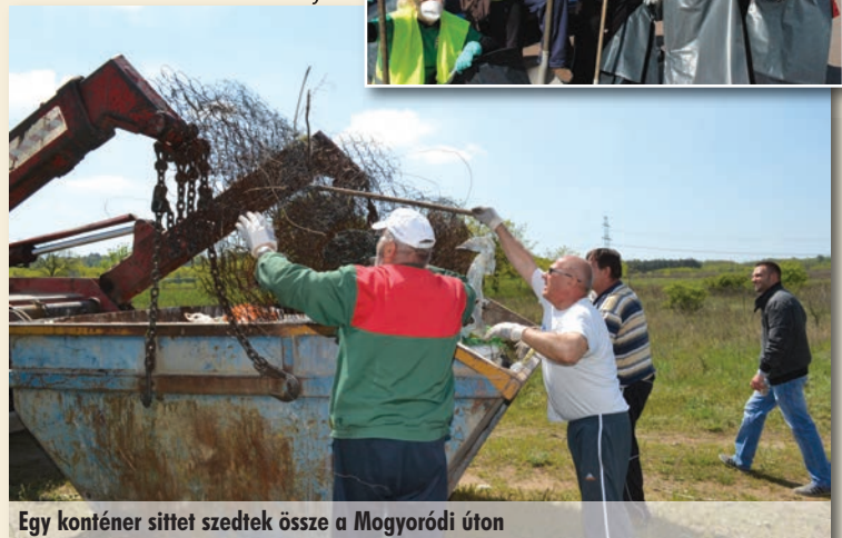
Egy konténer sittel szedték össze a Mogyoródi úton