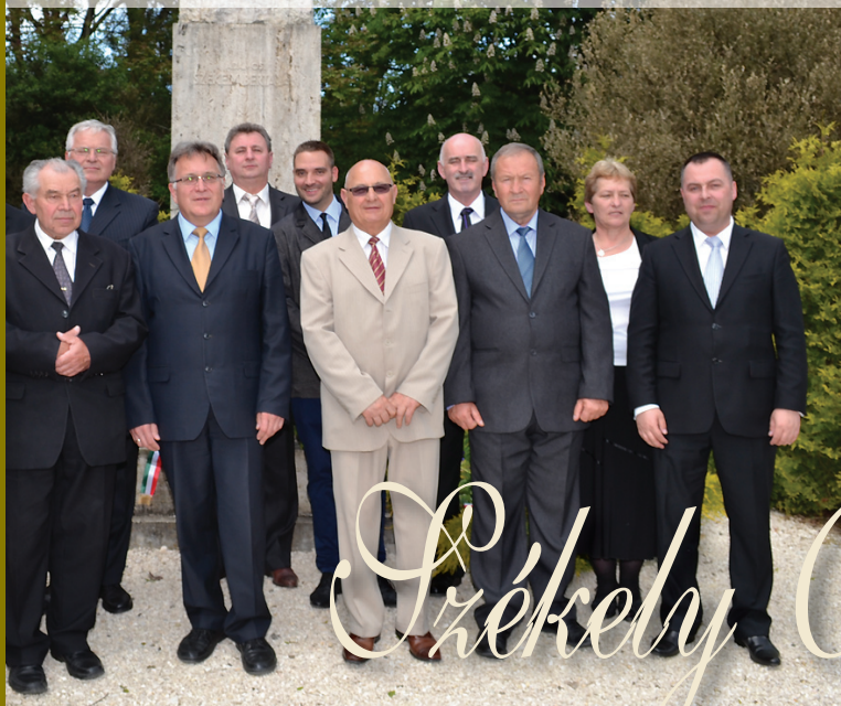
A nagydobronyi küldöttség és Szada képviselő-festülete