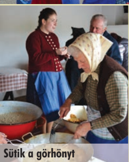
Sütik a görhönyt