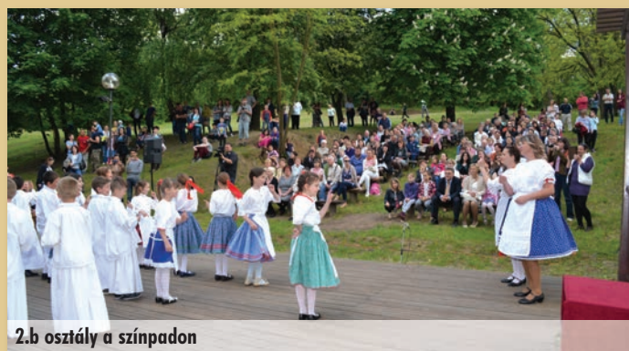
2.b osztály a színpadon