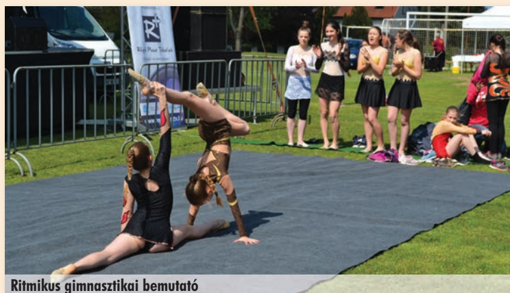
Ritmikus gimnasztikai bemutató