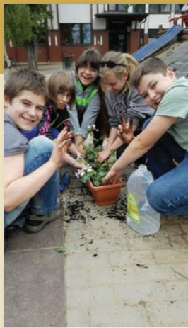
Muskátlit ültet a 6.a osztály