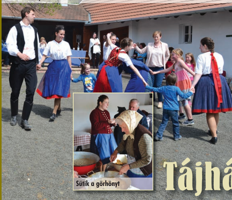
Táncház a Tájház udvarán