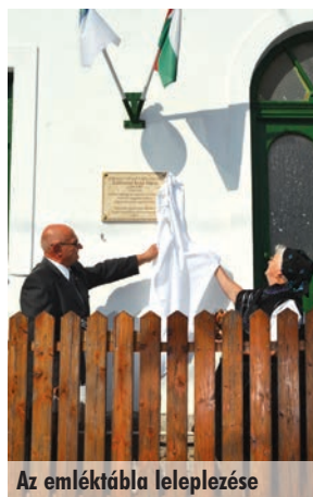
Az emléktábla leleplezése