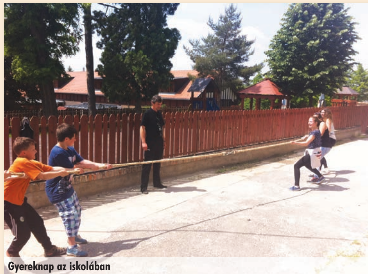
Gyereknap az iskolában

Simándy József Általános Iskola épületében, 2143 Kistarcsa, Ifjúság tér 3., II. emelet Tel.: 06-70-933-6307 www.mdiskola.hu e-mail: kistarcsa@mdiskola.hu