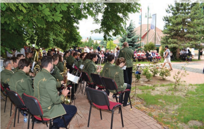
A térenét a Gödöllői Fúvószenekar szolgáltatta