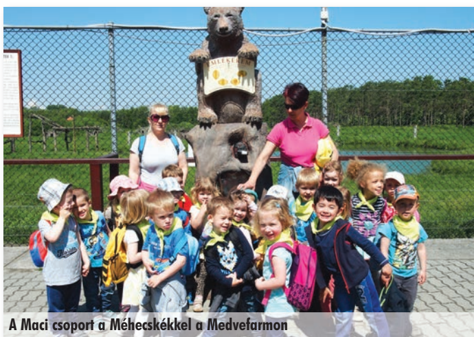
A Maci csoport a Méhecskékkal a Medvefarmon

Június 1-jén lezajlott az utolsó Bozsik torna is. A kis focisták gyűjtetik az új erőt szeptemberre.