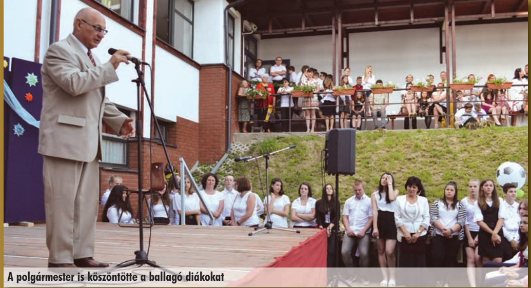
A polgármester is köszöntötte a ballagó diákokat