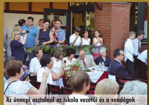
Az ünnepi asztalnál az iskola vezetői és a vendégek