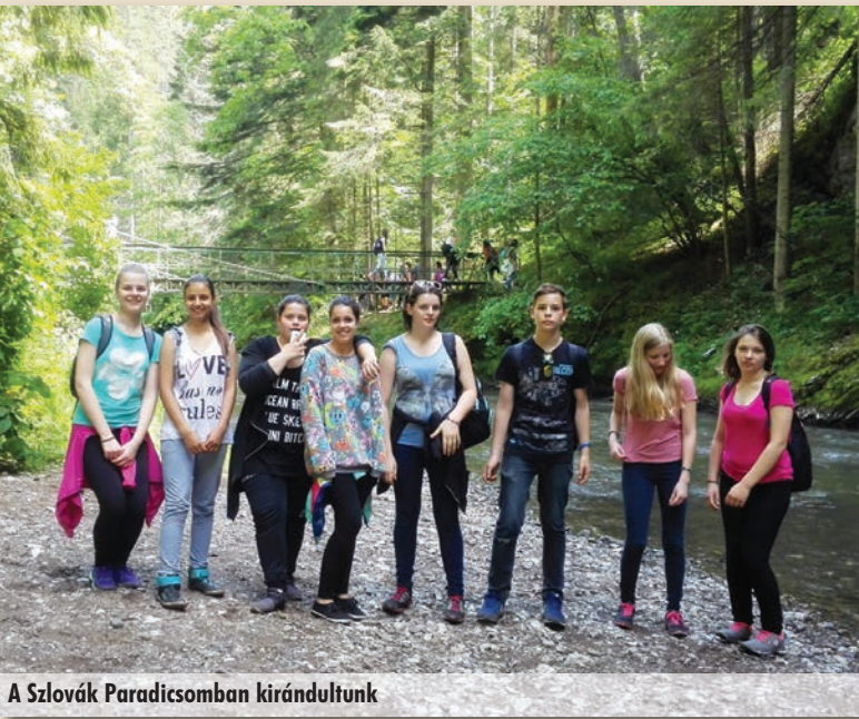
A Szlovák Paradicsomban kirándultunk

érkezve a távolban feltűnő Kárpátok vonulata volt. Fáradtan és sajnos ázottan értünk vissza a 17 km-es túra után a buszhoz, és elindultunk Várhosszúrétre, második szállásunkra.