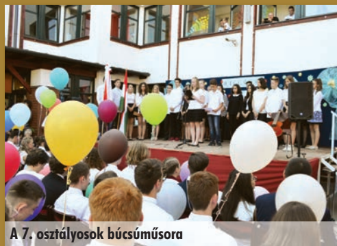
A 7. osztályosok búcsúműsora