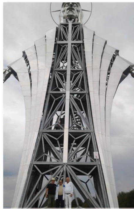
Jézus szíve kilátó Kecset-Kisfalud határában

A szadai küldöttség a kétnapos rendezvényen megismerhette a házigazda települések és a testvértelepülések újonnan megválasztott vezetőit is, volt alkalmuk országgyűlési képviselőkkel és államtitkárokkal is találkozniuk. A kecsset-kisfaludiak vasárnap még egy kirándulást is szerveztek a falu fölött emelkedő 953 m magas Gordon-hegyre, amelynek gerincén 2013-ban szentelték fel a Meg-