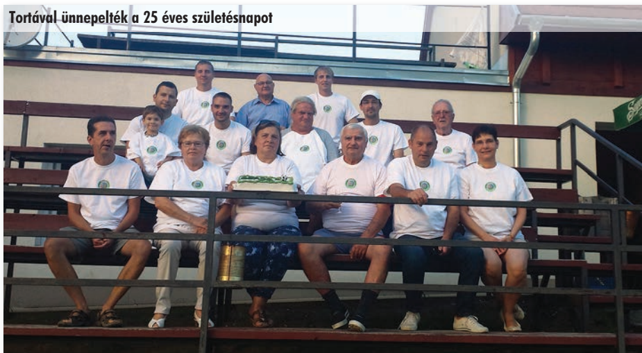
Tortával ünnepelték a 25 éves születésnapot

2016. 10. 02. 15:00 GSK II-Szada-Vácszentlászló SE 2016. 10. 16. 14:00 GSK II-Szada-Kisalag SC 2016. 11. 06. 13:30 GSK II-Szada-Mogyoród FC II. 2016. 11. 27. 13:00 GSK II-Szada-SK Tóalmás