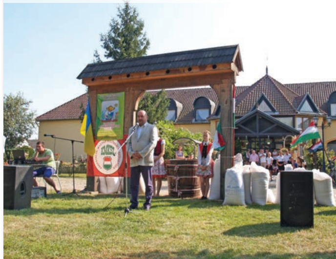
A búza összeöntésének helyszíne

Az összegyűjtött búzát az egyházi fenntartású intézményeknek – gyermekotthonoknak, líceumoknak – adományozták.