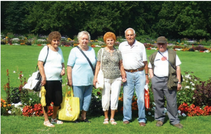
Jól éreztük magunkat a Margit-szigeten

A kirándulás időpontjában kellemes nyári napra ébredtünk, így lelkes kis csapatunk nagyon jó kedvvel indult el úti célunk felé. A szigetre érve először a japánkertet és a zenélő kútát néztük meg. E két nevezetesség rövid története. Az 1936 óta a Margitsziget északi részén található zenélő kút az eredetileg Marosvásárhely főterén 1820 és 1822 között felépített Bodor-kút másolata. A kút Bodor Péter székely ezermesterről kapta a nevét. A hamar népszerűvé vált kút a második világháborúban súlyosan megsérült, csak 1954-ben állították helyre Pfannl Egon építész tervei alapján. A zenélő szerkezetet az 1997-ben elvégzett újabb rekonstrukció után tették működőképessé, amit 2014-ben felújítottak a vele szomszédos japánkerttel együtt. A szökőkút reggel 10 órától kezdve minden órában legalább két számot játszik el, este 6-kor és 9-kor pedig az egész repertoárját bemutatja. A japánkertben számos növényritkaság található. Szívet és szemet gyönyörködtetőek a különleges növények.