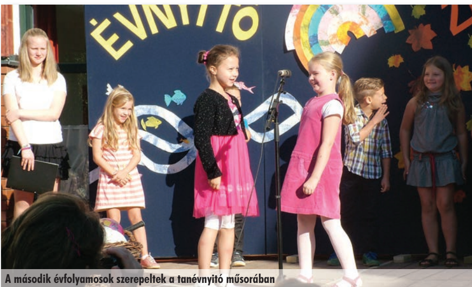
A második évfolyamosok szerepeltek a tanévnyitói műsorában