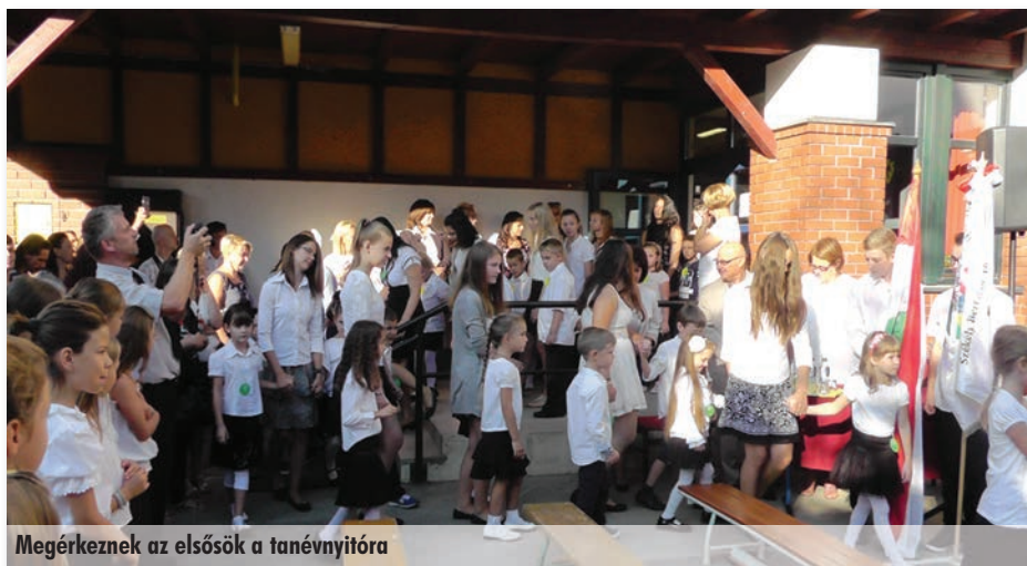
Megérkeznek az elsősök a tanévnyitóra

Szada Nagyközség Önkormányzata 2 és fél millió Ft-ot biztosított a nyári felújítási munkákra. Ebből 900.000 Ft értékben festettünk, egy osztálynyi tanulószéket vásároltunk, és a hozzá tartozó tanulóasztalokhoz új fedlapokat készítettünk, folytattuk a kosárlabdapályát védő kerítés építését, felújítottuk az iskola tolókapuját és elkészítettük a tolókapu melletti kerítést, a bejáratnál