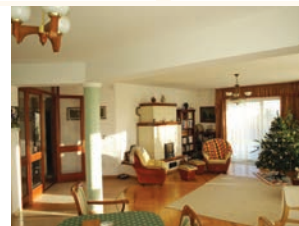
Szadán 3000 m 2 -es telken bruttó 350 m 2 -es családi ház 64,8 millió Ft.

www.szadaingatlan.hu Telefon: 06-20/503-2018