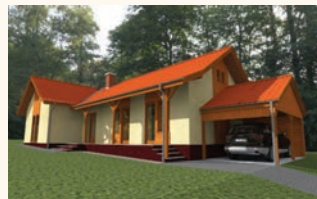
Szadán összközműves építési telkek , érvényes tervrajzzal, építési engedéllyel! 6,5 millió Ft.