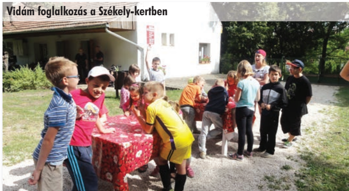
Vidám foglalkozás a Székely-kertben

zőket. Továbbra is várjuk az önkéntes munkatársak jelentkezését a nyári táborba és a biciklitúrákra is.