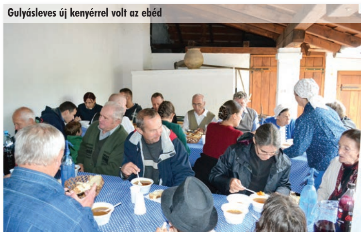
Gulyásleves új kenyérral volt az ebéd