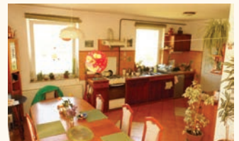
Szadán 1500 m 2 -es telken bruttó 426 m 2 -es családi ház 46 millió Ft.