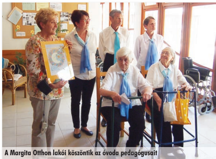
A Margita Otthon lakói köszöntik az óvoda pedagógusait

Az elmúlt időszakban egyre több alkalommal látogattunk el az óvodásokkal az idős embereknek otthonául szolgáló épület falai közé.