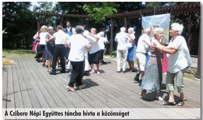
A Czibere Népi Együttes táncba hívta a közönséget