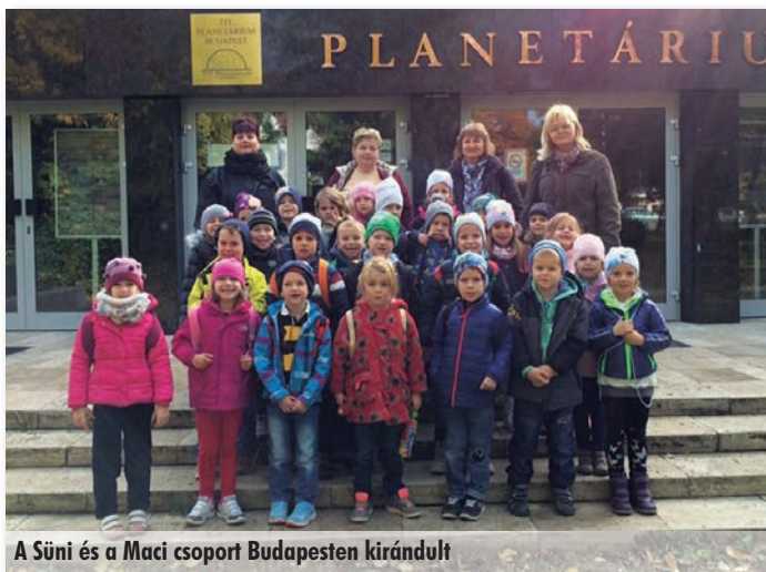
A Süni és a Maci csoport Budapesten kirándult

Október 18-án a nagyobbacska ovisok a Mirkó királyfi című bábelőadást nézték meg. A nagy bábok némely gyerekeknek ijesztőek voltak, de ha fél szemmel is, végignézték. Az egyik kisfiú az előadás után így