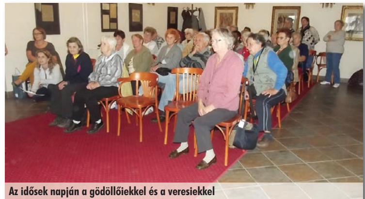
Az idősek napján a gödöllőiekkel és a veresiekkel