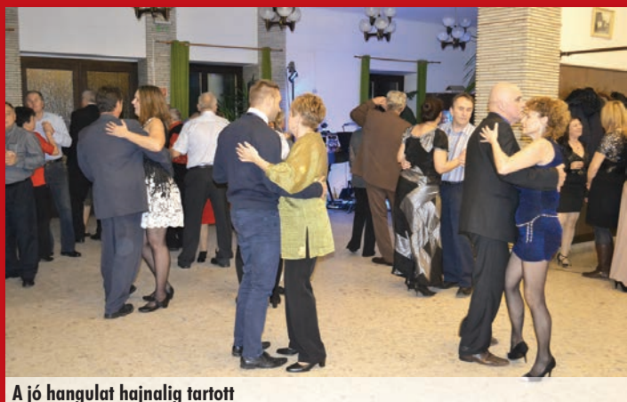
A jó hangulat hajnalig tartott