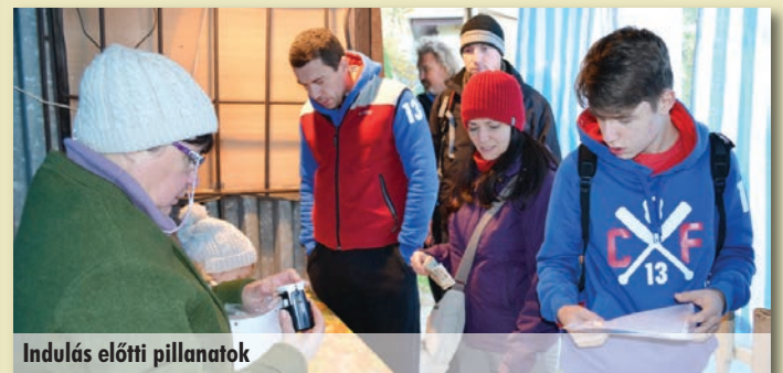
Indulás előtti pillanatok

Az útvonal kijelölésében és a pecsétpontokon a Szadai Természetjáró Szakosztály lelkes tagjai és segítői működtek közre.