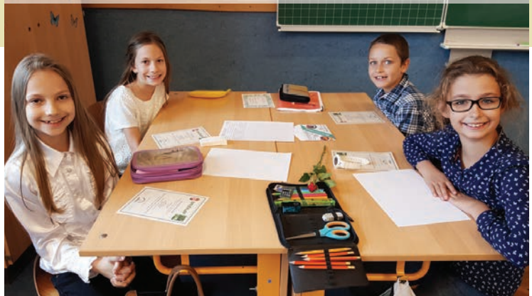
A legeredményesebb matematikus versenyzőink az Észfogatók (3. osztály)