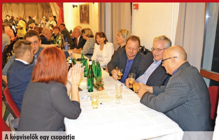
A képviselők egy csoportja