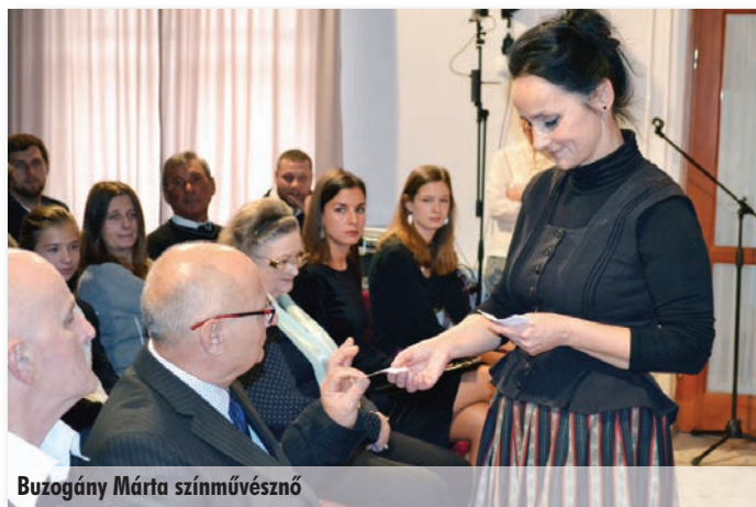
Buzogány Márta színművésznő