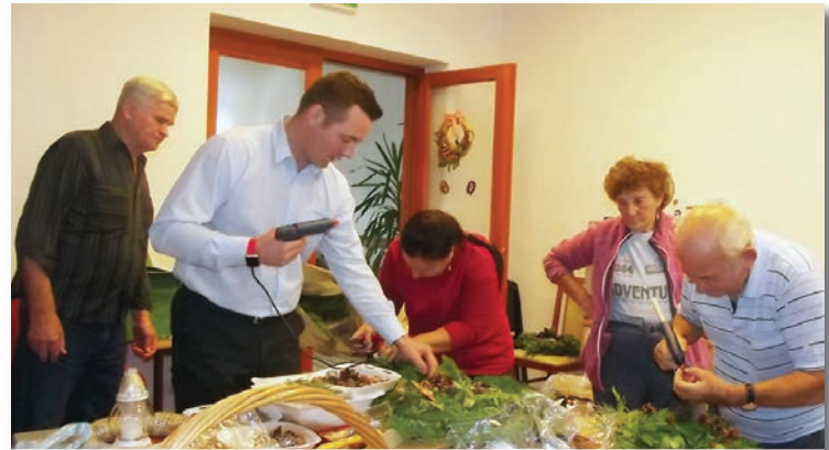
A koszorúk készítésébe beszállt az intézmény vezetője is