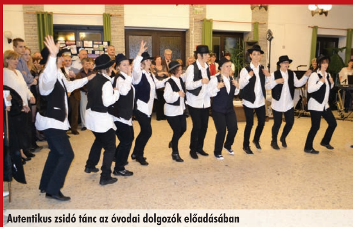
Autentikus zsidó tánc az óvodai dolgozók előadásában