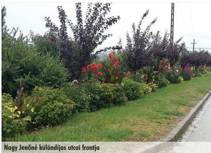
Nagy Jenőné különdíjas utcai frontja