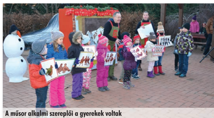
A műsor alkalmi szereplői a gyerekek voltak