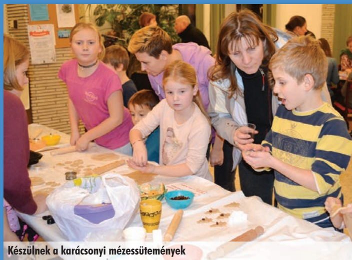
Készülnek a karácsonyi mézessütemények