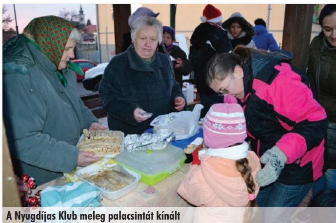
A Nyugdíjas Klub meleg palacsintát kínál