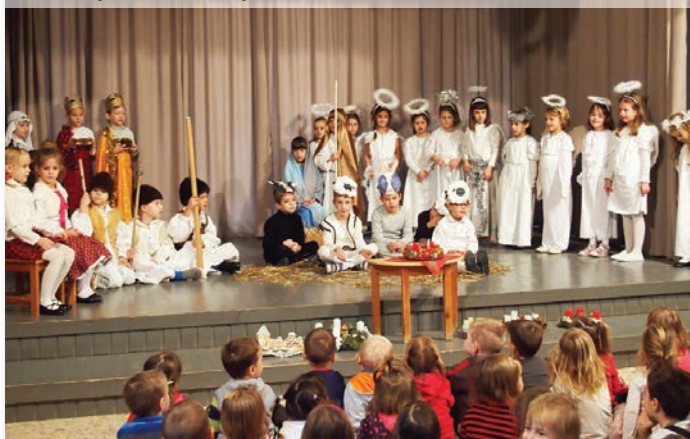
A Süni csoport betlehemes játéka