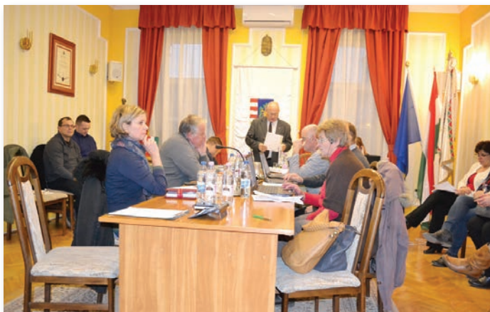
A polgármester új napirendeket terjesztett elő