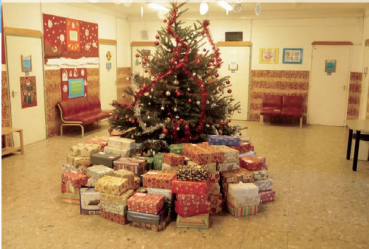
A karácsonyfát az iskola aulájában állították fel