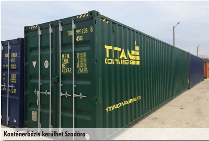
Konténerbázis kerülhet Szadára

töttek, hogy az önkormányzat a kivitelezéshez szükséges tervdokumentáció összeállításához, továbbá a teljes körű projekt lebonyolításához és generál kivitelezéséhez három árajánlatot kér.