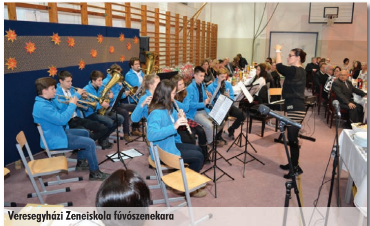
Veregyházi Zeneiskola fúvószenekara