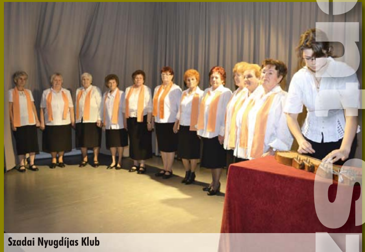
Szadai Nyugdíjas Klub