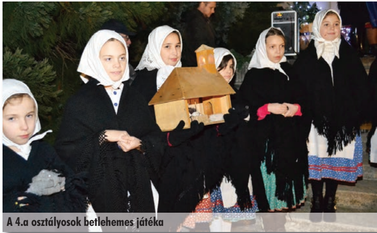
A 4.a osztályosok betlehemes játéka