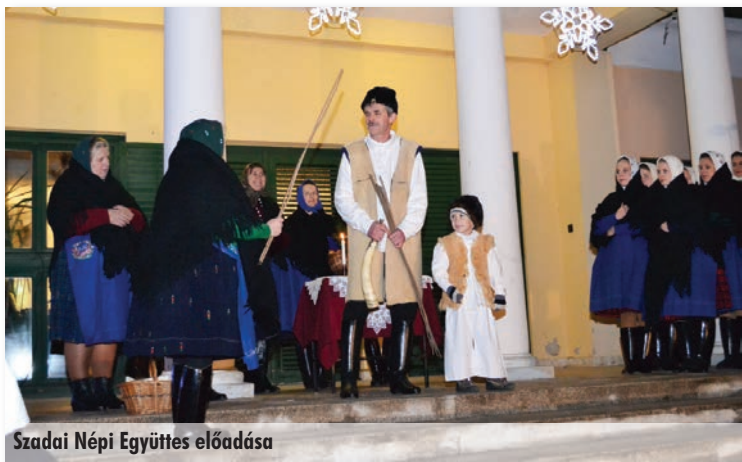
Szadai Népi Együttes előadása