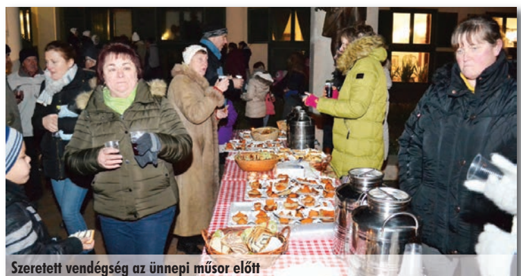
Szeretett vendégség az ünnepi műsor előtt