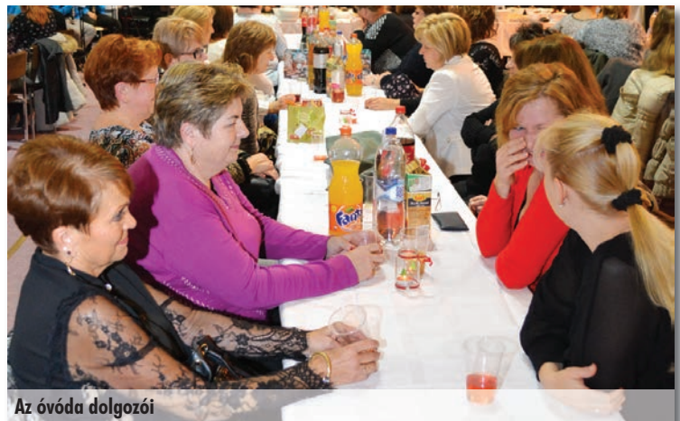
Az óvoda dolgozói