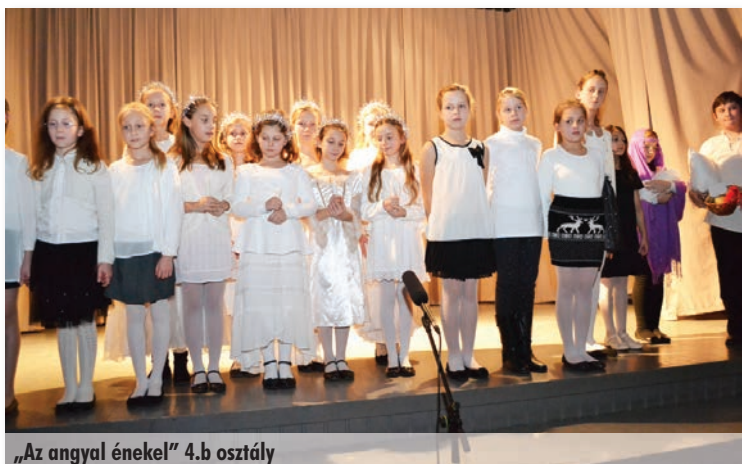
„Az angyal énekel” 4.b osztály