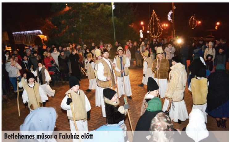
Betlehemes műsor a Faluház előtt