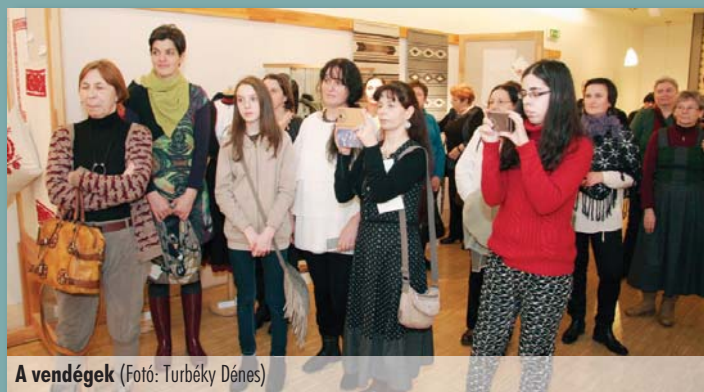
A vendégek