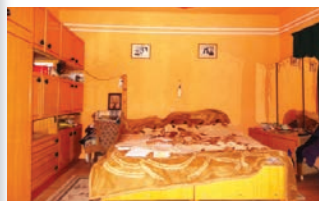
Központ közelében 2 generációs családi ház , 26 millió Ft