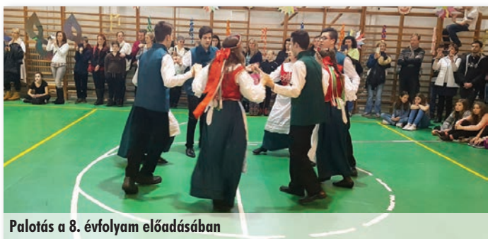
Palotás a 8. évfolyam előadásában