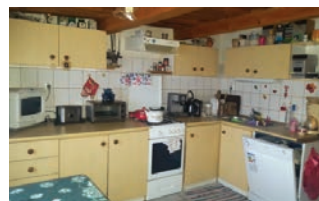
Központ közelében 1,5 szobás családi ház , 16,9 millió Ft