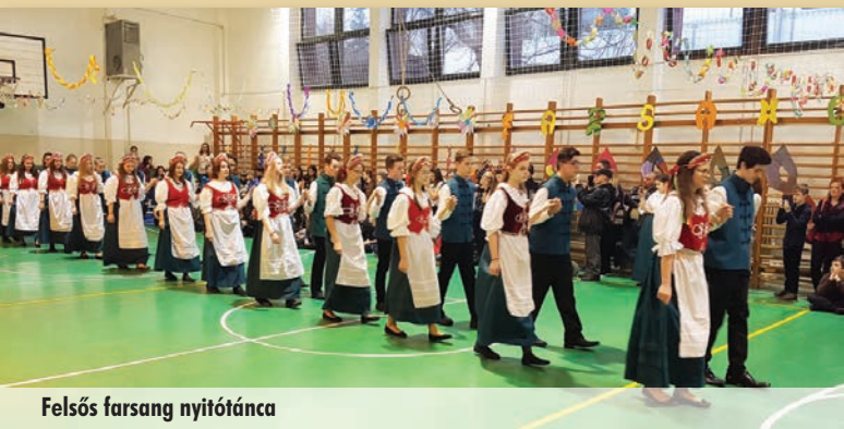
Felsőfős farsang nyitótánc