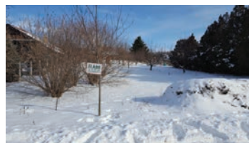
Margitán 1351 m 2 -es építési telek , 10,9 millió Ft

www.szadaingatlan.hu Telefon: 06-20/503-2018