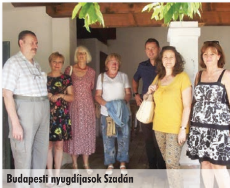
Budapesti nyugdíjasok Szadán