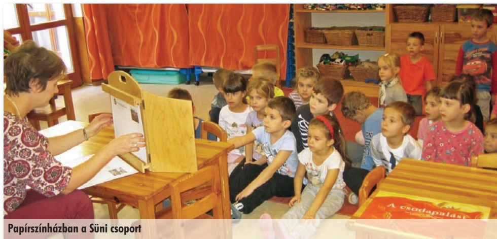
Papírszínházban a Süni csoport

További tájékozódási pont lehet a www.gyermekirodalom.hu oldalán elérhető Gyermek- és ifjúsági könyvszemle Top 50 és Top 25-ös listája, amelyet szakértő szűri állított össze a 2016-ban megjelent gyermekirodalomból. Jó olvasást kívánunk!