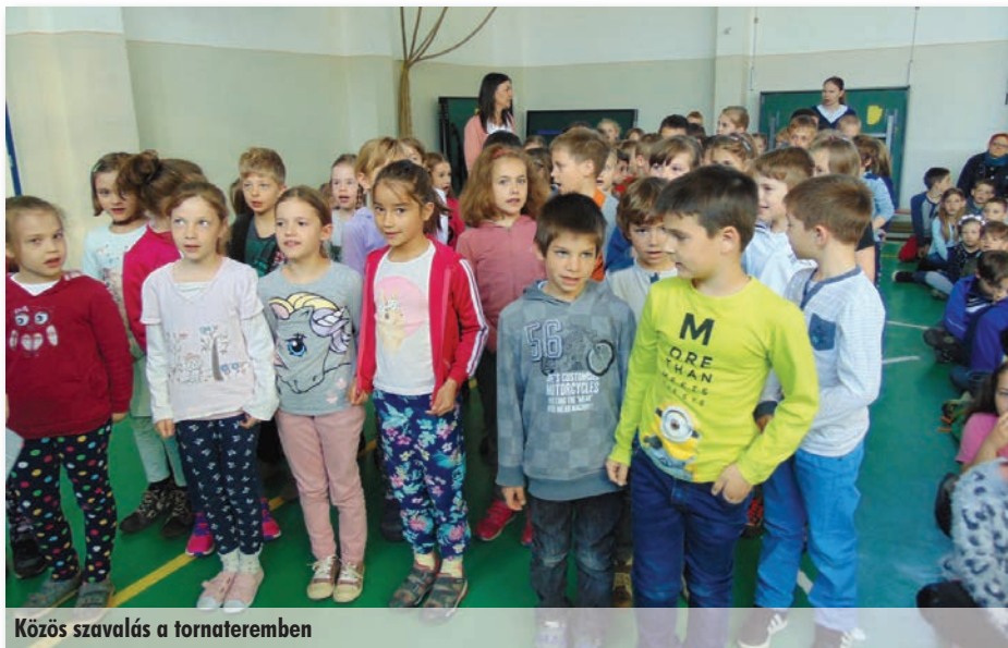
Közös szavalás a tornateremben

József Attila születésnapján, április 11-én emlékezünk a magyar költészet napjáról. Idén rendhagyó módon, Arany Jánosra és munkásságára fordítottuk a hangsúlyt, hi-