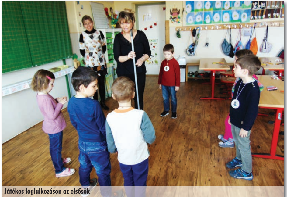
Játékos foglalkozáson az elsősek

Ezt követően, a program zárásaként április 5-én szerdán vártuk a szülőket az iskolába, amikor a