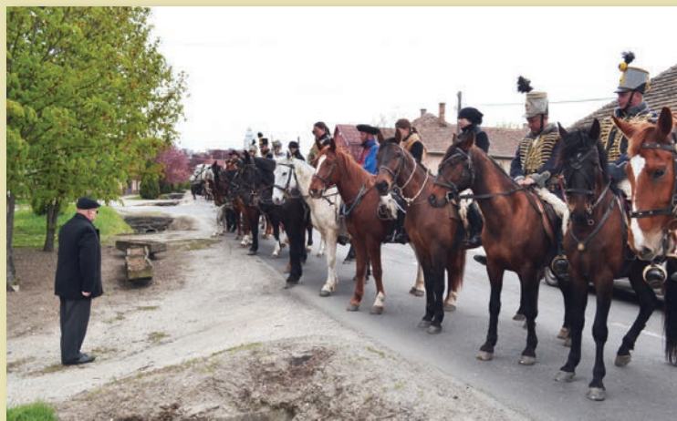
A tisztelgést a Damjanich emlékműnél a polgármester fogadta

A Történelmi Lovas Egyesület által alapított, Közép-Európa legjelentősebb katonai hagyományőrző rendezvénysorozata a Tavaszi Emlékhadjárat 2017. március 25. és május 21. között anyaországbeli és felvidéki események sorozatával emlékezik meg a dicsőséges tavaszi hadjáratról. Az 1848–49-es