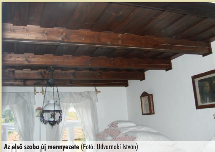
Az első szoba új mennyezete