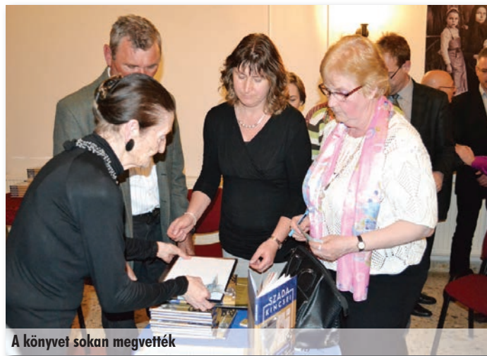
A könyvet sokan megvették