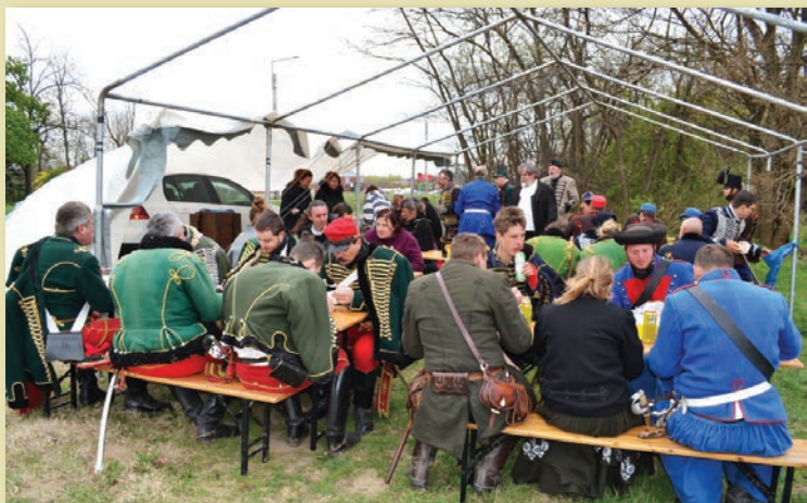
Ebéd a Dobogón