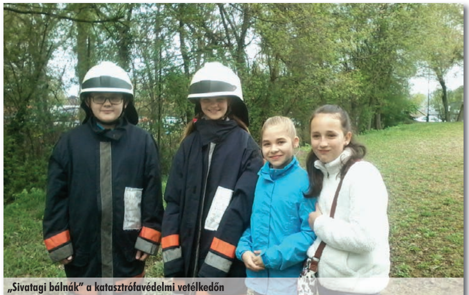
„Sivatagi bálnák” a katasztrófavédelmi vetélkedőn

Iskolánkat ebben a tanévben 2–6. osztályos diákok (19 fő) képviselték. A résztvevők nagy része most mérettette meg magát először iskolán kívüli matematika versenyen. Heteken át lelkesen készültek, ismerkedtek az elmúlt évek feladatsoraival, és az izgalom csak