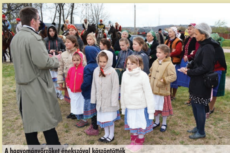
A hagyományőröket énekszóval köszöntötték