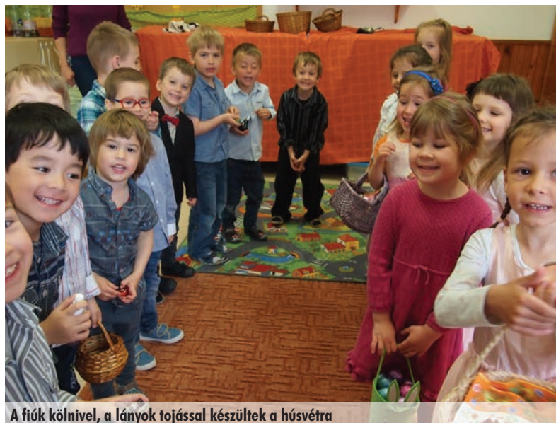
A fiúk kölnivel, a lányok tojással készültek a húsvétra

Április 8-ra jó időt kértünk, ugyanis az elmaradhatatlan társadalmi munka keretében rendeztük az óvoda játszóudvarait a szülők segítségével. Sok szorgos kéz dolgozott, csattogtak a metszőollók, teltek a zsákok. Az erős apukák megtöltötték a homokozókat, hogy a gyerekeknek legyen mit lapátolni. Időközben elkészült az új hinta is, amit már nagyon birtokba vennének a gyerekek. Egy-két munkálat, és szállhatnak a magasba.