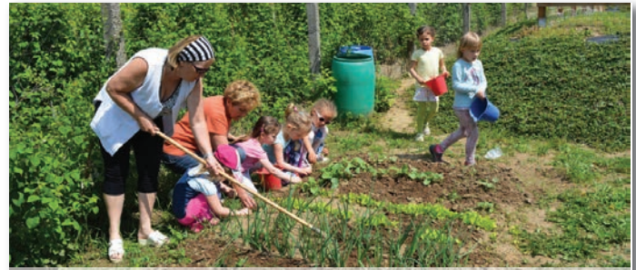
Szívesen dolgoznak a kiskertben

is meghívtuk az oviba, és egy nagyot játszottunk velünk. Az a kis idő csak róluk szólt.