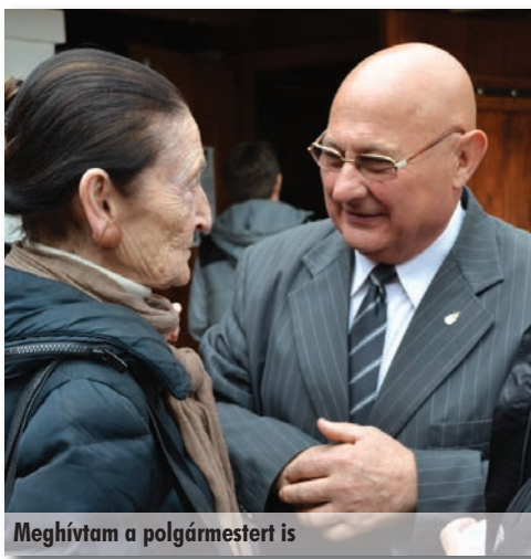
Meghívtam a polgármestert is

A szadaiak nem hagyják üresen porosodni tájházukat. Ugyan a hagyományos paraszti porta tárgyai tulajdonképpen már megvannak, de újabb és újabb ajándékok érkeznek kiürített szekrényekből, padlásokról. Rendezvényeinken is sokan megtisztelnek jelenlétükkel. Így volt ez már ötöd-