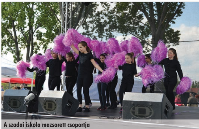
A szadai iskola mazzorett csoportja