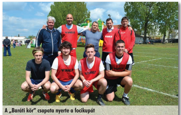
A „Baráti kör” csapata nyerte a focikupát