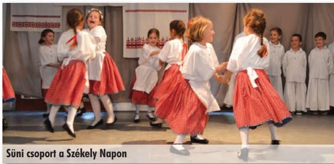
Süni csoport a Székely Napon

És az apukák? Ők sem maradhatnak ki a sorból! Természetesen őket