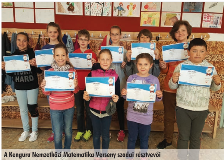
A Kenguru Nemzetközi Matematika Verseny szadai résztvevői