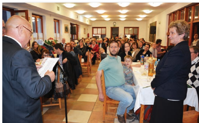
A polgármester a képviselő-testület ajándékát adja át