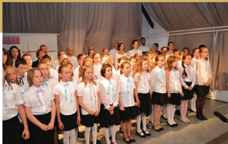
A 4.a és 4.b közös éneklése a Székely Napon

2017. április 27-én kezdődött iskolánkban a szokásosnak mondható papírgyűjtés, mely pedagógiai szempontból is hasznos, hiszen a környezettudatosságra nevelés egyik eszköze, mindemellett pedig „észrevétlenül” támogatást kap az intézmény, az oktató-nevelő munka, az itt tanuló gyermekek.