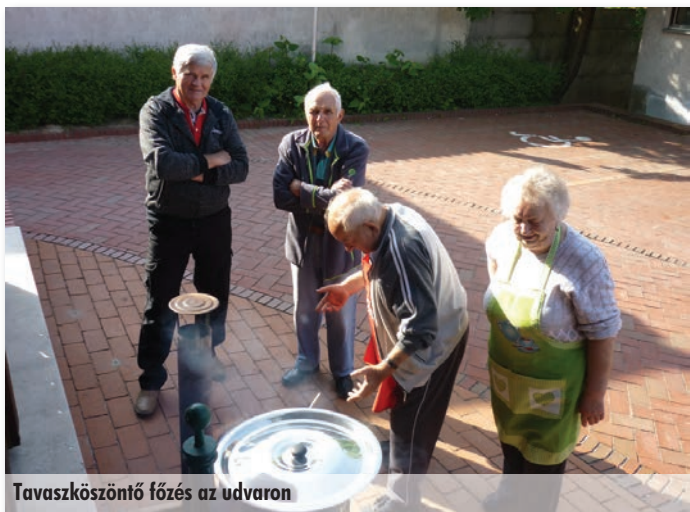
Tavaszköszöntő főzés az udvaron