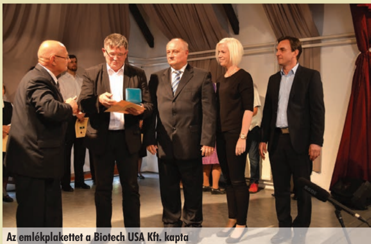
Az emléklapok a Biotech USA Kft. kapta