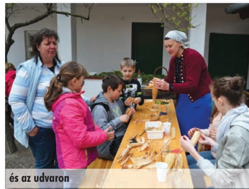
és az udvaron

Már rengeteg dolognak, tevékenységnek, intézménynek, foglalkozásnak van „napja”, ha a nap-tárakba a névnapok és ünnepnapok mellett ezt is feltüntetnék, talán egyetlen nap sem maradna „üresen”. Gondolom, különböző szervezetek ezzel a megünnepelt dolog népszerűsítését kívánják szolgálni ezzel.