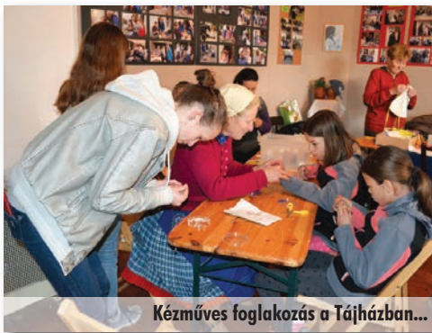
Kézműves foglalkozás a Tájházban...