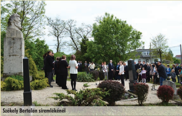
Székely Bertalan síremlékénél

Az esős nap ellenére sokan jöttek a megemlékező ünnepségre