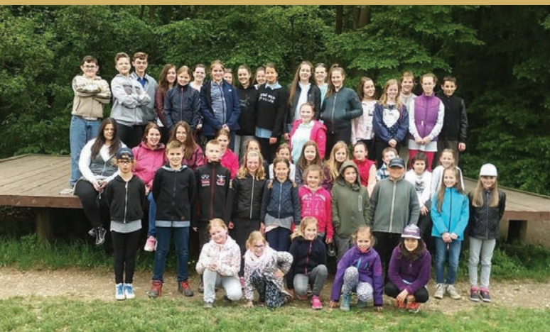
Jutalom kiránduláson a sikeres tanulóink