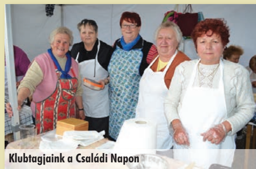
Klubtagjaink a Családi Napon