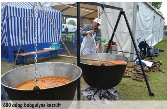
600 adag bagulyás készült