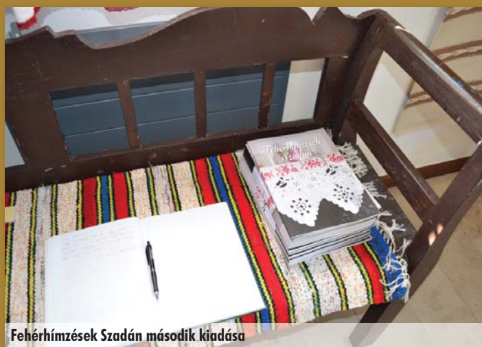
Fehérhímzések Szadán második kiadása