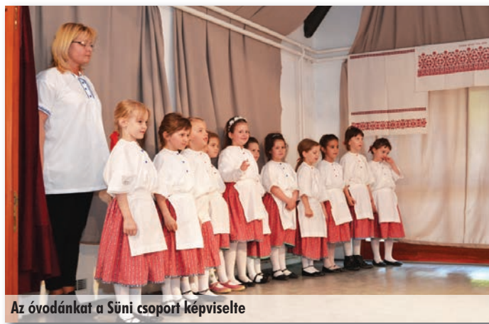
Az óvodánkat a Süni csoport képviselte