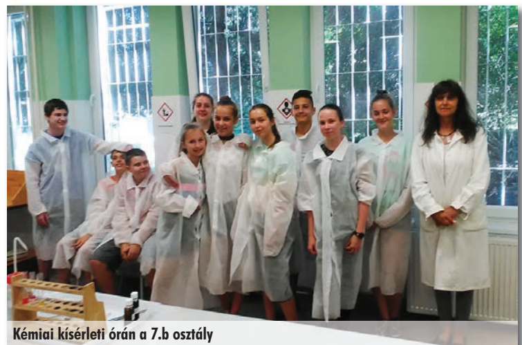
Kémiai kísérleti órán a 7.b osztály