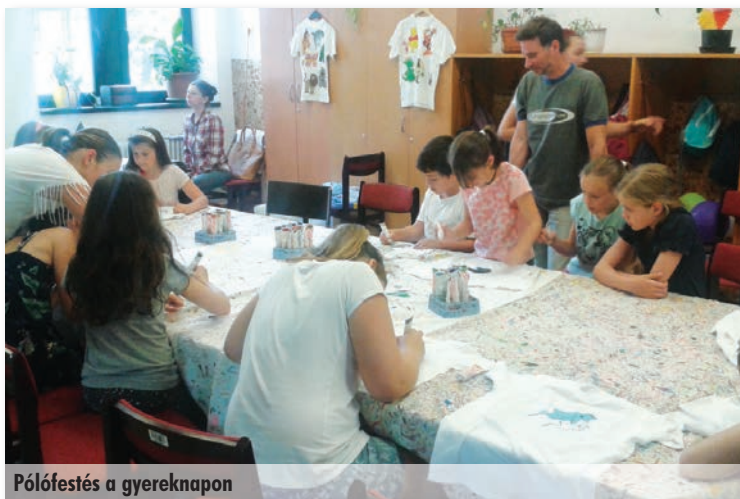
Pólófestés a gyereknapon