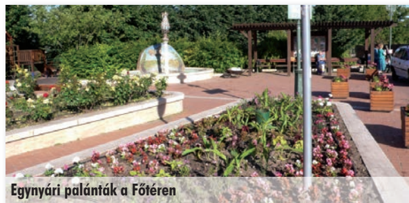
Egynyári palánták a Főtéren