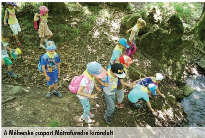
A Méhecske csoport Mátrafüredre kirándult