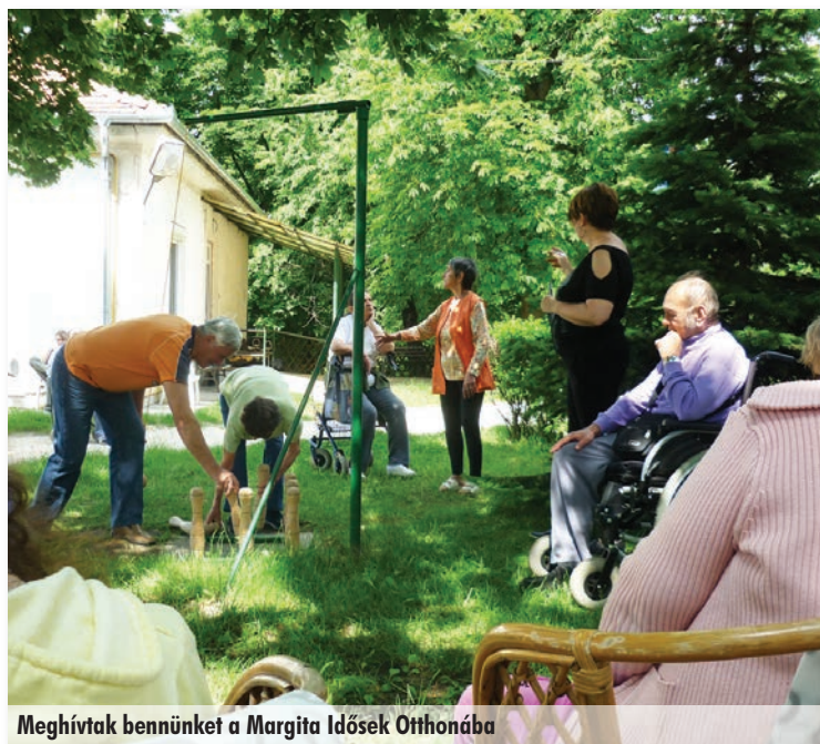
Meghívtak bennünket a Margita Idősek Otthonába

Ebben a hónapban sem maradt el a kézművesfoglalkozás, amelyen krepp papírból készítettünk virágokat. Az ügyes kezek közül szebb-