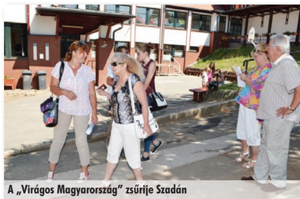
A „Virágos Magyarország” zsűrije Szadán

Végezetül álljon itt egy kis statisztika. 2017-ben 26 ágyásba közel 5000 egynyári palántát ültettünk ki. Ebben az évben évelők is kerültek az ágyásokba. A középső buszmegállóba rózsákat és törpe nyári orgonát ültettünk, de talajtakaró rózsát is ültetettünk a Védőnői Szolgálat épülete elé és a Székely Bertalan Művelődési Ház és Könyvtár előtti domboldalra is. Levendulákkal a bicikliút ágyásaiban, illetve a polgármesteri hivatalnál találkozhatunk. Virágzó cserjéket a Székelykertbe és az Ezüstkehely Gyógyszertár ágyásaiba ültettünk.