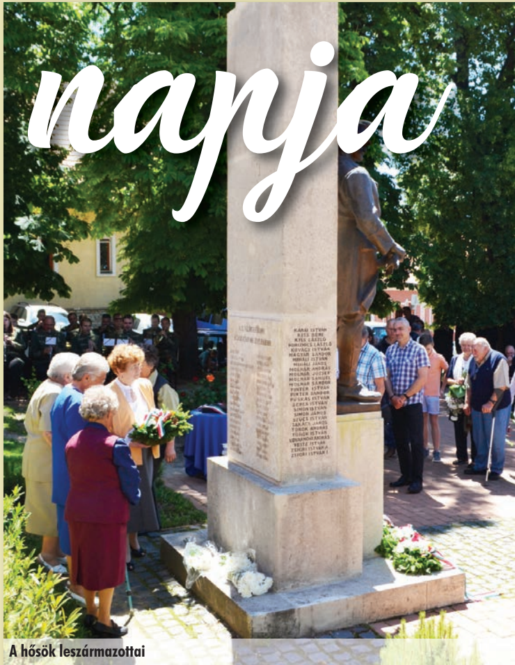
A hősök leszármazottai