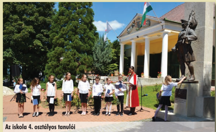
Az iskola 4. osztályos tanulói