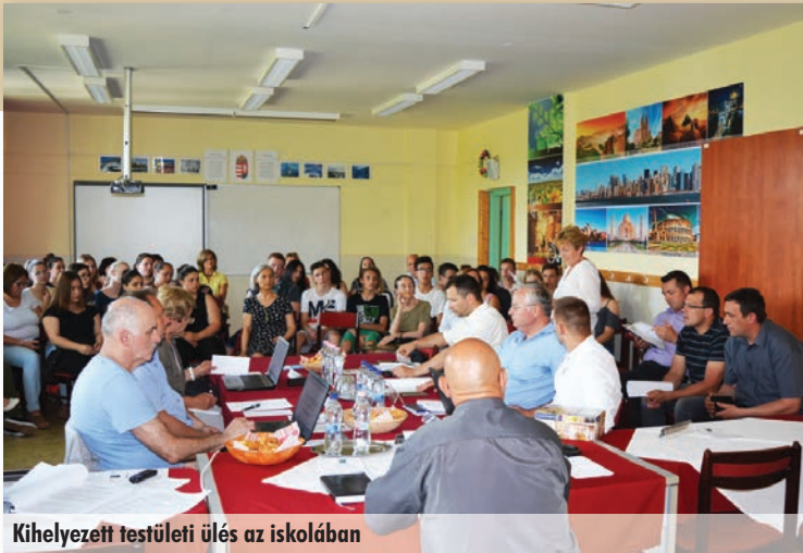
Kihelyezett testületi ülés az iskolában