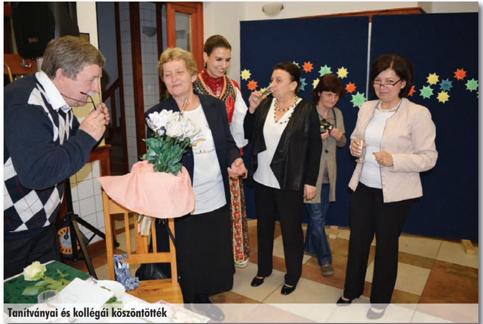
Tanítványai és kollégái köszöntötték

Szilásról, ez Kerepes egyik településrésze, tehát nem messziről. Egyébként teljesen véletlen kerültem ide. Egyik ismerősöm szólt, hogy Szadán keresnek egy matekost. Utolsó évesként kijöttem levelezőre, férjhez mentem, majd kaptunk egy szolgálati lakást is és Szadára költöztünk. Nagyon örültem, mert mindenképpen falun szerettem volna élni.