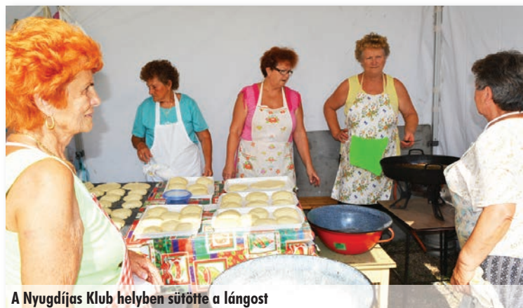
A Nyugdíjas Klub helyben sütötte a lángost