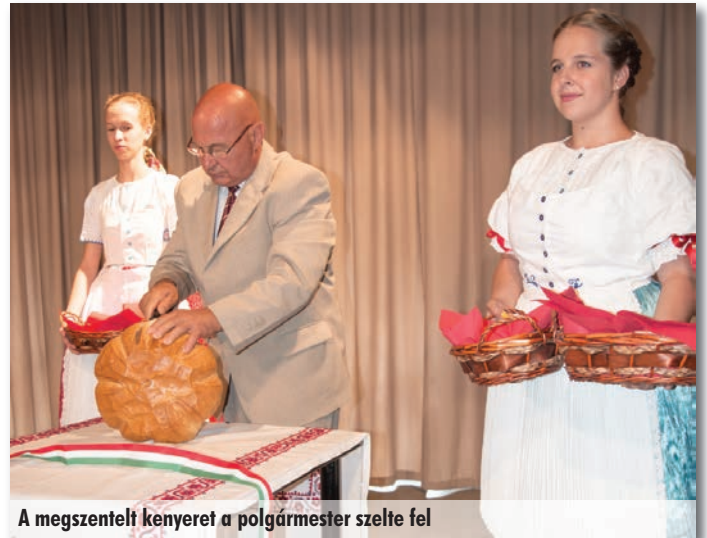
A megszentelt kenyeret a polgármester szelte fel