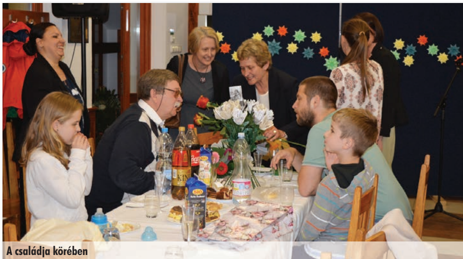
A családja körében