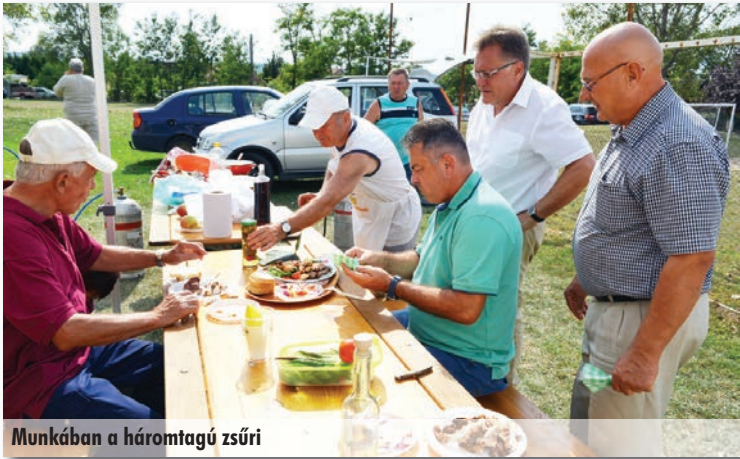
Munkában a háromtagú zsűri