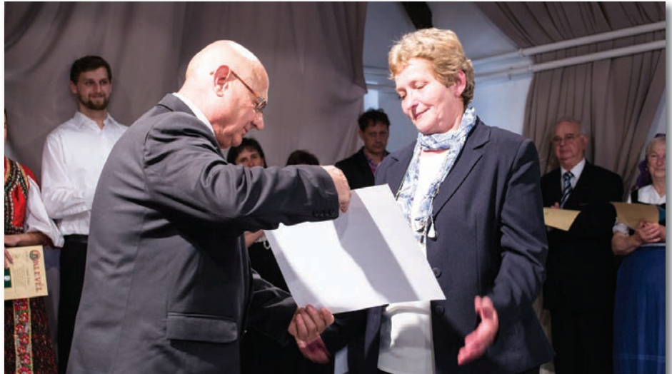
A díszpolgári cím átvétele

Köszönöm a gratulációt. A kérdésre válaszolva elmondhatom, hogy a nyugdíjba menetelemmel lezárult egy ciklus az életemben. Azt gondolom, hogy a képviselő-testület tagjai ezt jó alkalomnak tartották, hogy valamivel