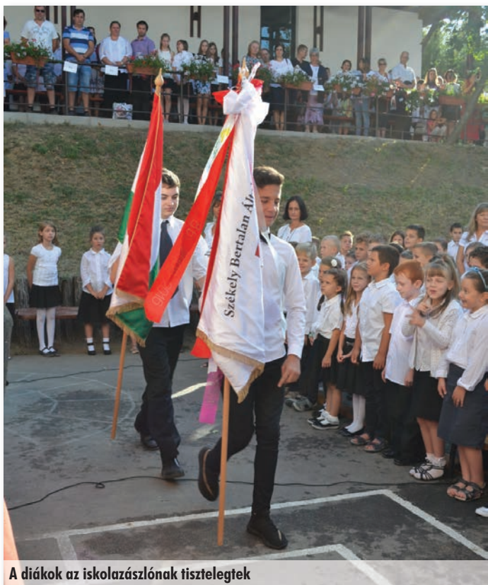
A diákok az iskolazászlónak tisztelegtek