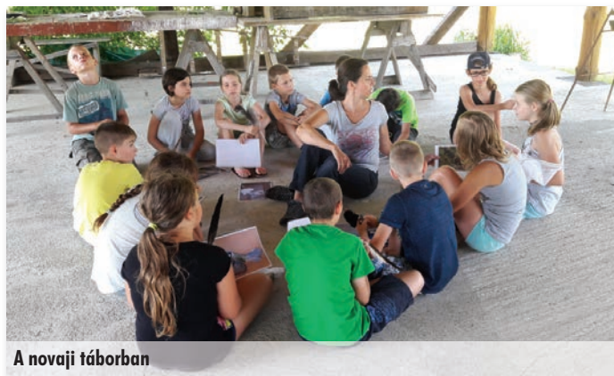
A novaji táborban

Patakon keltünk át, erdőben bókásztunk, tó körül sétáltunk, játszótéren játszottunk.