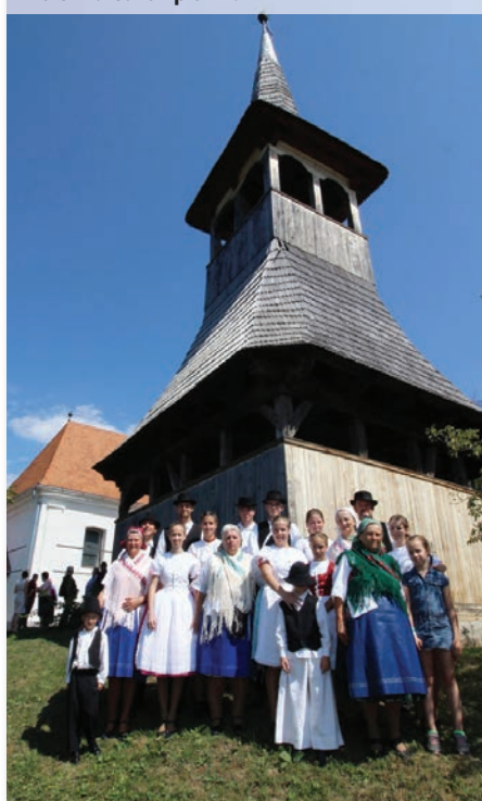
A református templomnál

PEST MEGYEI BÉKÉLTETŐ TESTÜLET 1119 Budapest, Etele út 59-61. II. em. 240. Levelezési cím: 1364 Budapest, Pf.: 81 Ügyfélfogadási idő: K-Cs: 9:00-14:00 Telefon/Fax: (06-1) 269-0703 (06-1) 784-3076 E-mail cím: pmbekelteto@pmkik.hu Honlap: www.panaszrendezes.hu www.pestmegyeibekelteto.hu