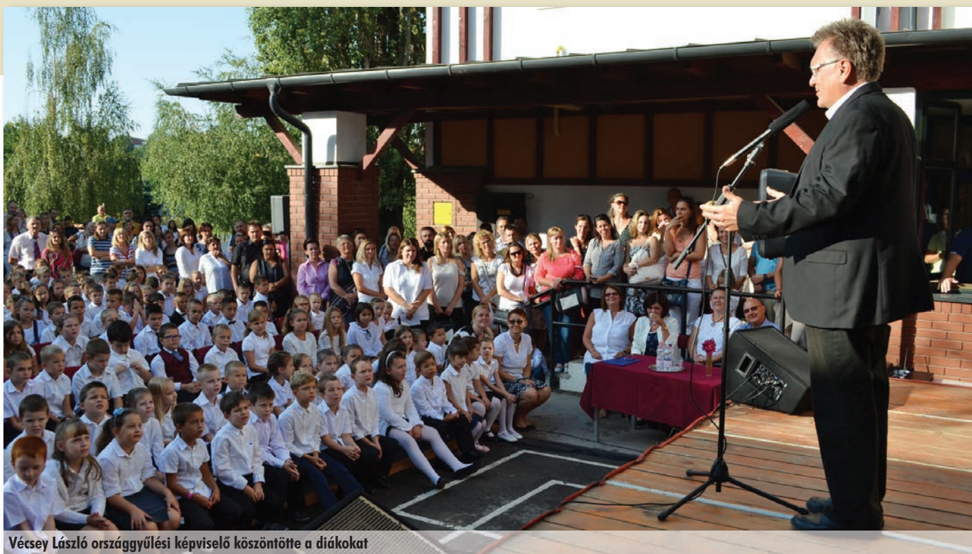
Vécsy László országgyűlési képviselő köszöntötte a diákokat