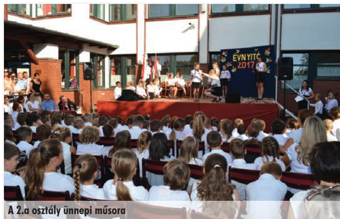
A 2.a osztály ünnepi műsora