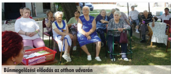
Bűnmegelőzési előadás az otthon udvarán