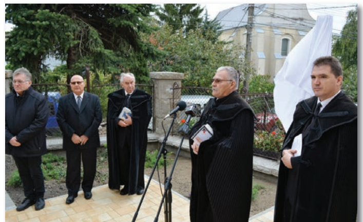
Emlékbeszédet mondott Halász Béla püspök