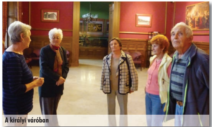
A királyi váróban

11. 08. Gyógytorna a Faluházban 10 órától.