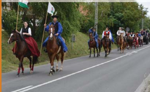
Szada SE lovasai