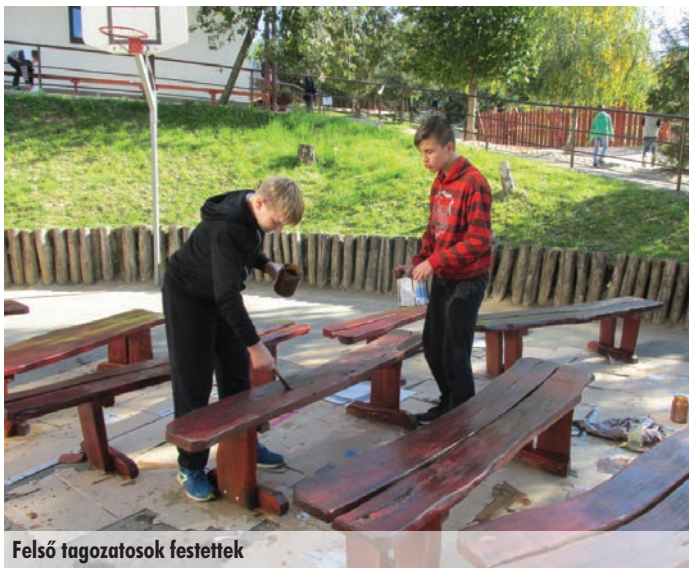
Felső tagozatosok festettek

Amíg a „nagyok” az udvaron szorgoskodtak, addig az első osztályosok kézműves foglalkozásokon vettek részt. Kezüik alól sok szép alkotás került ki.