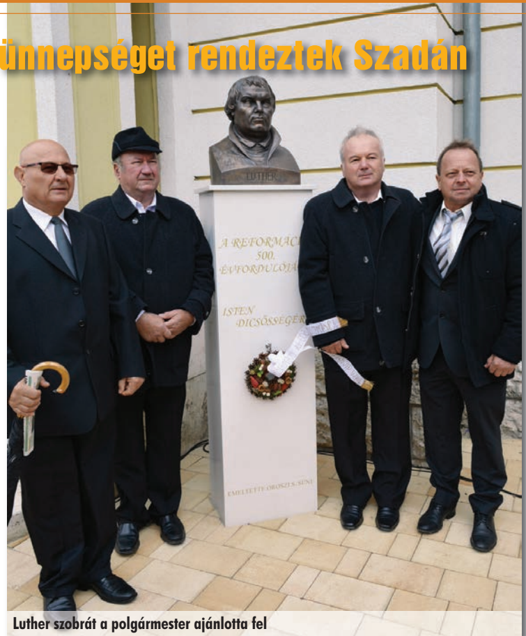
Luther szobrát a polgármester ajánlotta fel

Az első alappillér a Szentírás, a Biblia. Ezt így fogalmazták meg a reformátorok, hogy „Sola Scriptura”, azaz „Egyedül a Szentírás”. Istent és önmagunkat is a Bibliából, Isten Igéjéből ismerhetjük meg. Isten a Biblián keresztül szól hozzánk. Ne mi kritizáljuk a Bibliát,