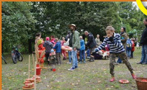
Piros lábasos népi játszótér