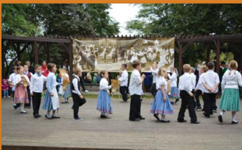
Alsó tagozatosok táncjátéka