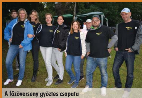
A főzőverseny győztes csapata