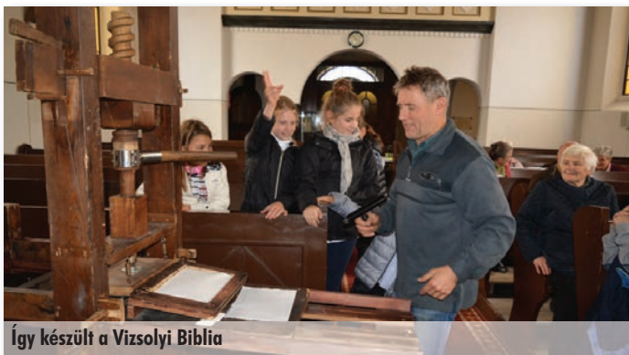
Így készült a Vizsolyi Biblia

„Nincsen üdvösség senki másban, mert nem is adatott az embereknek az ég alatt más név, amely által üdvözülhetnénk.” (ApCsel 4,12), „Mert egy az Isten, egy a közbenjáró is Isten és emberek között, az ember Krisztus Jézus” (1Tim 2,5), „Jézus így válaszolt: Én vagyok az út, az igazság és az élet; senki sem mehet az Atyához, csak én általam.” (Jn 14,6).