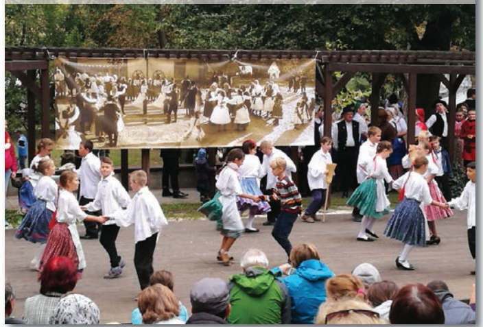
A 2. b és a 4. b közös műsora a szüreten

A nap jó hangulatban telt, hiszen szülő, nagyszülő, és gyermek együtt dolgozott második otthonunkért az iskolánkért.