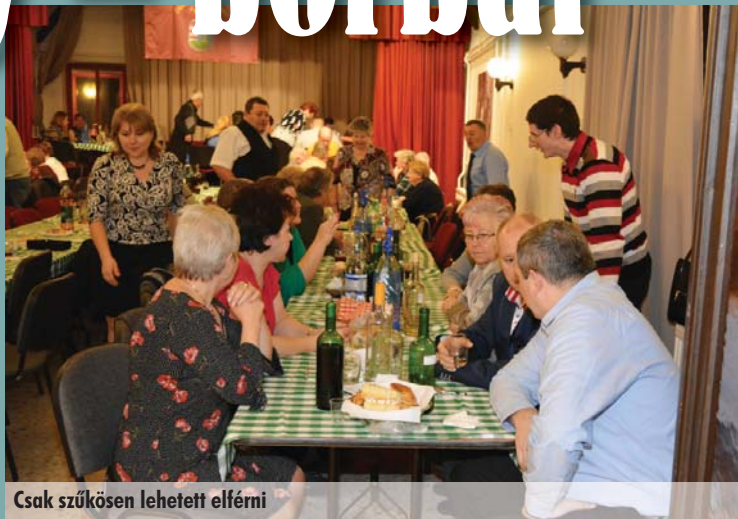
Csak szűkösen lehetett elférni