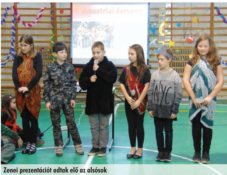
Zenei prezentációt adtak elő az alsósok

Reméljük eredményeikkel hamarosan elbüszkélkedhetünk.