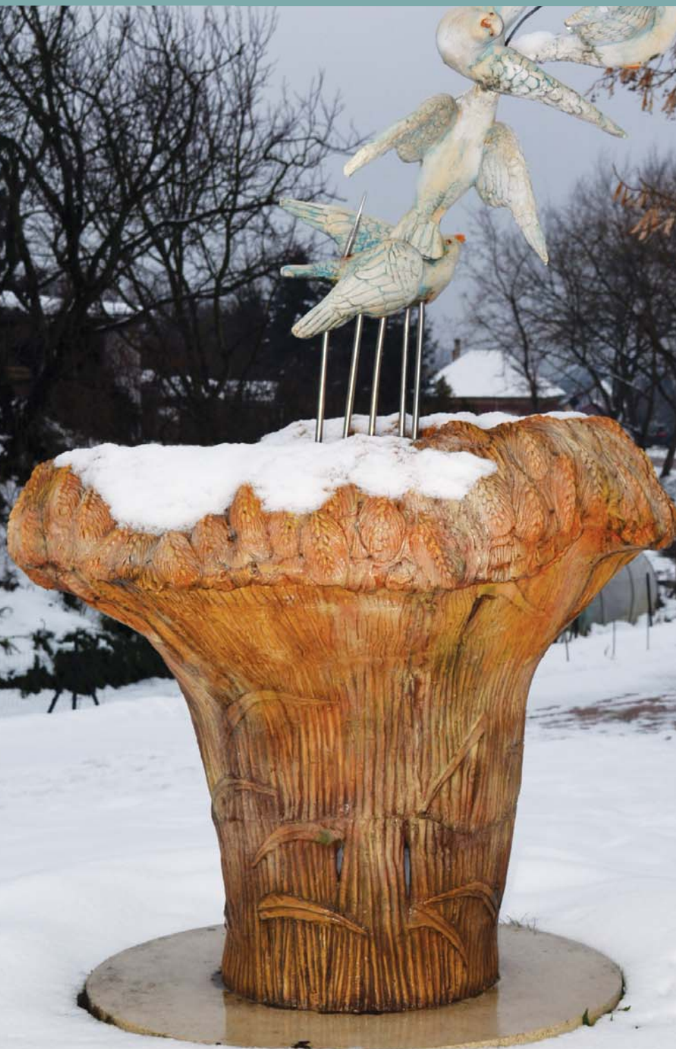
Kun Éva „Örökség” plasztikája

A SZADAI ÖNKORMÁNYZAT KÖZÉLETI TÁJÉKOZTATÓ HAVILAPJA XVI. ÉVFOLYAM • 2. SZÁM • 2018. FEBRUÁR