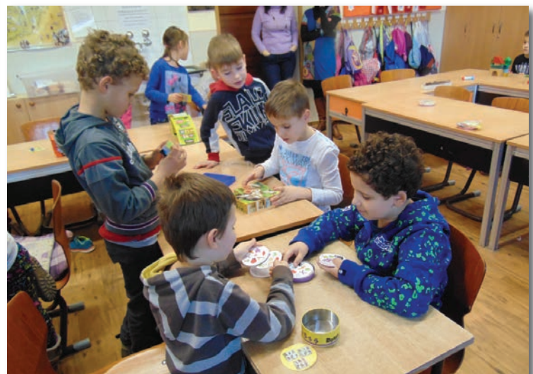
Klubnapközi foglalkozáson az alsó tagozatosok