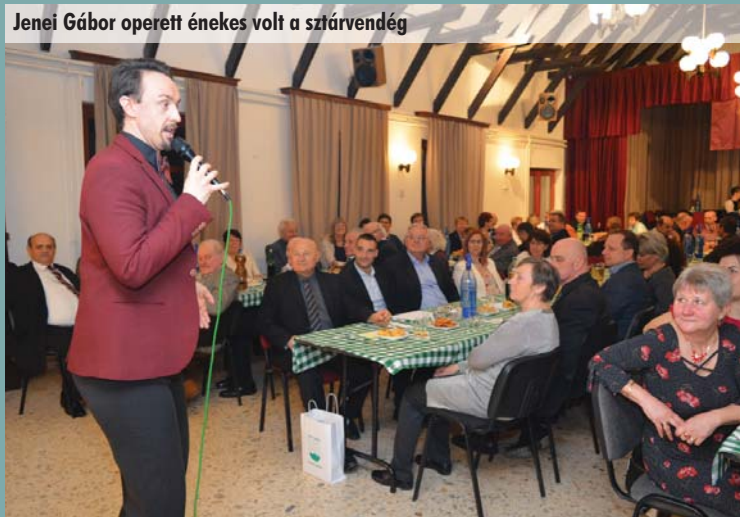
Jenei Gábor operett énekes volt a sztárvendég