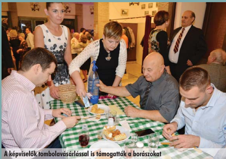
A képviselők tombolavasárlással is támogatták a borászokat