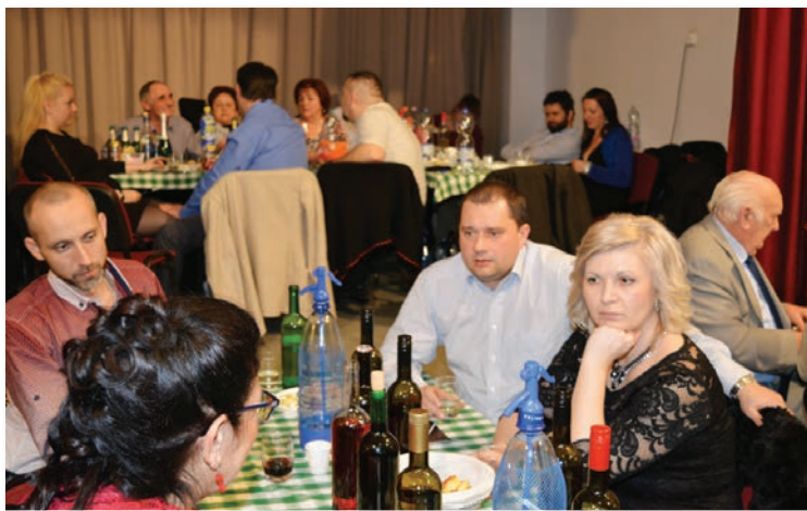
Farnádról (Felvidék) a vendégek