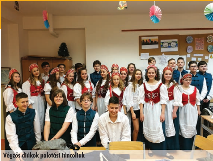
Végzős diákok palotást táncoltak

A zenét volt diákjainkból álló zenekar szolgáltatta. Mindig örömmel tölt el bennünket, hogy volt diákjaink is ellátogatnak hozzánk, s mesélnek magukról, hogyan alakult az életük. Így történt ez most is. Köszönet a szép estéért mind a szervezőnek és résztvevőnek egyaránt!