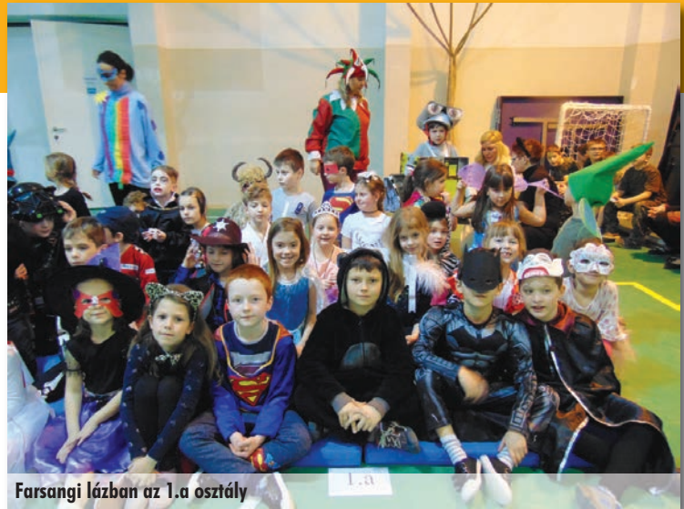
Farsangi lázban az 1.a osztály