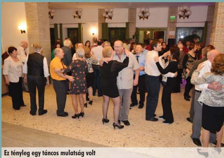
Ez tényleg egy táncos multság volt