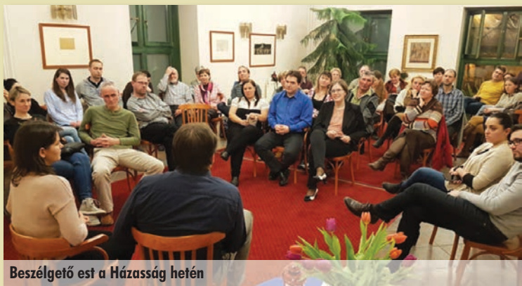
Beszélgető est a Házasság hetén

irodalom gyermekem számára, ami nekünk szülőknek is örömet, eligazítást jelent. Az irodalom segíti gyermekünket a hit útján.