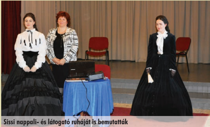
Sissi nappali- és látogató ruháját is bemutatták

Sisi ruhái és a korabeli főúri viseletek története