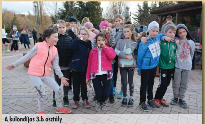
A különdíjas 3.b osztály