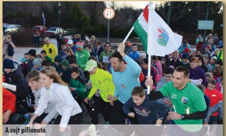
A rajt pillanata