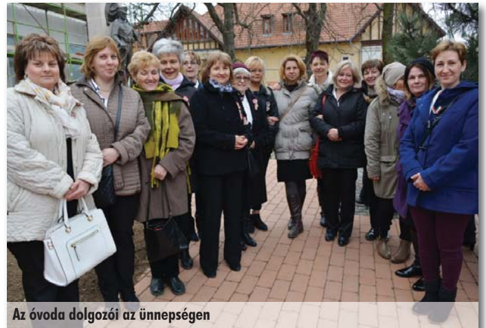
Az óvoda dolgozói az ünnepségen