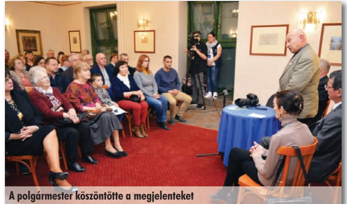
A polgármester köszöntötte a megjelenteket

Megjelent a Szada kincsei sorozat második kötete