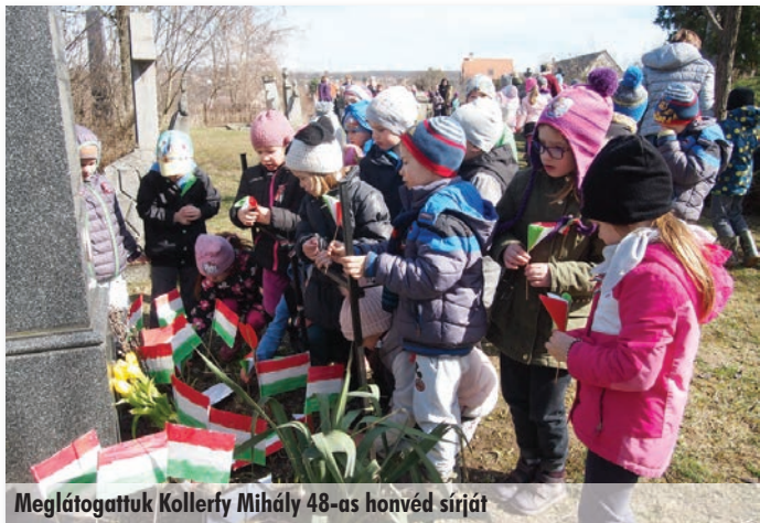
Meglátogattuk Kollerfy Mihály 48-as honvéd sírját