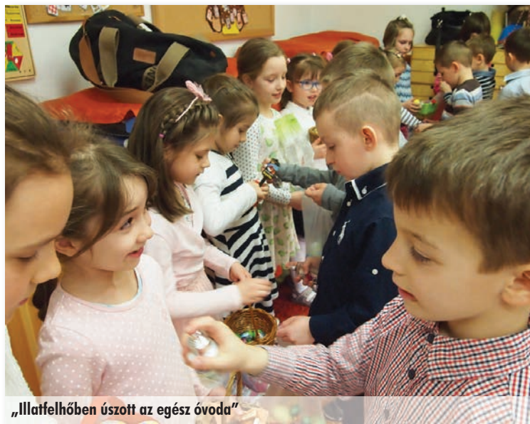
„Illatfelhőben úszott az egész óvoda”