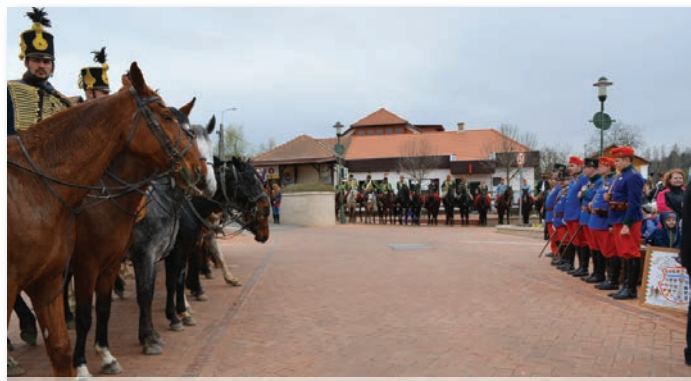
A Főtéren fogadták a hagyományőrzőket