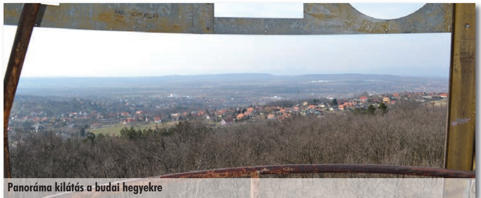
Panoráma kilátás a budai hegyekre