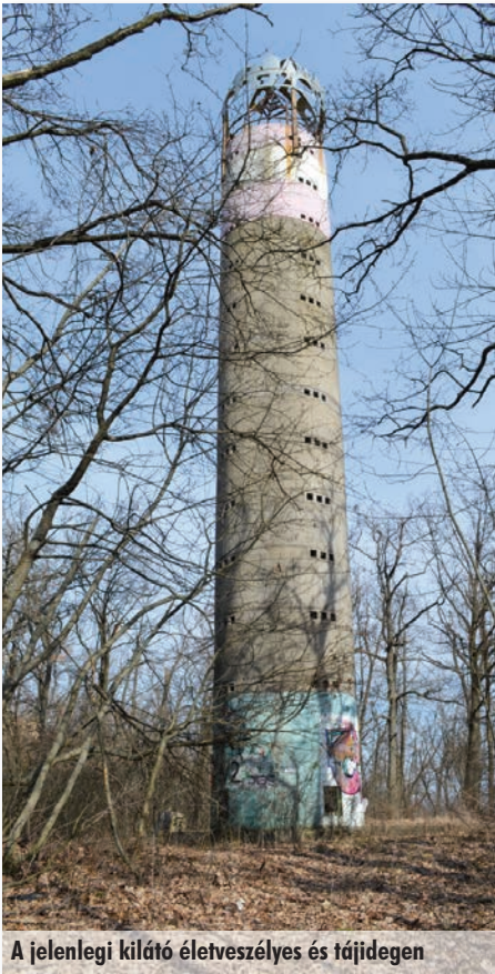
A jelenlegi kilátó életveszélyes és tájidegen

Két év alatt mintegy 1 milliárd forintból újul meg az évente 25 millió látogatót fogadó Pilisi Parkerdő teljes turisztikai infrastruktúrája. A program Szadát is érinti, ugyanis a Pilisi Parkerdőgazdaság Zrt. és a Magyar Természetjáró Szövetség alkotta konzorcium többek között három új kilátót is épít. Egyet a Szentendre felett a Bölcső-hegyen, egyet Szada mellett a Margita-hegyen és egyet a Gerecse keleti peremén található Nagy-Gete hegyen. A program legfontosabb eleme a térséget átszelő mintegy 1000 kilométernyi turistaút-hálózathoz kapcsolódó pihenőhelyek és információs rendszer korszerűsítése. Összesen mintegy 1000 pad- és asztalgarnitúra, 32 esőbeálló, 100 tűzrakó- és pihenőhely újul