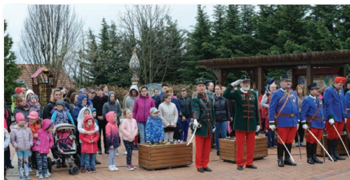
Sokan kíváncsiak voltak a látványos programra