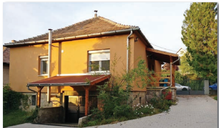
A volt lelkipásztori lakásban alakították ki a bölcsődét

www.szadaingatlan.hu Telefon: 06-20/503-2018