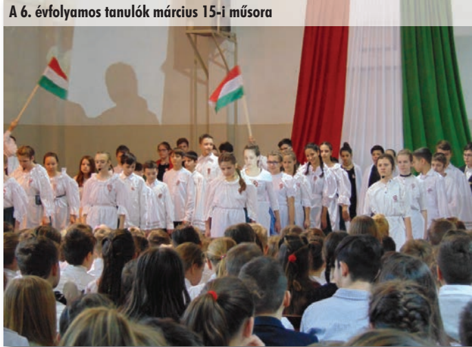
A 6. évfolyamos tanulók március 15-i műsora

és az esetleges szereplőtárral tartott kontaktus voltak a legfontosabbak. A minőségi előadáshoz nem elég a jó adottság, sok gyakorlás, stílusismeret, jól összeválogatott dalok is szükségesek. Összesen 42 versenyszám volt, ezek közül 19 egyéni, 21 páros, 9 énekhármas volt. Tizenöt arany, 13 ezüst és tizennégy bronz minősítést szereztek tanulóink.