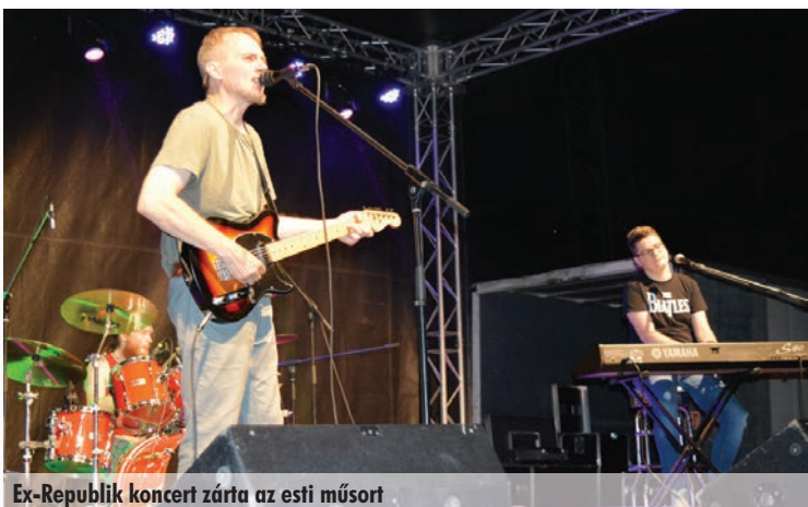
Ex-Republic koncert zárta az esti műsort