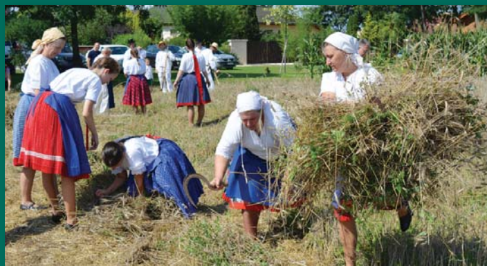
Marokszedő lányok, asszonyok