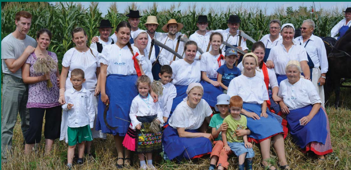
A szadai aratás résztvevői