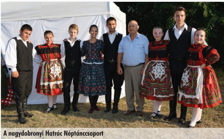
A nagydobronyi Hatrác Néptáncsoport