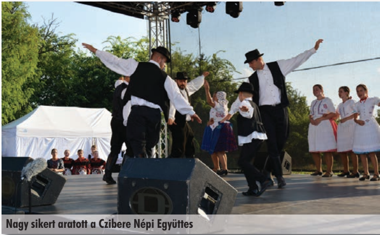
Nagy sikert aratott a Czibere Népi Együttes