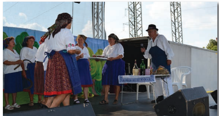
A Nyugdijas Klub is szerepelt