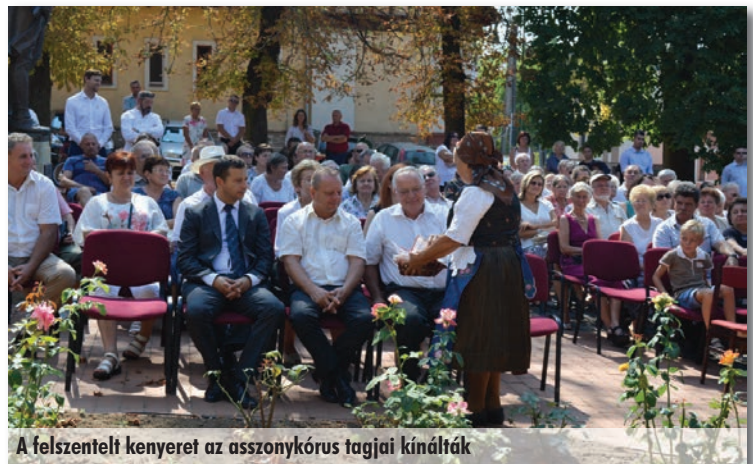
A felszentelt kenyeret az asszonykórus tagjai kínálták