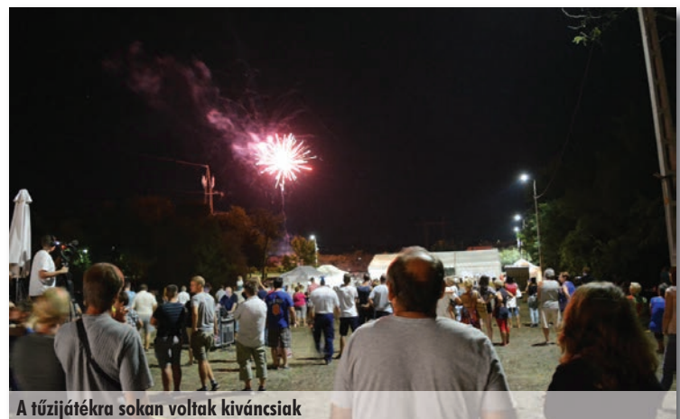
A tűzijátékra sokan voltak kíváncsiak