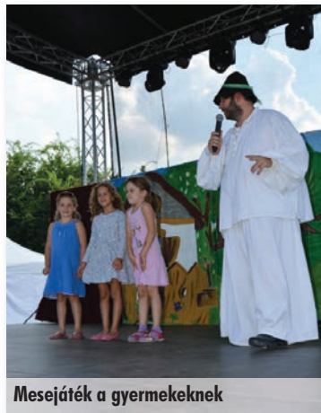
Mesejáték a gyermekeknek