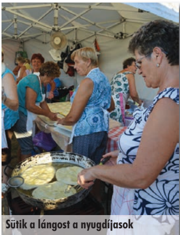
Sütik a lángost a nyugdíjasok