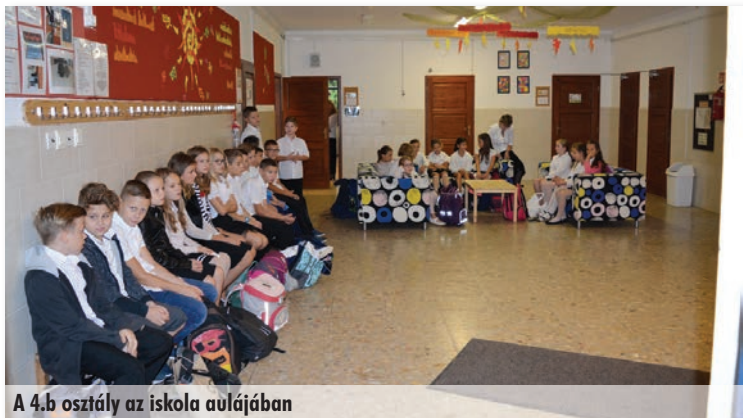
A 4.b osztály az iskola aulájában

A tavalyi év vége felé derült ki tantestületünk számára, hogy a magas létszámra való tekintettel egy osztálynak az iskola épületén kívül kell majd a következő tanévet eltöltenie. Igazgatóasszony ezt a feladatot a negyedik évfolyamra bízta, majd a kollégánommal történt megbeszélés, valamint jó néhány szempont mérlegelése után én vállaltam magamra és osztályomra ezt a feladatot.