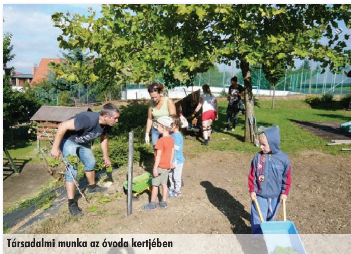
Társadalmi munka az óvoda kertjében

Élvezzük és kihasználjuk a jó időt, amennyit tudunk a szabadban tölteni.