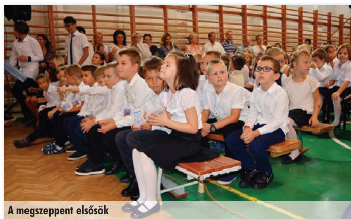
A megszeppent elsősök