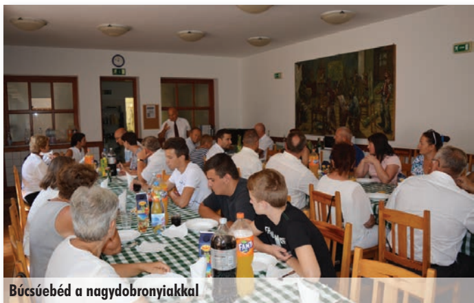
Búcsúebéd a nagydobronyaiakkal

A legrémisztöbb dologgal – a magyar fiatalok katonai behívásával – már nem kell szembeülnünk. Az ukrán hatóságok belátták, hogy ez nem a mi háborúnk. Nemcsak a magyar nemzetiség tiltakozott ellene, hanem egész Kárpátalja. Rajtunk kívül élnek itt svábok, oroszok, románok, ruszinok és szlovákok is. Most már a harcok helyszínére az ukránok zsoldosokat visznek. Persze a levegőben benne van, hogy ez a háború még tart. Szerencsére nagydobronyi áldozata nem volt ennek a háborúnak. Örömmel mondhatom, hogy a nemzetiségi fiatalok kivándorlása lecsökkent. A nyelvtörvény is okozott némi riadalmat, de szerencsére nálunk a faluban minden úgy megy, mint régen. Az a baj, hogy a hivatalos állami nyelvre kényszerítenék a nemzetiségeket, de ehhez az ukránok nem csináltak nemzetiségi oktatáspolitikát. Óvodában megengedik a magyar nyelv használatát, de az iskolában már feltételekhez kötnék. A nem szláv nyelvcsaládhoz tartozó, javarészt anyanyelvi környezetben élők, azaz a magyarok és a románok esetében az ukránok azt javasolják, hogy kevesebb tantárgy oktatásában térjenek át ötödik osztálytól az ukrán nyelvre, és az ukránul oktatott tantárgyak számának bővítése is lassabban történjen. Nagydobronyban 1944 óta van magyar középiskola, ahol óriási feszültséget okozna egy ilyen átállítás. Az ukránok egyelőre a törvény bevezetését kitolták 2023-ig. Szerintem addig megállapodnak a magyar kormányval. P. Gy.