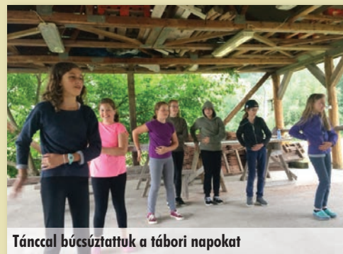
Táncal búcsúztattuk a tábori napokat