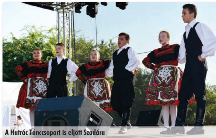
A Hatrác Táncsoport is eljött Szadára