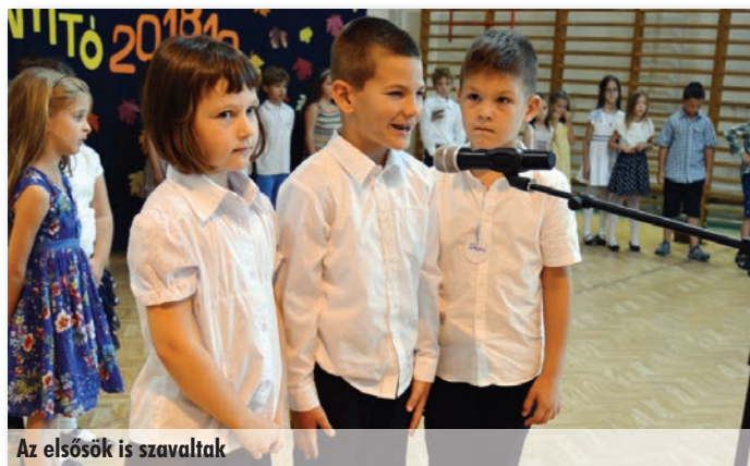
Az elsősök is szavaltak