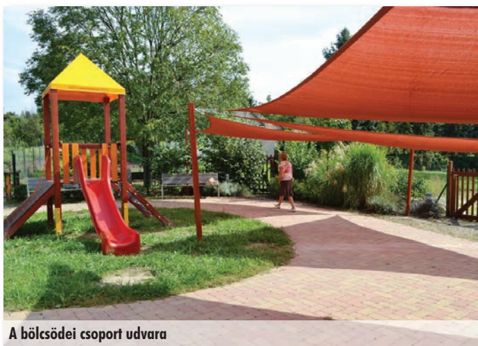
A bölcsődei csoport udvara