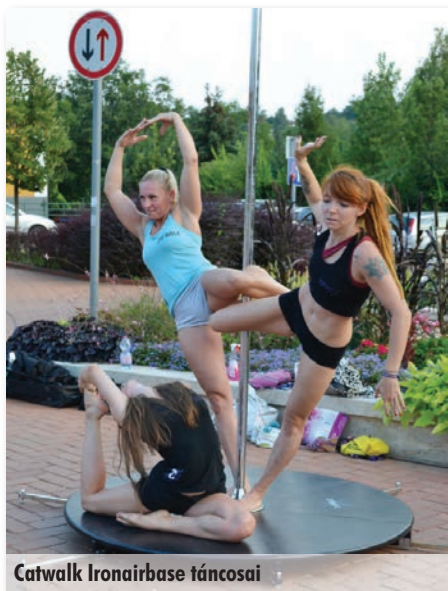
Catwalk Ironairbase táncosai