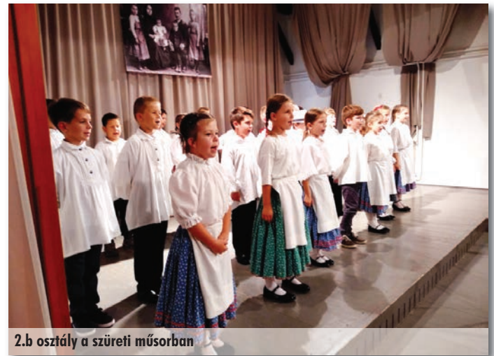
2.b osztály a szüreti műsorban

foglalkozások szervezése már több éves hagyományhoz kötődik. Ezeket a foglalkozásokat mindig valamilyen ünnepkörhöz, népszokásokhoz igazítjuk. Az idén a Szadai szüret adott hangulati alapot az őszi gyümölcsök jegyében szervezett délutáni foglalkozáshoz. A napközis gyerekek 2 korcsoportban vehettek részt a pedagógusok által összeállított érdekes, izgalmas mozgásos ügyességi versenyeken. Őszi gyümölcsökről szóló találos kérdéseken, keresztretjvényeken gondolkozhattak. A kicsik szüreti körjátékokat játszhattak és diótörők is lehettek.