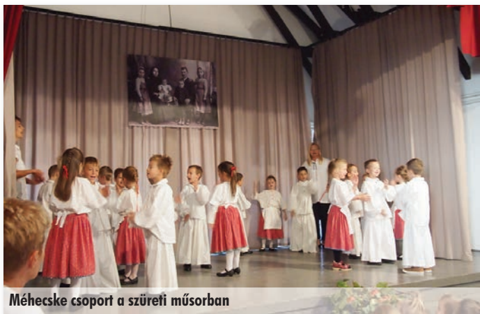
Méhecske csoport a szüreti műsorban

A Méhecske csoport ügyesen ropta a táncot a faluszüreten, majd szeptember 26-án az óvodai szüreti bálon. A dadus nénik most is finom mustot készítettek nekünk és együtt táncolt az egész óvoda.