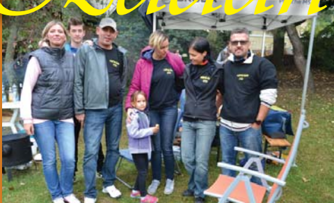
A főzőverseny győztese: a Napsugár köz