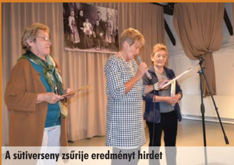
A sütiverseny zsűrije eredményt hirdet