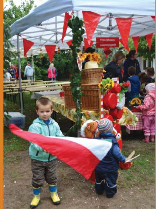
Piros lábasos népi játszótér