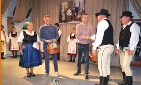
A kecskiskisfaludiak ajándékot adtak a vendéglátóknak