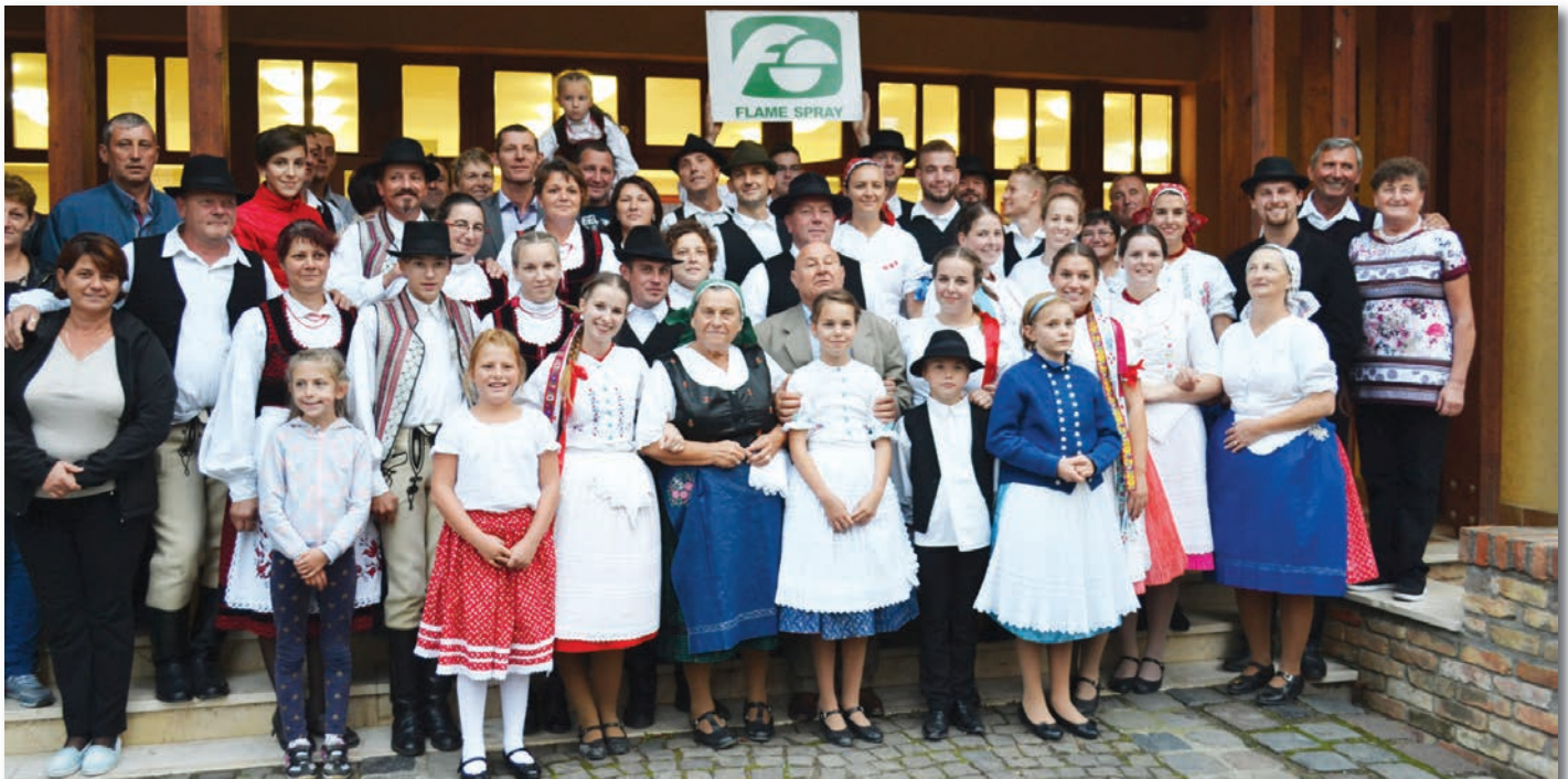
Kecsetkisfaludiak a vendéglátó szadaiakkal