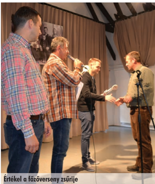
Értékel a főzőverseny zsűrije