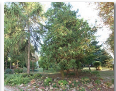
Díszkert: 2. Tóth László