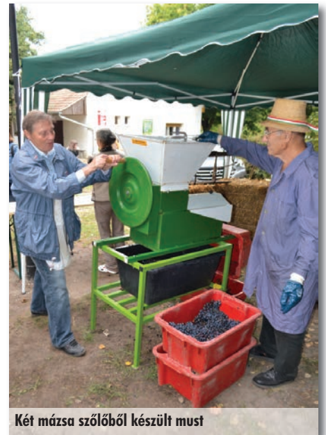
Két mázsa szőlőből készült must