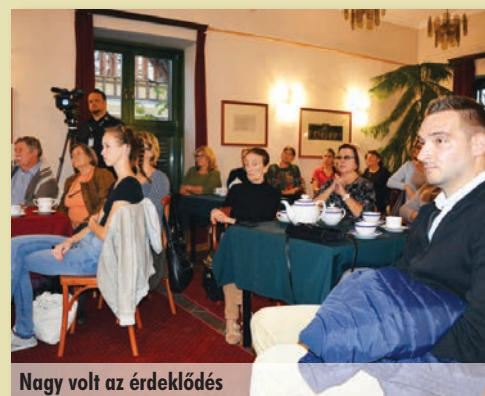
Nagy volt az érdeklődés