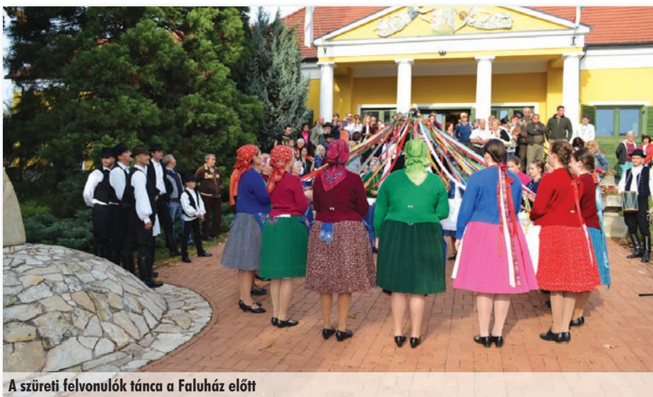
A szüreti felvonulók tánca a Faluház előtt