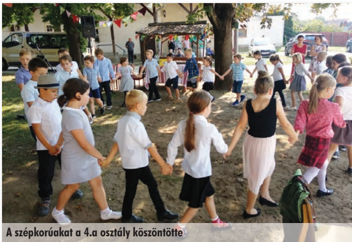
A székelykorukat a 4.a osztály köszöntötte

Az alsó tagozaton nevelő-oktató munkánkat kiegészítő szabadidős