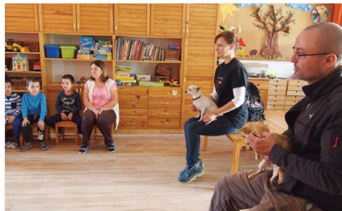
A kutyás bemutató nagyo érdekelte a gyerekeket