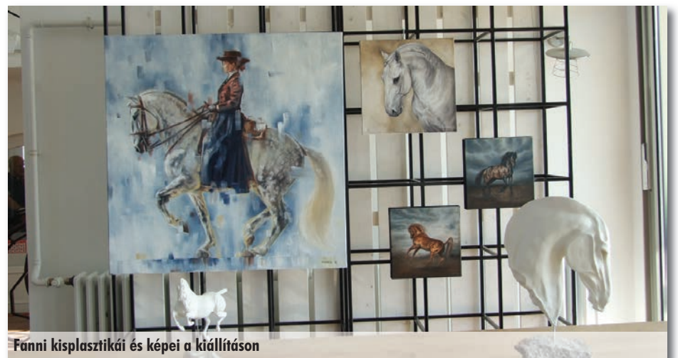
Fanni kisplasztikái és képei a kiállításon