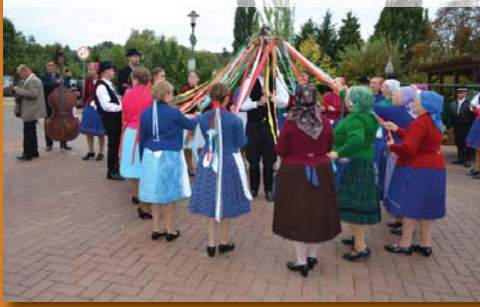
Szüreti tánc a Főtéren