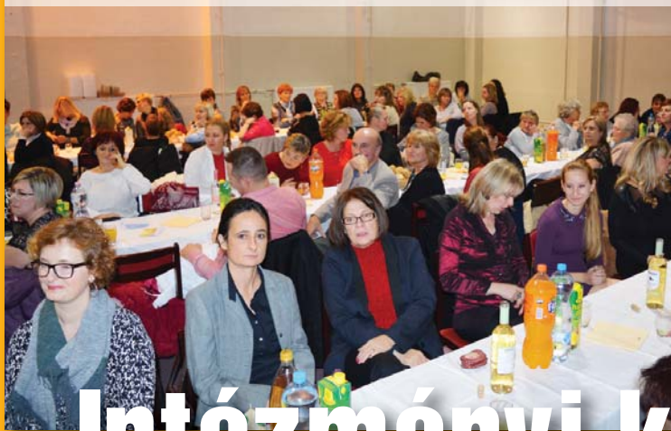
Előtérben az iskola pedagógusai