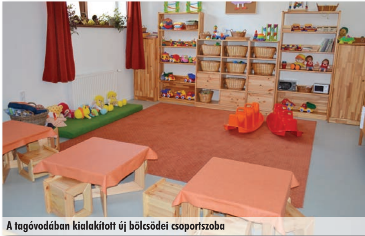
A tagóvodában kialakított új bölcsődei csoportszoba