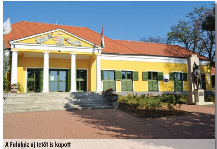
A Faluház új tetőt is kapott