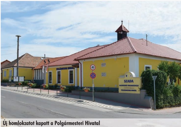
Új homlokzatot kapott a Polgármesteri Hivatal

A bölcsőde építésére beadott pályázatunkat elutasították, azonban az önkormányzatnak kötelező bölcsődei férőhelyeket kell biztosítania, ezért szintén önerőből a tagóvodában alakítottunk ki egy bölcsődei csoportszobát az orvosi szoba és a nevelői szoba összevonásával és a meglévő vizesblokk minimális átalakításával. Az átépítés után összesen 14 bölcsődés gyermeket tudtunk felvenni. A bölcsőde átépítéséhez közel 6 millió forintot, a bérköltséghez 3.600.000 forintot adott az önkormányzat. Az átalakításhoz az óvoda-bölcsőde udvarának a bővítése is szükségessé vált, ezért az önkormányzat megvásárolta az 1791 négyzetméteres beépítetlen „Sélei telket”. Még egy ingatlan vásárlást emelnék ki, a Rákóczi utcában a Pintér féle házat vettük meg, ennek lebontása után ki tudjuk majd