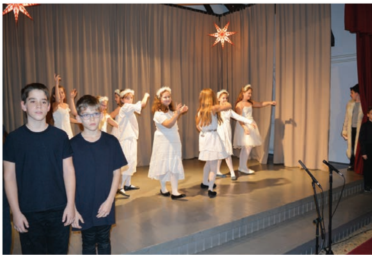
Angyaltánc a 4.a osztály előadásában