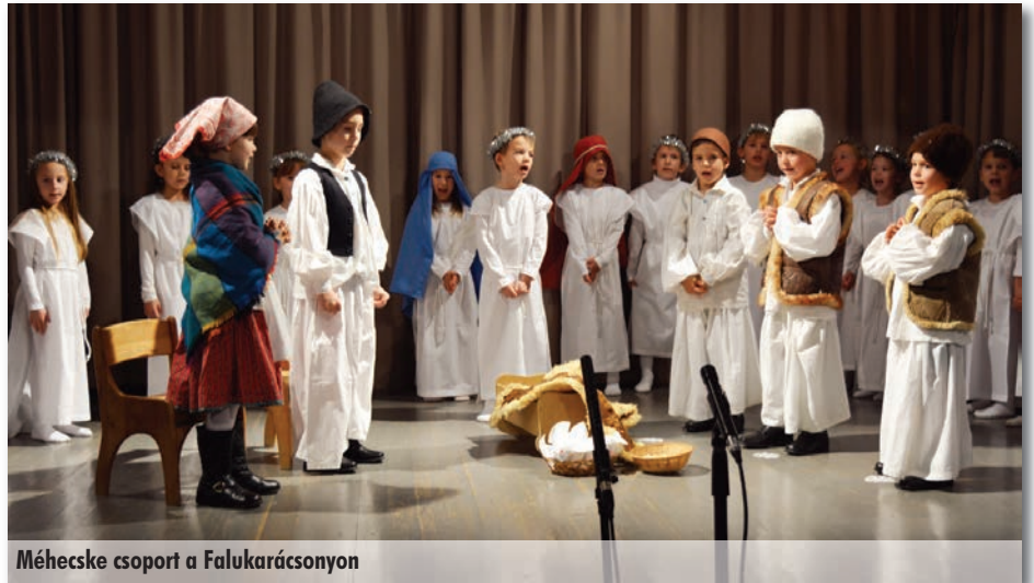
Méhecske csoport a Falukarácsonyon

December 17-én mindenki izgatottan, ünneplőben érkezett az óvodába, hisz aznap volt az ajándékozás, a szeretet napja. Már minden csoportban állt a karácsonyfa, s a Méhecskék műsora után a játékok is alákerültek. A gyerekek nagy örömmel vették birtokba az újonnan kapott legót, kisautót,