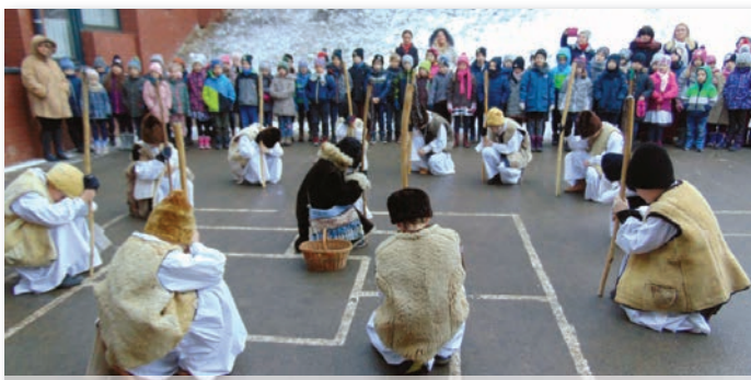
A 4.b osztályosok betlehemes az iskola udvarán