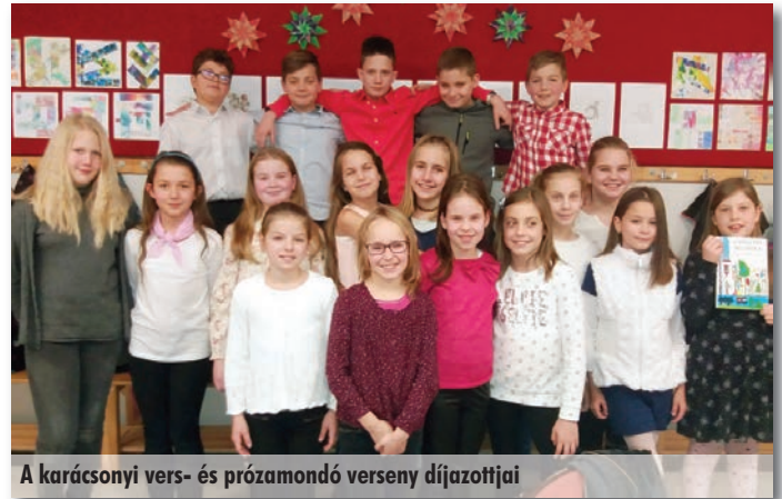
A karácsonyi vers- és prózamondó verseny díjazottjai

a megtisztelő feladatot. A műsorokhoz szükséges kellékek, jelmezek, népi ruhák beszerzése közös feladatként hárult az osztályfőnökökre, a gyermekekre és a község lakóira egyaránt. Az előadásokra felkészítő próbák már a karácsony előtti hetekben megkezdődtek, ezeken diákjaink fáradtságot nem ismerve, lelkesen, a feladatot megtisztelőt érezve vettek részt.