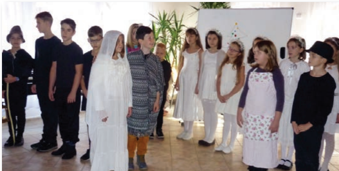
A 4.a osztály a református gyülekezeti teremben

A 4.b osztály a hagyományörző szadai betlehemes játék, a 4. a osztályosok pedig a karácsonyi irodalmi összeállítás előadására vállalták