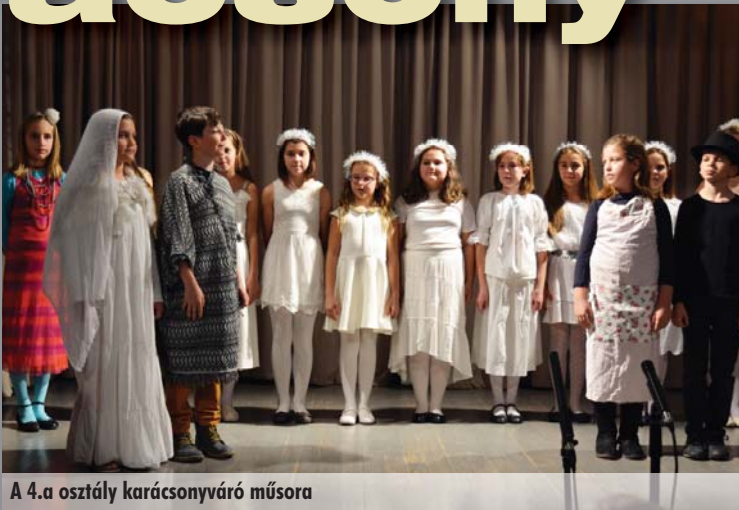
A 4.a osztály karácsonyváró műsora