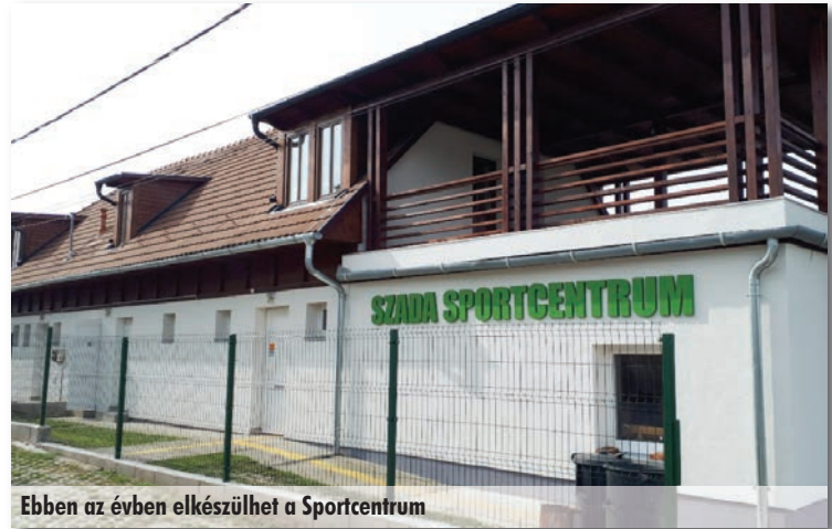
Ebben az évben elkészülhet a Sportcentrum

szélesíteni a Rákóczi utcát a Mélyárok és a Székely Bertalan út között.