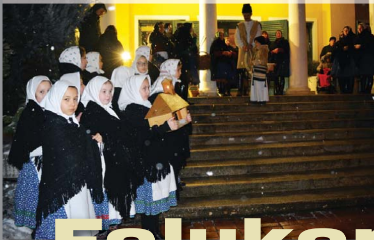
Szadi betlehemes a Faluház előtt