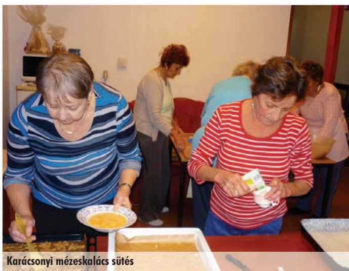
Karácsonyi mézeskalács sütés