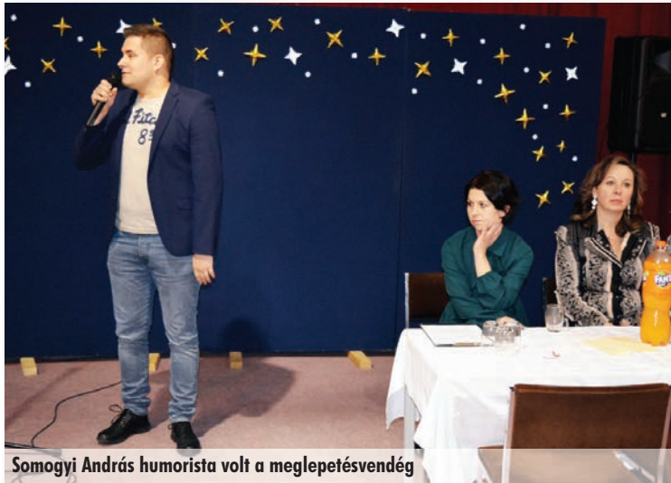
Somogyi András humorista volt a meglepetésvendég