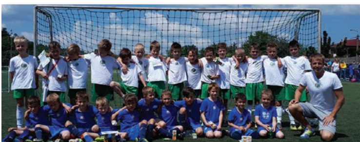
U8 és U9-es korosztály