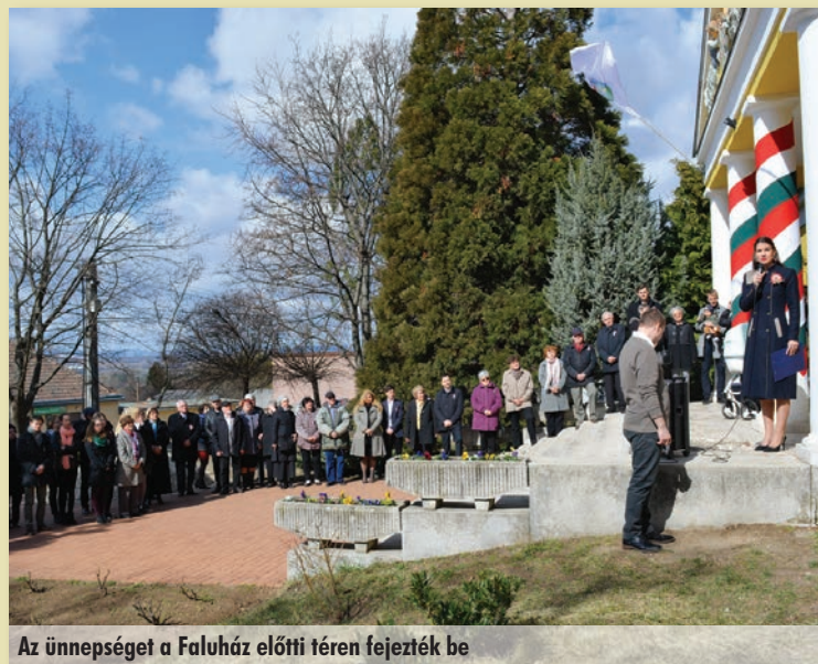
Az ünnepséget a Faluház előtti téren fejezték be