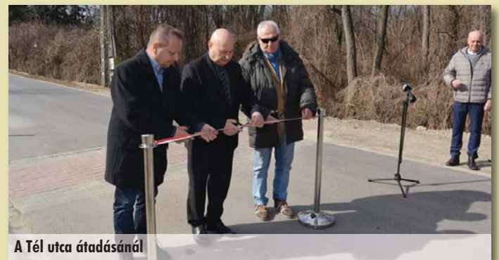
A Tél utca átadásánál