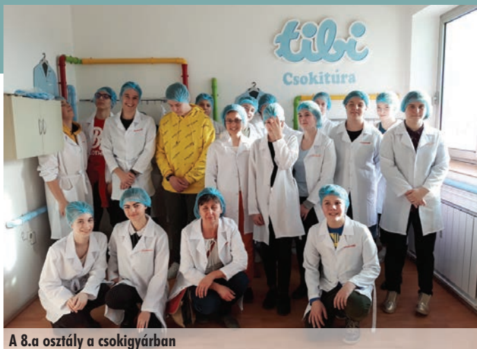
A 8.a osztály a csokitúrán

egy kis pohárba, majd valamennyien egy kis csomaggal együtt távozhattunk, amiben természetesen csokit kaptunk. Ráadásként még egy jó nagy adag táblás csokit is magunkkal hozhattunk, amelyet az iskolában osztottunk szét megédesítve ezzel a tanulás mindennapjait.