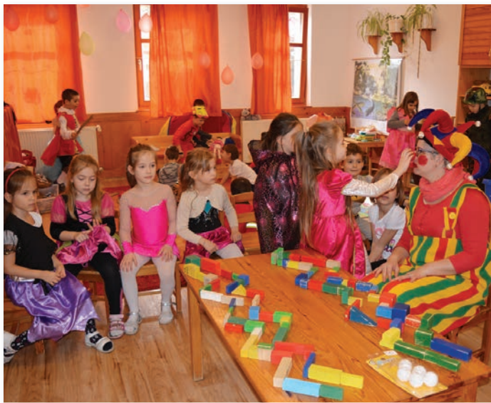
Farsangi hangulat a Mókus csoportban