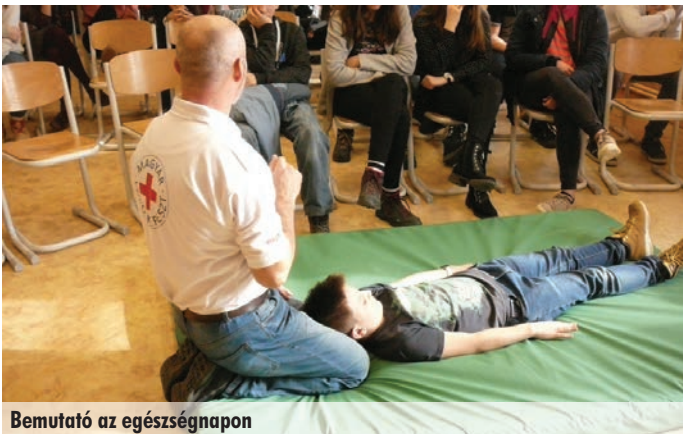
Bemutató az egészségnapon

Egészségnap, de másképpen, 2019. 02. 13-án megmozdult az iskola. Ezen a napon 5-8. osztályosoknak elsősegélynyújtás volt a téma.