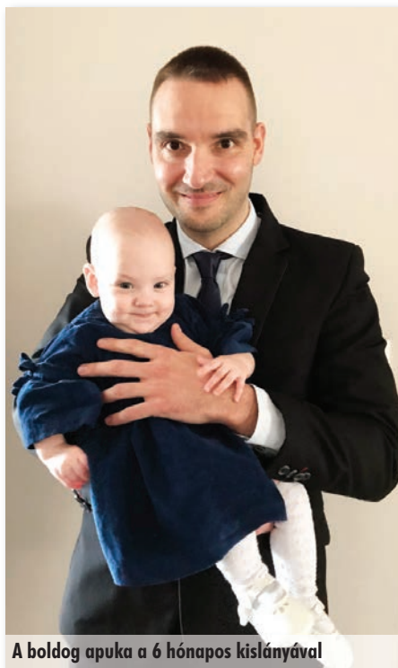
A boldog apuka a 6 hónapos kislányával

Az indítatás, ami 13 évvel ezelőtt az önkormányzati munkára irányított, nem változott. Tenni szeretnék az emberekért és a településért.