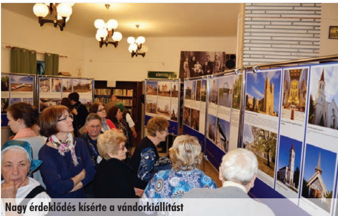
Nagy érdeklődés kísérte a vándorkiállítást

A kiállítást Szadán március 21-ig nézhetette meg az érdeklődő közönség.