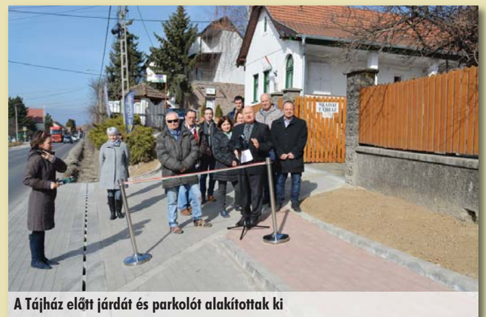
A Tájház előtt járdát és parkolót alakítottak ki