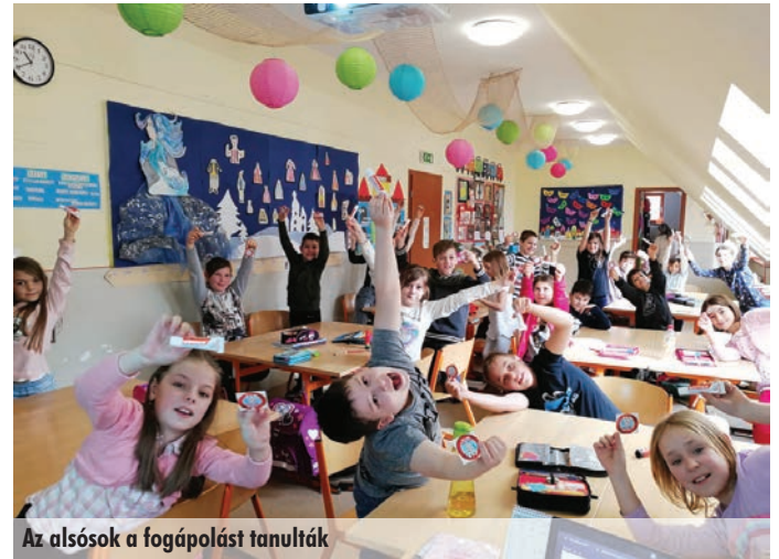
Az alsósok a fogápolást tanulták

Szakemberek segítségét kértük abban, hogy mutassák be a diákoknak mit kell tenni akkor, ha valamilyen sérülés történik a környezetükben. A Gödöllői mentőállomás és az Aszódi körzet Vöröskeresztes munkatársai szívesen tettek eleget a felkérésnek, hogy tájékoztatást nyújtsanak gyerekeknek és felnőtteknek egyaránt. Négy helyszínen vehettek részt az osztályok, ahol ismertették az elsősegélynyújtás alapvető szabályait.