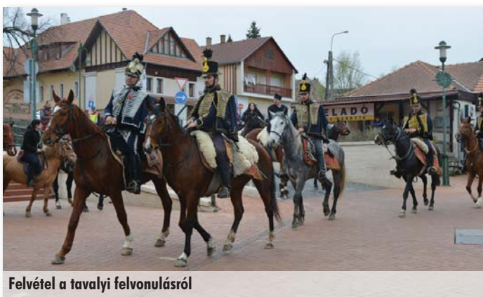
Felvétel a tavalyi felvonulásról