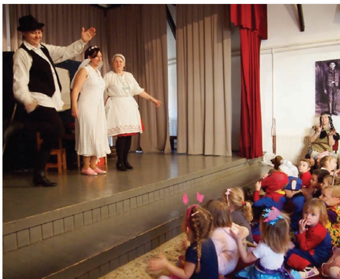
Három kívánság az óvónők előadásában