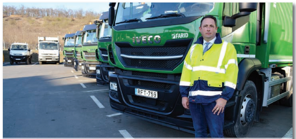
Ökörtelek-völgyben katonás rendben várokozna a gépjárművek

Induljunk egy kicsit messzebből. A lomtalanításnál eddig több rendszert alkalmaztunk ebben a régióban és országos szinten is. Sok helyen gyűjtőpontos volt, de többnyire az ingatlan elé kihelyezett lomok voltak a jellemzőek. A lomtalanításhoz nagyon sok ne-