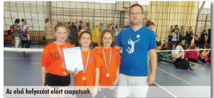
Az első helyezést elért csapatunk.