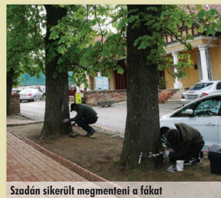
Szadán sikerült megmenteni a fákat