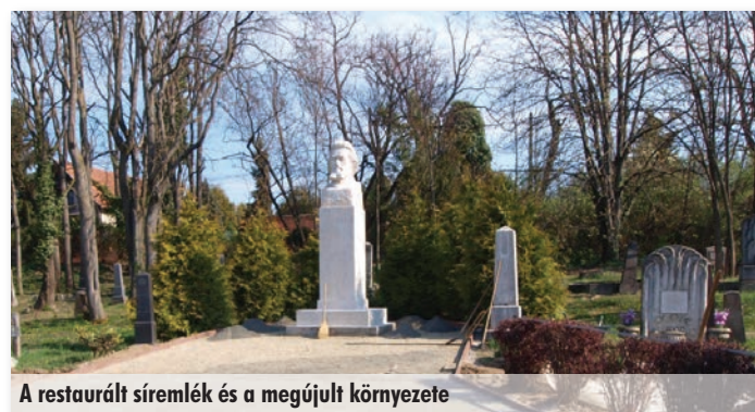
A restaurált síremlék és a megújult környezete