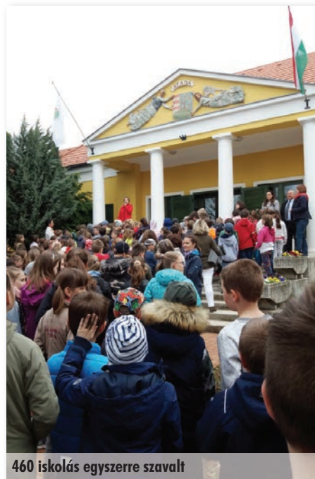
460 iskolás egyszerre szavalt

Eredetileg a szótárakban felbukkanó, kézzel margóra írt szómagyarázatokat nevezték így. Ma az újságírás egyik kedvelt műfaját értjük alatta, rövid terjedelmű, általában bíráló vagy vitázó szándékkal írt, gyakran ironikus hang-