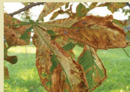
Vadgesztenyelevél az aknámoly kártétele után