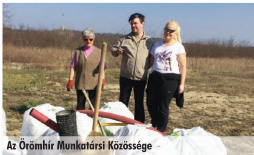
Az Örömhír Munkatársi Közössége