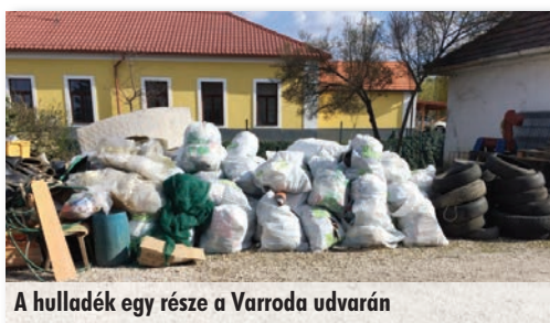
A hulladék egy része a Varroda udvarán