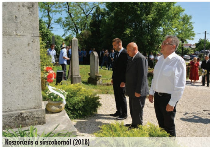
Koszorúzás a sírszobornál (2018)

Szada lakossága tartozik azzal Székely Bertalannal, hogy emlékét ápolja és megőrizze. Ezért határoztunk úgy, hogy a felvezetésben leírt programot ebben az évben megvalósítjuk. A sírszobor történetéhez hozzátartozik, hogy a szadai sírszobor felállítása Székely Bertalan halála után többször is felvetődött. A Magyar Rajztanárok Egyesülete 1926-ban gyűjtést szervezett a síremlék megvalósítása érdekében. A kezdeti fellendülés aztán évekig alábbhagyott, majd Székely Bertalan 100-ik születésének évfordulóján, 1935-ben a Képzőművészeti Főiskola kezdeményezésére létrehoztak egy Síremlék-bizottságot. A szervezésben aktív szerepet vállalt Bory Jenő, Székely Bertalan egykori tanítványa. A fejszobor Bory Jenő tervei alapján hamarosan el is készült, de a felállításra már nem maradt pénz, így a kezdeményezés 1942-ig ismét feledésbe merült. A sírszobrot végül 1943. november 27-én állították fel Szadán, amit a Magyar Rajztanárok Egyesülete, a Vallás és Közoktatási miniszter, Budapest főváros polgármestere, a Képzőművészeti Főiskola és magánszemélyek támogattak. Ebből is látszik, hogy milyen széleskörű összefogás kellett régen ahhoz, hogy valami történjen. Ez napjainkban sincs másképp. Egyébként tavaly volt a szobor ünnepélyes avatásának 75. évfordulója. Ez inspirált