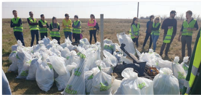
Te Szedd! mozgalomban munkatársaink is részt vettek

gativ dolog kapcsolódott, a közterület szennyezésétől kiindulva, a lomizáson át, egészen a szervezeten gyűjtött szeméig. Ezek mind-mind rontották a lakosság közérzetét. Tavaly technikai problémák miatt elmaradt a lomtalanítás, ezért ebben a régióban a Zöld Híd B.I.G.G. Nkft. most egy teljesen új szisztémával próbálkozik, vagyis a házhoz menő lomtalanítás mellett döntöttünk. Ezzel a módszerrel minimalizálni lehet a közterületek szennyezését és ki lehet zárni az erőszakos és bűncselekménynek számító lomizást. Az idősebb korosztálynak is nagy segítség az új módszer, mert nem kell nekik cipekedniük. Sokkal tervszerűbben tudjuk lebonyolítani, mert előre be tudjuk regisztrálni a jelentkezőket és a lomokat magánterületen tudjuk átvinni. A jövőben ezzel az új módszerrel kívánjuk teljesíteni ezt a közfeladatot.