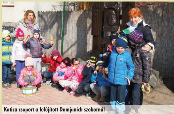
Katica csoport a felújított Damjanich szobornál

Március 15. egy olyan ünnep, amiről igazán lehet mesélni a gyerekeknek. Petőfi Sándor, Nemzeti Múzeum, huszárok... stb. Minden csoportban készültek a zászlók, kokárdák, csákok. Természetesen elhangzott a Nemzeti dal, a csatába hívó dalok, és megemlékeztünk mi is a gyerekekkel az elesett katonákról.