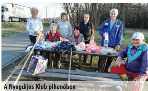
A Nyugdíjas Klub pihenőben