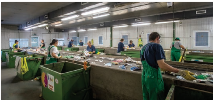
Az előkezelőben kézzel válogatják a hulladékot