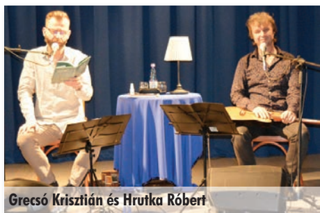
Grecsó Krisztián és Hrutka Róbert

Napjaink népszerű írója, zeneszerzője látogatott el Szadára március 29-én. Ez az est is bizonyította, hogy az értékrend az agglomeráció ezen régiójában is létezik. Ezt csak azért említem meg, mert a teltházas rendezvényen nemcsak szadaiak voltak. Grecsó Krisztián esetében meggyőződhetünk arról, hogy nemcsak a kortárs irodalom kiváló képviselője, hanem nagyszerű előadó és zenész is. Hrutka Róbert a hazai könnyűzenei élet meghatározó muzsikusa, 2001 és 2008 között számtalan slágert komponált. Több magyar filmhez szerzett zenét, pl. a most bemutatott Kincsemhez is. A műsor gerincét Grecsó Krisztián: Vera című könyve adta, ebből olvasott fel részleteket. A megzenésített