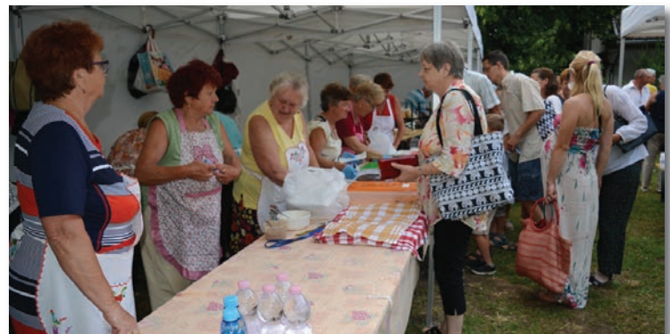
A gálaműsor után palacsintával és lángossal kínálta a vendégeket a Nyugdíjas Klub