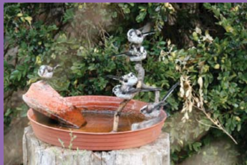
A virágálatét itatótálcaiban a kisebb madarak (öszapók) akár csoportosan is tudnak inni és fürdeni