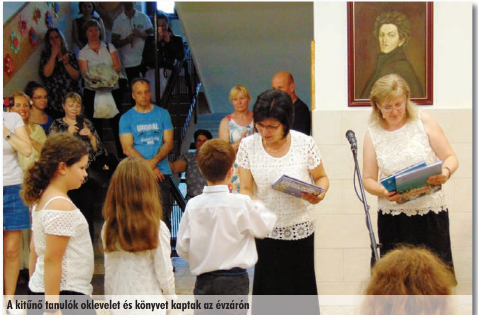
A kitűnő tanulók oklevelét és könyvet kaptak az évzárón

Kitűnő tanulóink könyvjutalmat, első osztályosainknak az egész évben végzett kitarító munkájukért emléklapot vehettek át. Idén is szép versenyeredményekkel büszkélkedhettünk: