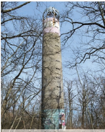
A túrajáték egyik célpontja a Margitán