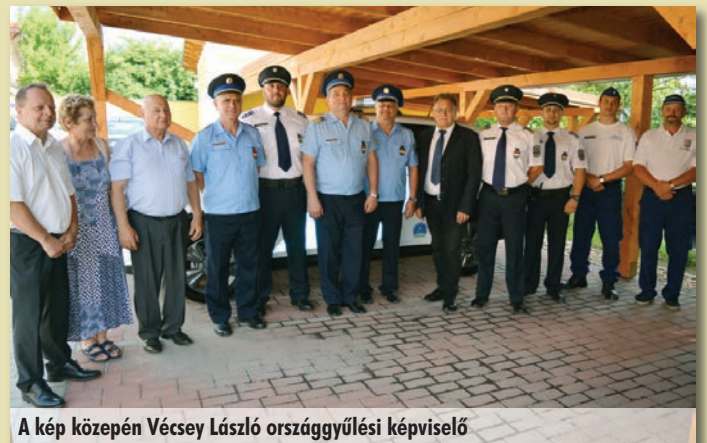
A kép közepén Vécsey László országgyűlési képviselő