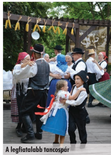
A legfiatalabb tancospár