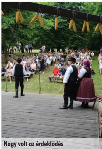
Nagy volt az érdeklődés