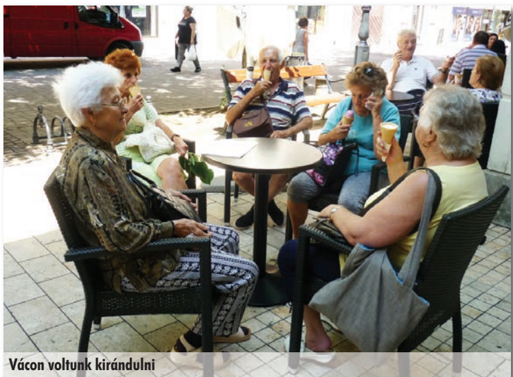
Vácra voltunk kirándulni

Ebben a hónapban Vácot tűztük ki úti célként. Szerencsére az időjárás is kegyes volt hozzánk, szép, meleg nyári nap volt. Megtekintettük a város nevezetességeit, sétáltunk a Duna parton, majd fagyiztunk egy közeli cukrászdában. Utunk végeztével kellemesen elfáradva tértünk haza.