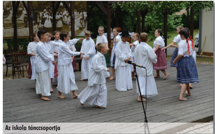
Az iskola táncsoportja