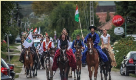
A menet élén a Szada SE lovasai

A Székely-kertben egyszerre több helyszínen zajlottak a programok