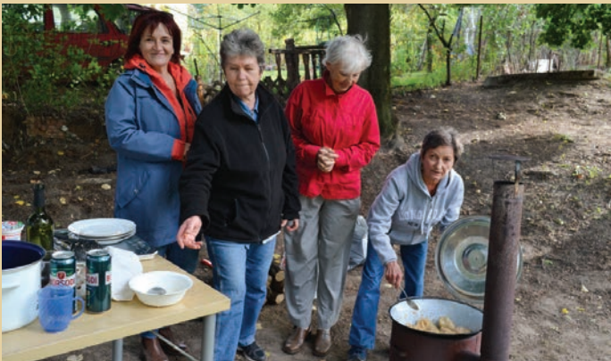
A szüreten mi is benevezünk a versenyre