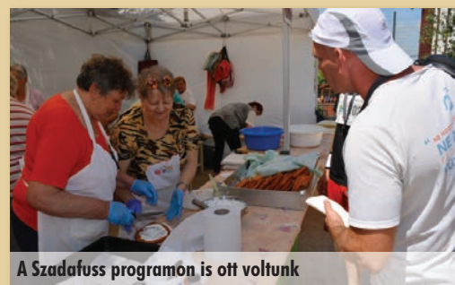
A Szadafuss programon is ott voltunk