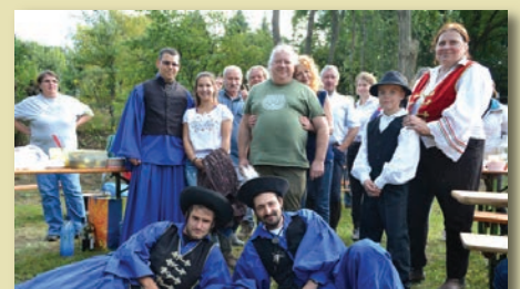
Szada SE lovasszakosztálya