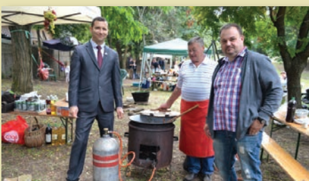
A VUE csapata