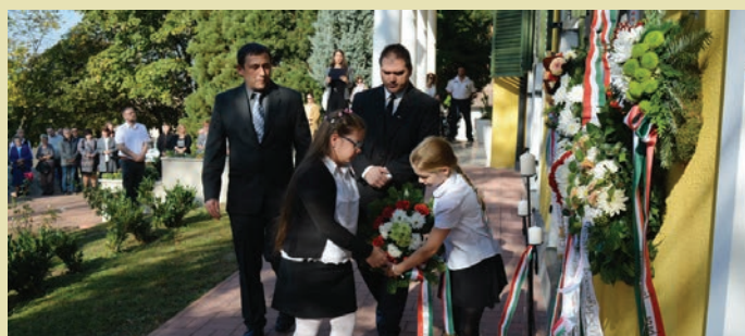
A református egyház is koszorúzott