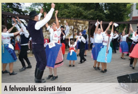
A felvonulók szüreti tánca