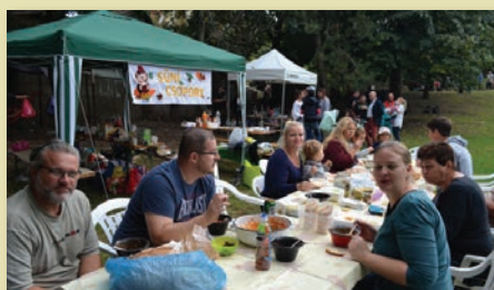
Süni csoport a főzőversenyen