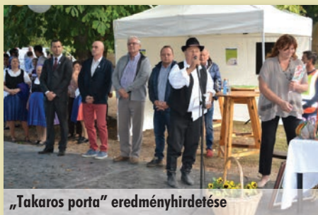
„Takaros porta” eredményhirdetése