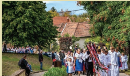
A felvonulók a Székely-kertnél