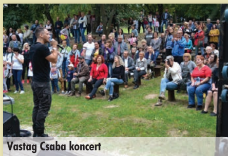
Vastag Csaba koncert