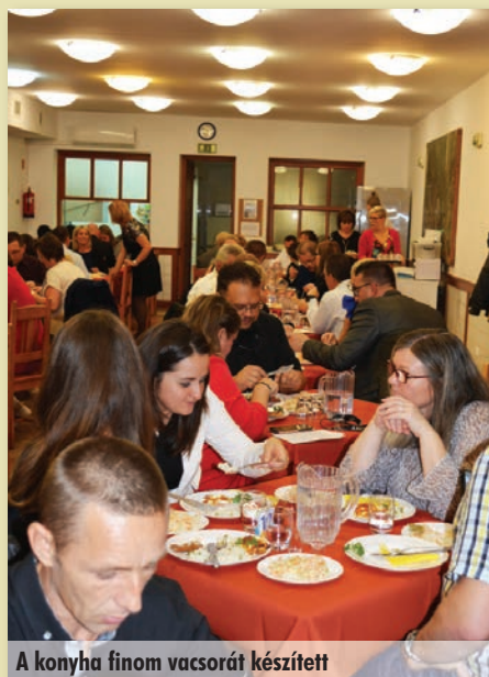
A konyha finom vacsorát készített