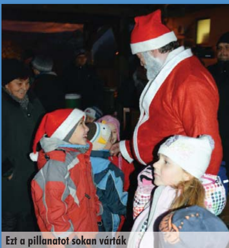
Ezt a pillanatot sokan várták