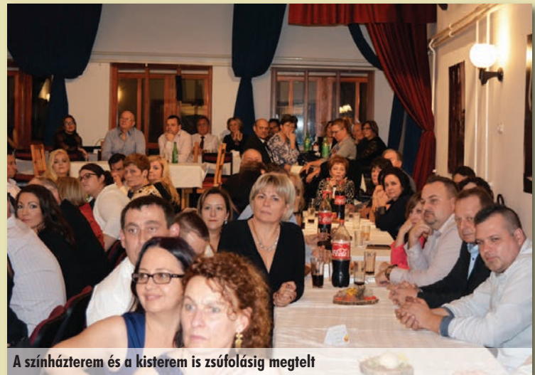
A színházterem és a kisterem is zsúfolásig megtelt