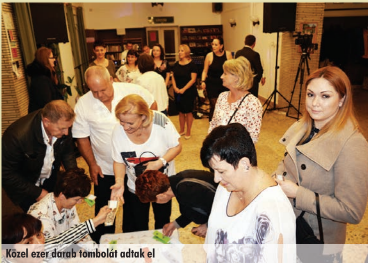
Közel ezer darab tombolát adtak el