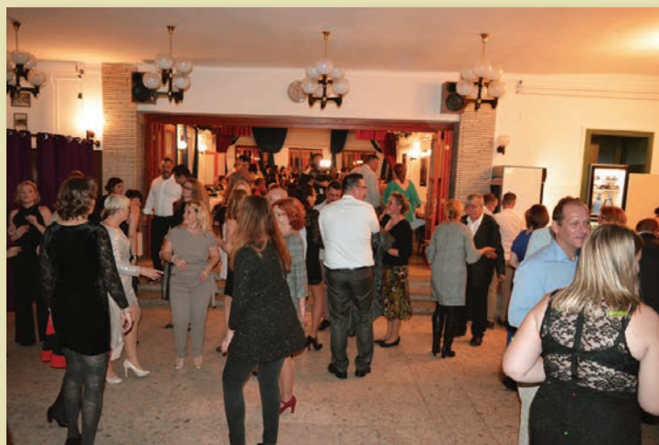
Minden korosztály önfelédten táncolt

tervek szerint csúszdát, rugós játékokat, mászókat és hintát telepítenek tavasszal a műfüves pálya mellé.