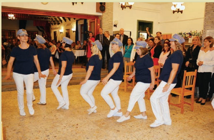
A műsorban az óvoda táncsoportja szerepelt