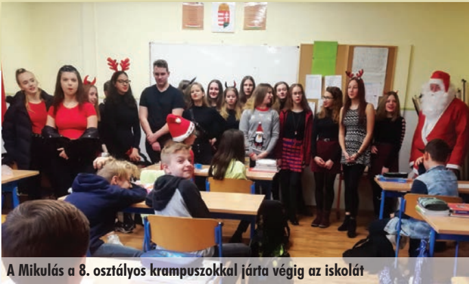
A Mikulás a 8. osztályos krampuszokkal járta végig az iskolát