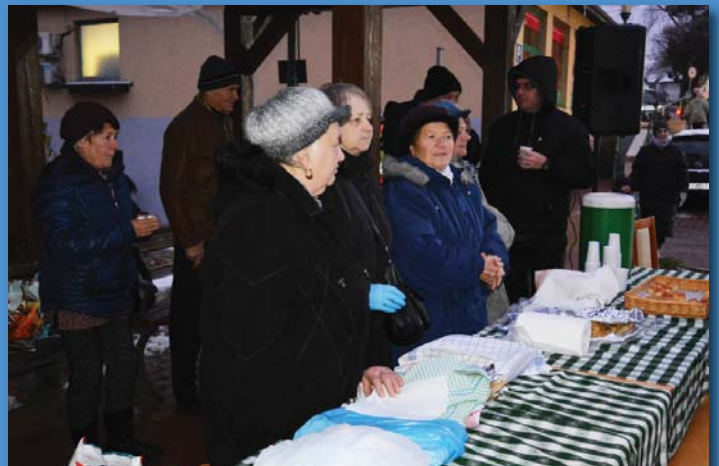
Meleg palacsintát kínált a Nyugdíjasklub