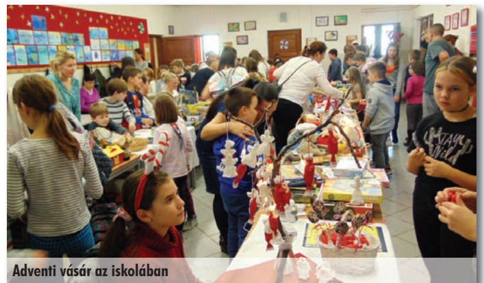
Adventi vásár az iskolában

Az idei alsó tagozatos rajzpályázatunkat a karácsony jegyében