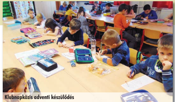
Klubnapközis adventi készülődés

hirdettük meg. Szerettük volna, ha a téma valamilyen szadai kötődéssel is rendelkezik, ezért kértük, hogy az alkotásokon legyen fellelhető valamilyen helyi nevezetesség, népszokás a templomhoz, a tájhoz, az iskolához, a családhoz, vagy akár a Faluházhoz kapcsolódóan. Majdnem mindegyik osztály nevezett szebbnél-szebb munkákkal.