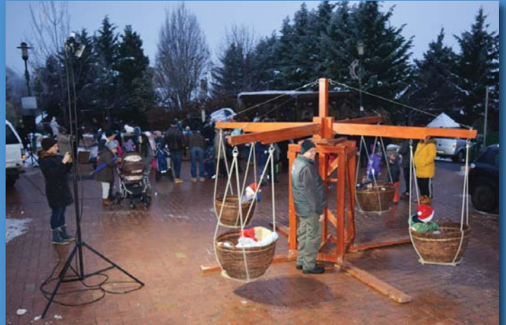
Állandó sor állt a körhintánál