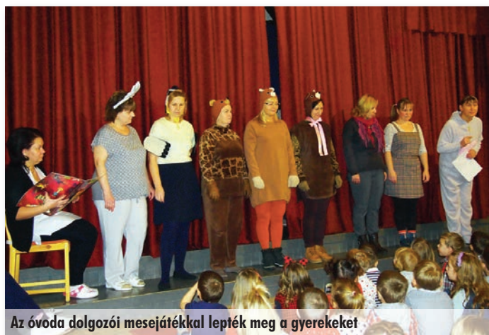
Az óvoda dolgozóinak mesejátékkal lepték meg a gyerekeket