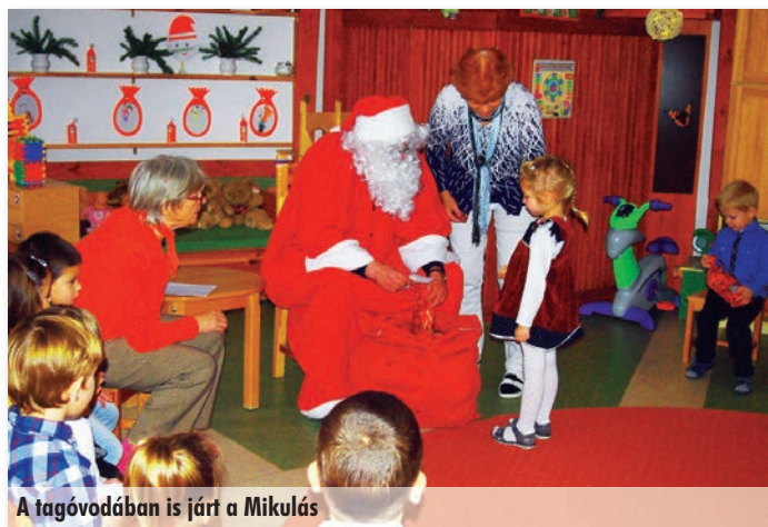
A tagóvodában is járt a Mikulás

Békés karácsonyi ünnepeket és boldog új évet kívánunk az óvoda dolgozóinak!