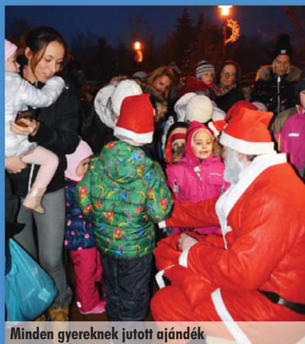
Minden gyereknek jutott ajándék