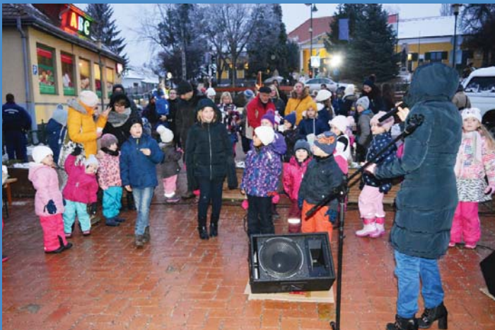
„Boribon muzsikál” mesekonzert