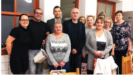
Karácsonyi ünnepségen a konyha dolgozóival