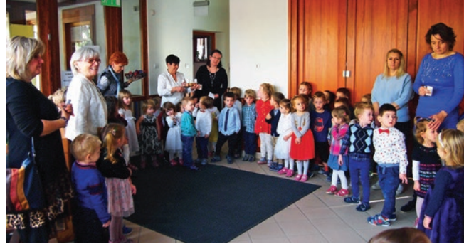
Karácsonyi ajándékosztás a tagóvodában

December 19-én hagyományunkhoz híven, az idén is ellátogattunk az idősek otthonába. A Mókus csoport ajándékokkal, karácsonyi énekkel, versekkel