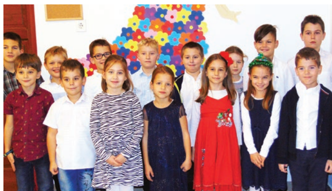
Vers- és prózamondó verseny legeredményesebb versenyzői