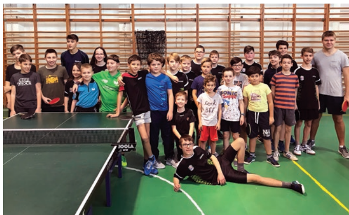
Gyermek kategóriában rekordszámú nevező volt