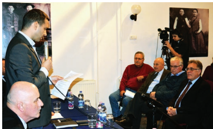
Pintér Lajos polgármester több kérdésre helyben adott választ

Szada Nagyközség Önkormányzatának új képviselő-testülete 2019. december 12-én este hat órára a Faluházban várta az érdeklődőket.