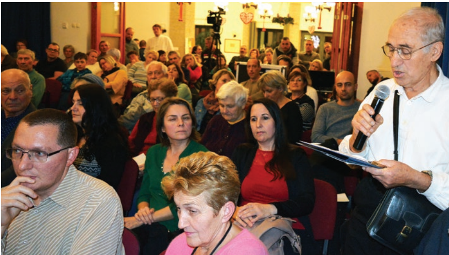
A lakosság részéről sok kérdés és észrevétel hangzott el

zati támogatással, de magán beruházásként épülhet meg a régi helyén, alul gyógyszer-tárral, az emeleten pedig egy szolgálati lakással. Az épület csak erre a célra használható.