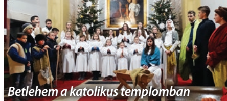
Betlehem a katolikus templomban

Idén február 26-án lesz hamvazószerda. Ezzel a nappal kezdődik a gyevenna-