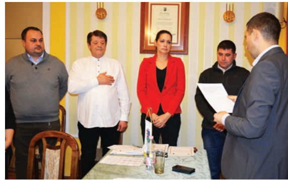
Esküt tettek a külsős bizottsági tagok

A hatékonyabb munkavégzés céljából most négy bizottság felállítására tettek javaslatot.