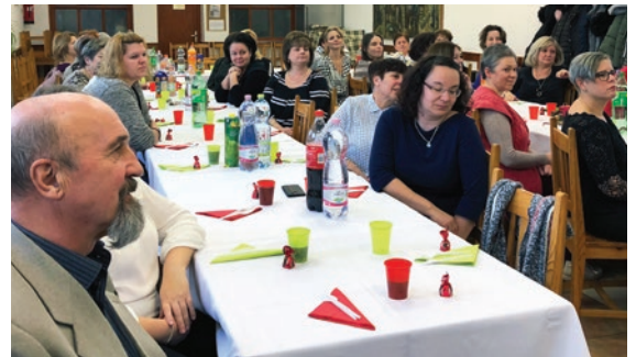
Karácsonyi délután az óvodában