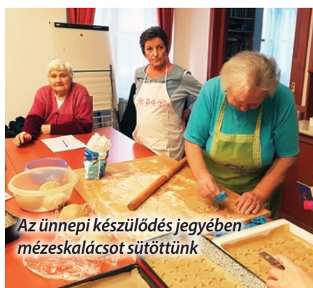
Az ünnepi készülődés jegyében mézeskalácsot sütöttünk