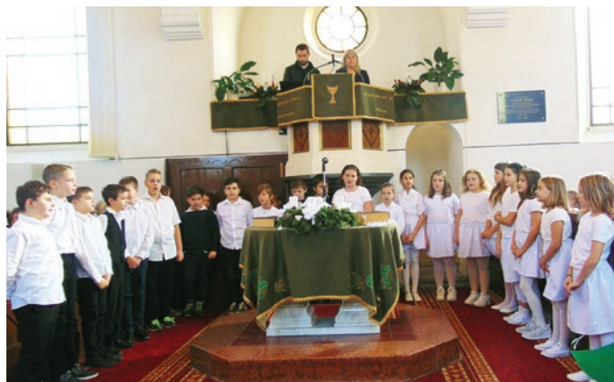
Advent a református templomban

Igazi karácsonyi ajándék volt minden jelenlévő számára ez az adventi délután!