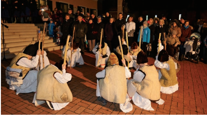
A szadai betlehemest az iskola 4. b osztálya adta elő